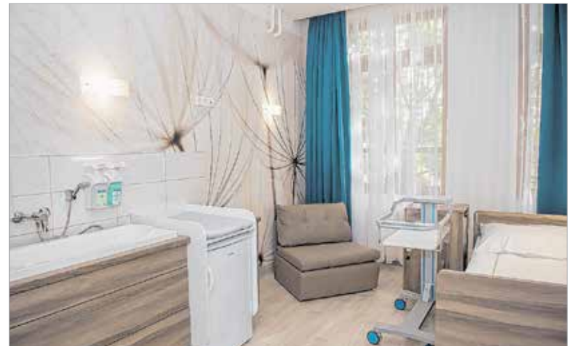
A berendezés olyan, mint otthon, de az ellátás professzionális. Híreink szerint kedden az első gyermek meg is született a felújított részlegen.