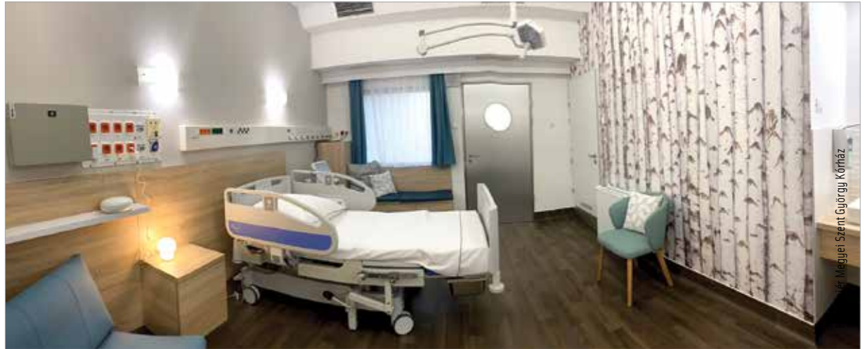
Nemcsak szép és kényelmes, de a berendezés is a legkorszerűbb