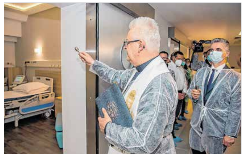
A megújult szülészobarészleget Spányi Antal megyés püspök áldotta meg