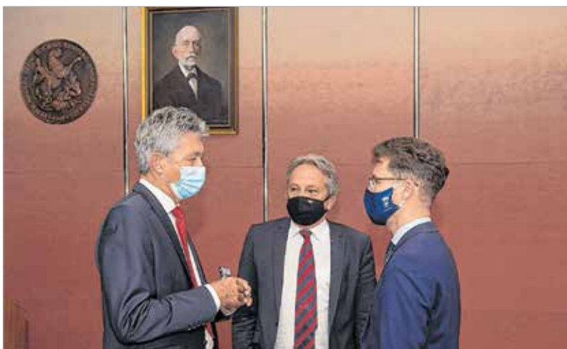
A magas színvonalú egészségügy az ország és a város közös érdeke. Fehérváron rengeteg kórházi fejlesztés valósult meg az utóbbi években, és még jelentősebbek előtt állunk.

tömbkórház, amely a modern elvárásoknak megfelelően fogja gyógyítani a fehérvári és Fejér megyei betegeket.” – egészítette ki Vargha Tamás országgyűlési képviselő.