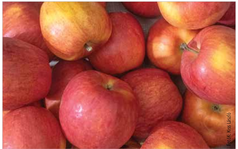
Minden nap egy alma az orvost távol tartja – szól a népi bölcsesség. Hallgassunk rá!

A megelőzés során – de még a gyógyulás folyamatában is – kiegészítő kezelésként nyúlunk bátran a gyógynövények után is! A legfontosabb természetes, immunerősítő csodaszerek tárháza kimeríthetetlen. A nagy C-vitamin tartalmú homoktövis és csipkebogyó, a gyulladáscsökkentő apróbojtorján,