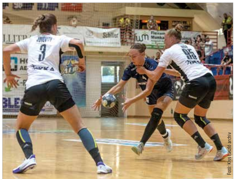
A Storhamar kiejtéséért alaposan meg kell küzdeni!

Az Európa-liga-mérkőzések hivatalos játéknapi a november 14-15-i, és 21-22-i hétvégék, melyek közül az előbbin pályaválasztó az Alba Fehérvár.