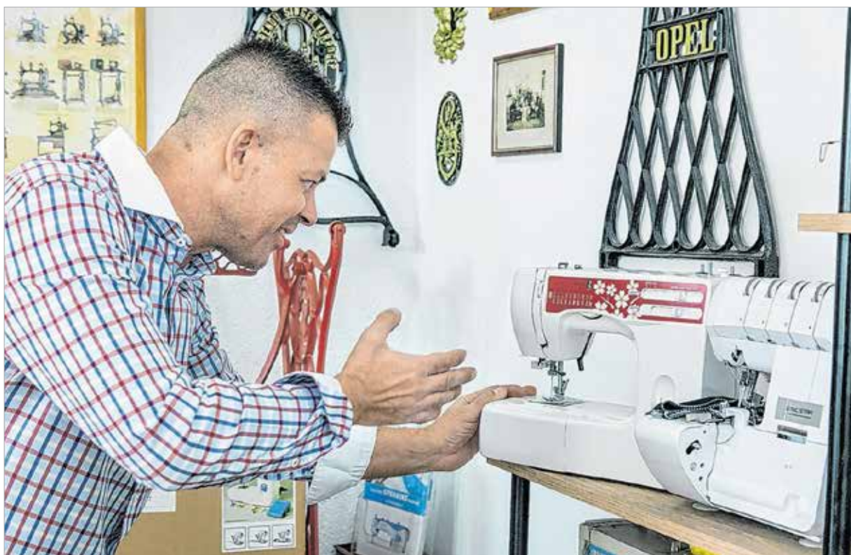
Szenvedéllyel fordul minden munkadarab felé

Jött a 2008-as válság. Nagy érvágás volt, kártyavárként omlott össze a cég. Akkor volt nyolc alkalmazottam, három webáruházam, harminc viszonteladóm az országban. Őt cégnek voltam a magyarországi képviselője. Hátamra vettem az országot, és folyamatosan mentem. A válság után egy időre búcsút mondtam a hivatásomnak.