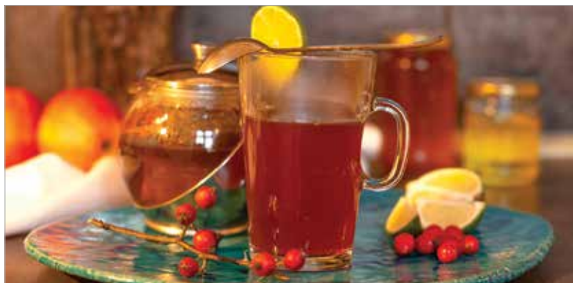
A gyógynövényforrázat ízesítés nélkül a legtermészetesebb, de finom és egészséges kiegészítője lehet a méz és a citrom is