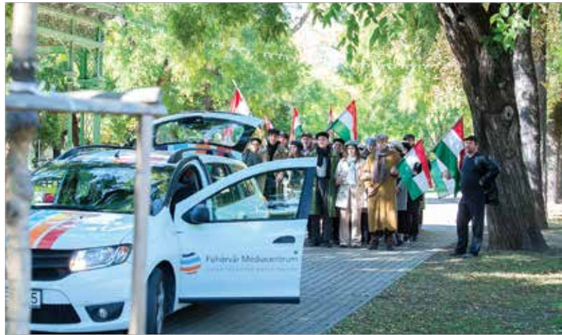
Indul a forradalmi menet – ilyen volt a Szemek című film forgatása

ba emelhesse. Ma is tartom, hogy kötelességünk emlékezni, hiszen nem feledhetjük: a vasfüggöny, a kettéosztott Európa idején 1956 emléke igazodási pont volt. Egy generáció közös élménye, hogy diákok, munkások, értelmiségiek lázadtak a totális diktatúra ellen. Ehhez jött még a csehszlovák '68, majd a lengyel '80-81. Mindez így együtt lett a közép-európai népek szabadságvágyának közös kulturális kódja. Az érzetet, magát a kódot azonban hamarosan felülírta a rendszer-változás. Szabadok lettünk, más kérdések kerültek érdeklődésünk homlokterébe, és ez az új generációkra fokozottan igaz. Ezért is fontos Matuz János és csapata Szemek című filmje, mert a lehető legjobbkor mutat utat!