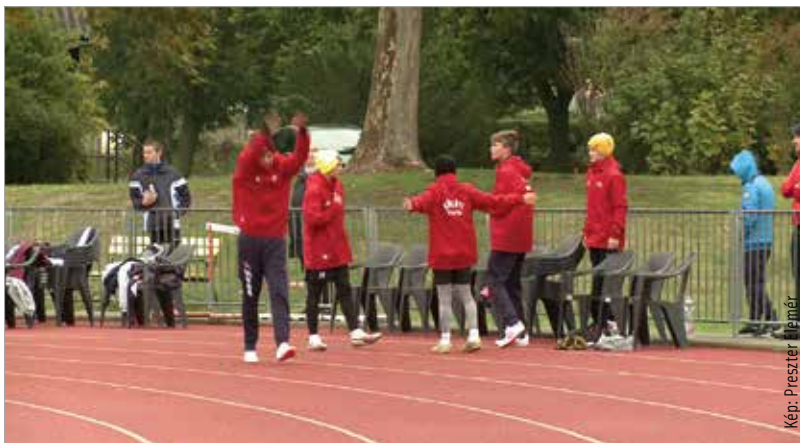
Számos versenyszámban ért el dobogós helyezést fehérvári iskola

A diákok távolugrásban, magasugrásban, kislabdahajításban, súlylökésben is jeleskedtek, majd váltófutásban mérték össze gyorsaságukat a csapatok. A szervezők örülnek, hogy a járványhelyzetben is meg tudták rendezni a versenyt: „Kevesen vagyunk, akik ilyen csinálhattak – ez a szabadtér miatt lehetséges. A szabályok betartása nagyon fontos számunkra, de a szabadtéren való versenyzést engedélyezték, így nagyon helyes, hogy ezen a hétvégén a fiatalok mozoghattak! Ezt kívánom minden más sportág képviselőinek is!” – hangsúlyozta Molnár Ferenc a Diákolimpia szervezői képviselőjében.