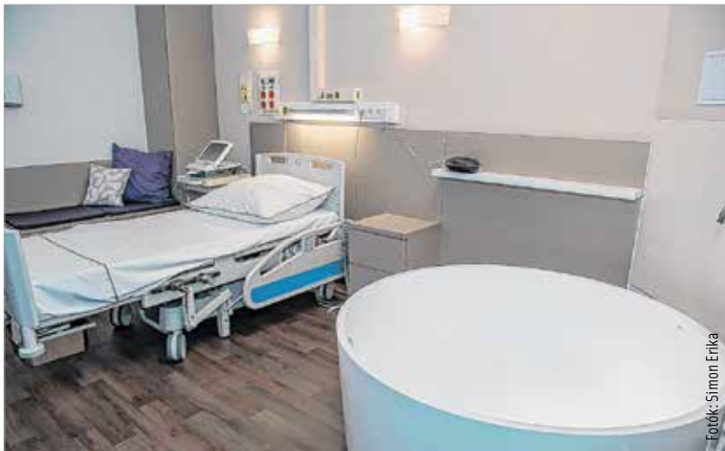
Kádban szülésre is van lehetőség

„Ez most egy kétszázmillió forintos fejlesztés volt. Ha az eddigi jó néhány, kisebb fejlesztési összeget összeadjuk, az is több milliárd forint, és itt állunk a kapujában a még csak papíron elő-rehaladó következő tömb megépítésének. Bízom benne, hogy az is mielőbb elkészül! Ezzel teljessé válik az a