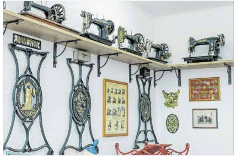
Sok családban akad egy-egy régi varrógép, ami igazi kincs!