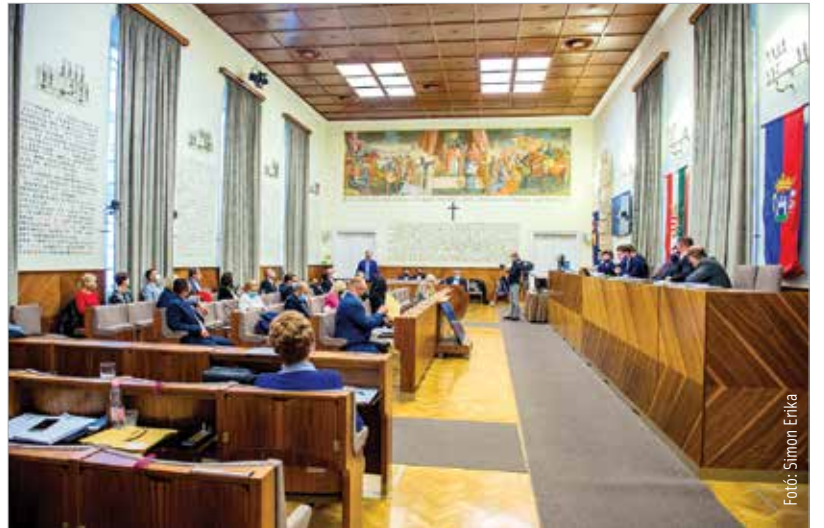
Harminc évvel ezelőtt ülésezett először a Városháza Dísztermében az első demokratikusan választott önkormányzati képviselő-testület

A közgyűlés elindította a közbeszerzési eljárást a Prohászka és a kis Budai út felújításának kivitelezésére, így tavasszal már elindulhat a munka a területeken. A régén várt rekonstrukció a Várkorút, a Budai út és a Prohászka Ottokár utca csomópontját, a Prohászka Ottokár utcát és a kis Budai út közműveit érinti, és az ivóvízvezeték és a szennyvízcsatorna felújítását is jelenti. A munkálatok útfelújítást és kerékpárút-építést is tartalmaznak.