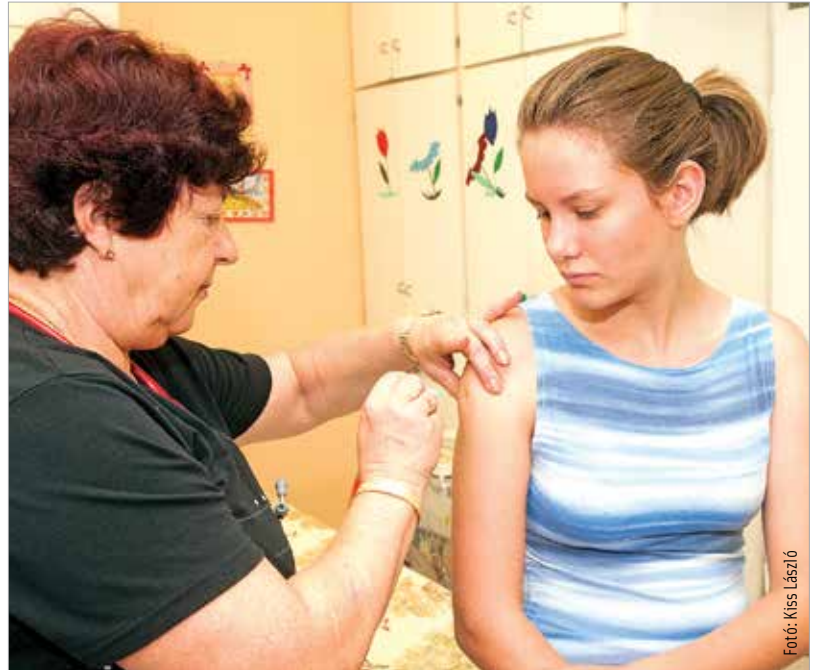
Idén különösen ajánlják a védőoltást a szakemberek, ráadásul most mindenki számára ingyenes!

att nagyon nehéz megállapítani, hogy egy beteg influenzával vagy koronavírusal fertőződött meg. A védelem azért is fontos, mert nemzetközi tanulmányok szerint megduplázódik a halálozás esélye, ha valaki egyszerre szenved koronavírus- és influenza-fertőzésben.