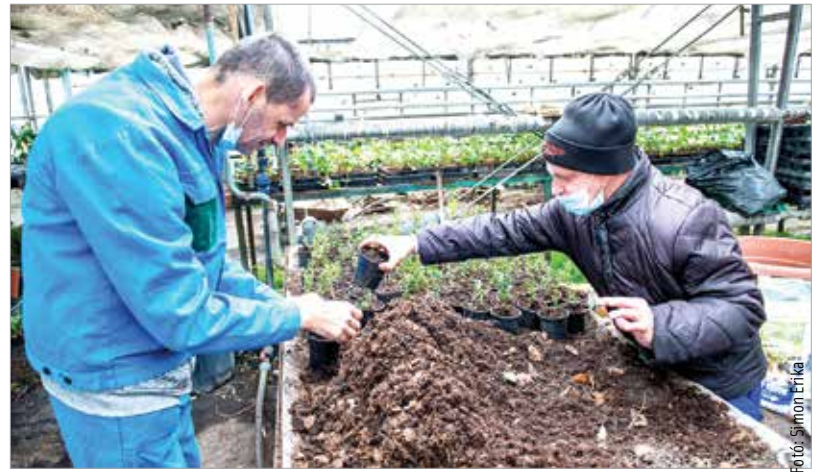
Az egyik városi kertészet is csatlakozott a programhoz