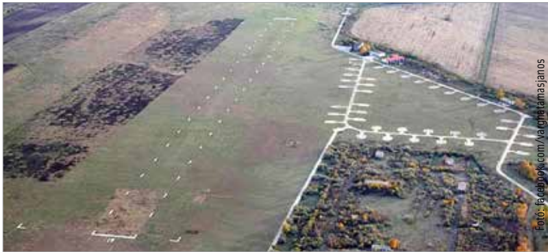
A börgöndi reptér az állam és a város közös fejlesztése

A beruházás megvalósulásával kapcsolatban most újabb fejlemények vannak: „A kormány döntése értelmében városunk háromszázhetvenöt és fél millió forint egyedi, azonnali költségvetési forráshoz jut ingatlanvásárlás támogatása címén. Ez a kormánydöntés a börgöndi repülőtérhez kapcsolódó városi területvásárlást finanszírozza a Modern Városok Programja keretében.” – tette közzé múlt pénteken Vargha Tamás parlamenti képviselő.