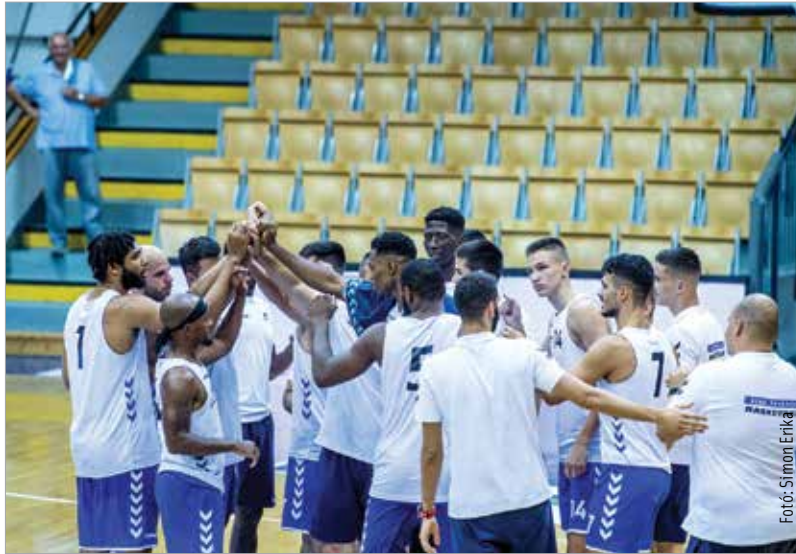
Ennél azért több szurkoló lehet az első bajnokin, de szellős lesz a nézőtér a szabályok miatt