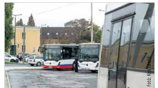
Töredezett aszfalt helyett korszerűen kialakított buszpályaudvar kap helyet a vasútállomásnál

Érdeke a városnak is, hogy a helyi közösségi közlekedés a jövőben minél több modern meghajtású, akár megújuló energiával működő autóbusszal legyen ellátva. „Jelenleg vizsgálják a szakemberek annak lehetőségét, hogy egy nagyobb elektromosbusz-flotta töltése hol és hogyan oldható meg, hiszen itt nagy teljesítményre van szükség. Előrehaladtak a fejlesztések a hidrogéncellás technológiákban is, aminek alkalmazása tíz-tizenöt éves távlatban szintén megfontolandó!” – tudtuk meg a Közlekedési Irodától.