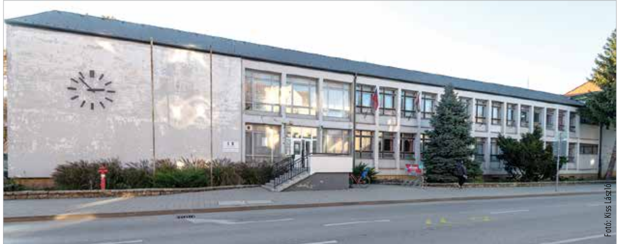
A Hunyadiból sem csak ennyit láthatunk: folyamatosan készülnek az online ismertető a pályaválasztók számára

A Hunyadiban szeptember elejétől folyamatosan online anyagokon dolgoz-