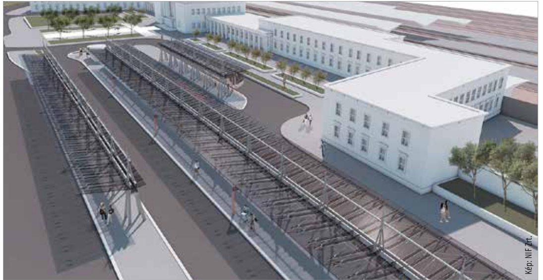
A buszmegálló vázlati terve

Két területen is létesül nagyobb kapacitású parkoló: a vasút déli oldalán, a gyalogos-felül-