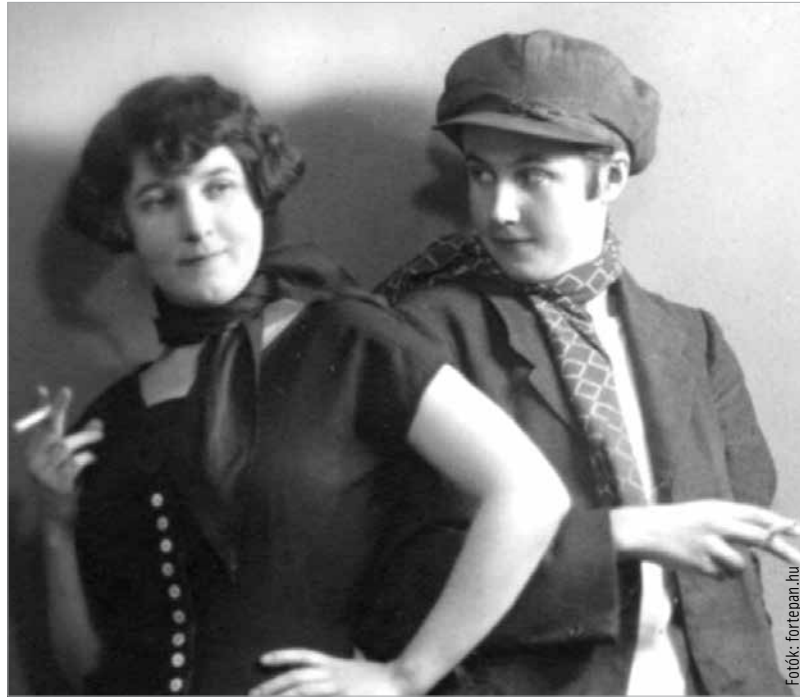
A fehérvári kéj nőket rendszeresen ellenőrizte orvos (képünk illusztráció)

1863-ban a helytartótanács a korabeli viszonylatban tetemes összeget, 1786 krajcárt fordított a szifilisz betegek kezelésére. (Az előző években ennek csak a harmadát.) Városunkban az új, Budai úti kórház pácienseinek nagy része is ezzel a betegséggel küzdött. A helyzeten valamelyes javíthatott az