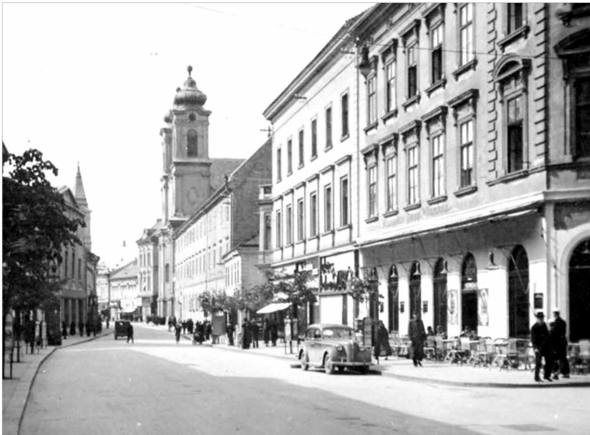
A kéj nők ebéridőben és a kora esti órákban nem mutatkozhattak a belvárosban

A kocsmákban április tizenötödike és október tizenötödike között este kilenc után jelenhettek meg. A hatóság valószínűleg a rövidebb nappalok miatt a téli hónapokban megengedőbb volt: a hölgyek az éjjeli műszakot valamivel korábban, már este nyolckor elkezdheték.