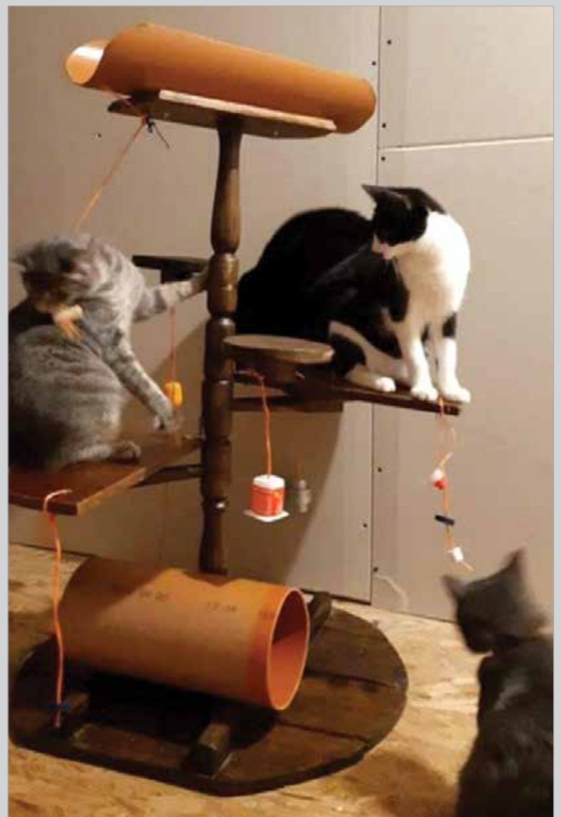
2. helyezett: Hedlicska Ágnes – „Cicajátszóter”