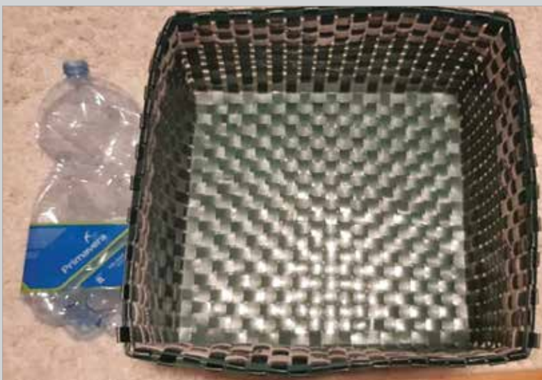
1. helyezett: Balogné Szórád Gizella – „Használt pántolászalagból kosár”