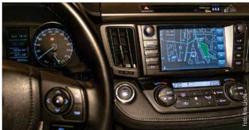
A számítógép az autóban is átveszi az irányítást?

Az újításra azért van szükség, mert ezek a felszerelések csökkentik a közúti balesetből származó halálesetek számát, segítve a fáradt vagy figyelmetlen sofőrt a veszély érzékelésében. Az intelligens sebességszabályozó rendszer például térkép és közlekedési táblák alapján figyelmezteti a sofőrt, ha túllépi a sebességkorlátozást. Ugyanakkor nem korlátozza a sebességet, és a sofőr bármikor kikapcsolhatja. Az új személyautókba fejlett vészfékező rendszer és vészhelyzetben működésbe lépő sávartó rendszert is be kell majd szerelni. A legtöbb fenti technológia bevezetése az új modellekben már 2022 májusától, 2024-től pedig az összes létező modellben kötelező.