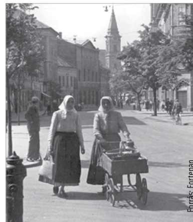
Hazafelé a piacról valamikor a hatvanas években

A helyi legenda úgy tartja: aki megsimogatja az orrát, annak szerencséje lesz, ezért a szobor orra az évek során kifényesedett. Az egykori fertályos asszony családja is mindig megáll a szobornál, de ők nem az orrát, hanem a kezét szokták megsimítani.