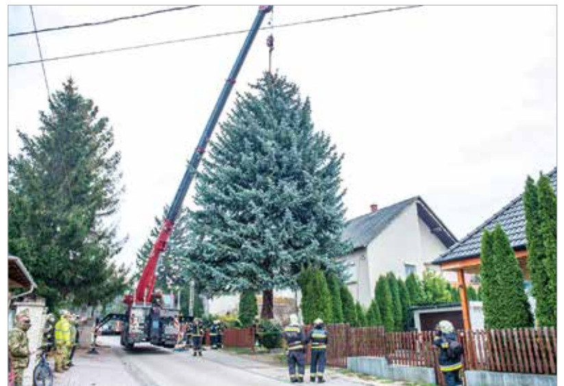
Miután kivágták a tűzoltók az ezüsthenyőt, a katonaság egyik kamionjára rögzítették és a fővárosba szállították azt