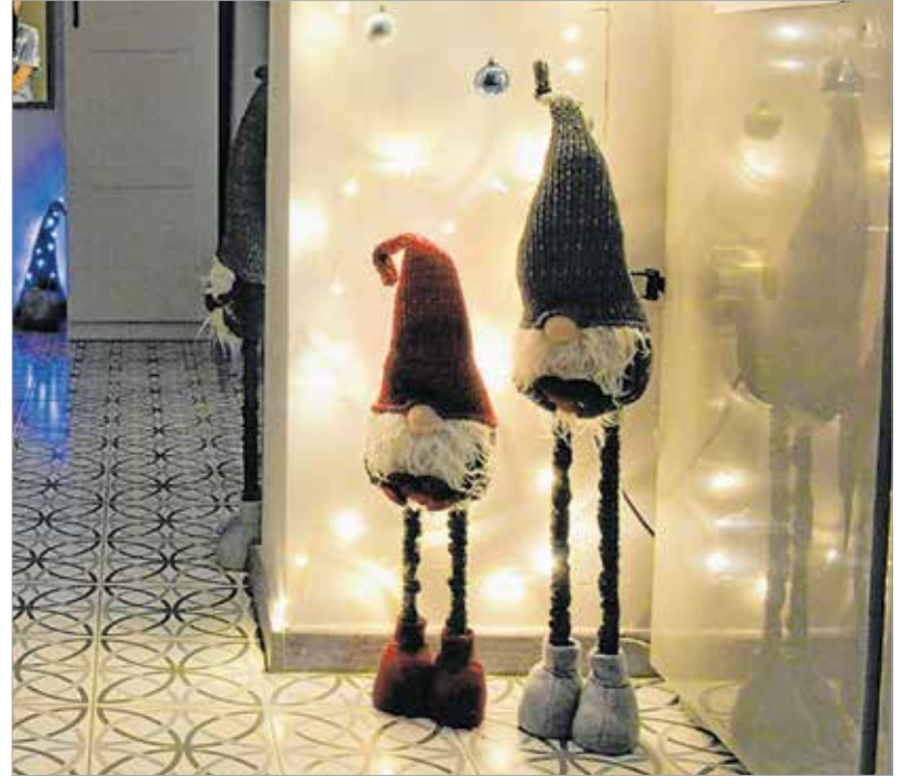
Másfél hétig tartott, mire mindent kivilágítottak