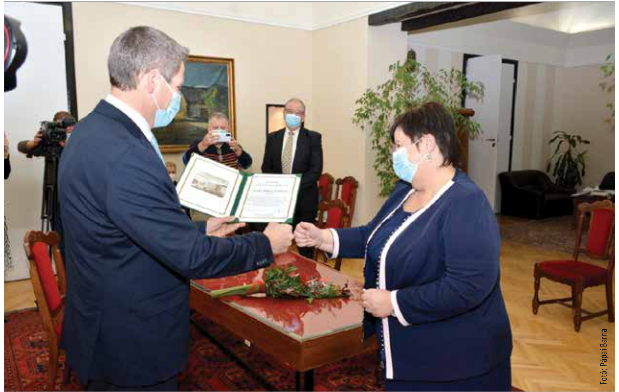
Elismerő oklevelet ad át a Fejér Megyei Közgyűlés elnöke

Tényleg ott voltam minden nap, hétkor, még a legutolsó nap is. És