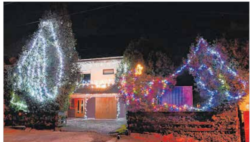
Nagyszülei házat is fénybe borította