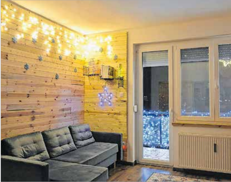
Az idei alkotás fantázianeve: Aranyeső a szép balkonra