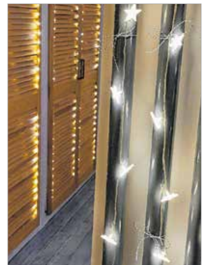
Az egész lakáson végigvonulnak a fényfüzerek