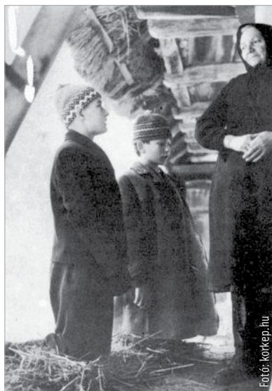
Luca-napi szokás volt a kotyolás is: a legények szalmán térdelve mondanak áldást a házra

Még híresebb karácsony harmadik napja, a János-nap. Ekkor jártak a legények házról házra, hogy a Jánosokat különböző énekekkel, rigmusokkal köszöntsék, és persze mindenhol megkínálták őket egy kis itallal. János-napkor szokott lenni a borszentelés is a templomokban. Ilyenkor a bortermelő gazdák – Fejér megye majdnem minden községében – egy-egy üveg bort vittek a reggeli misére, melynek végén a pap megszentelte azt. Ebből a szentelt borból aztán egy-egy kortyot minden hordóba öntöttek a pincében, hogy az megvédjé a megromlástól. A szentelt bor egy részét eltették, és járvány, betegség idején egy-egy kortyot adtak a betegnek.