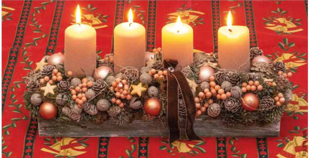
Ma már nem találni családi otthonot, irodát, munkahelyet adventi koszorú nélkül, igaz, a formák sokkal szabadabbak, a kör alakú helyett az egy sorba rendezett gyertya is divatos

Az egyre világosodó várakozást a december tizenharmadikai Luca-nap is jelzi, hiszen a Luca név a lux, vagyis a latin fény szóból ered. A régi római naptár szerint erre a napra esett a téli napforduló, így határnapként és dologtiltó napként tartották számon, amihez sok hagyomány, rituálé társult.