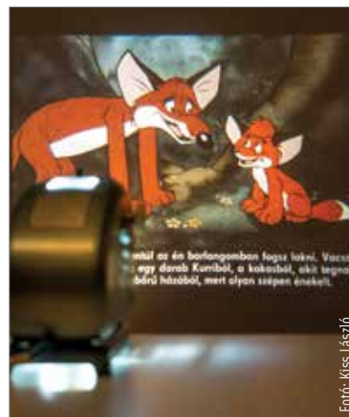
A diavetítés az egész családnak nagy élmény!

Ez a program már kellékgényesebb, viszont egyértelműen