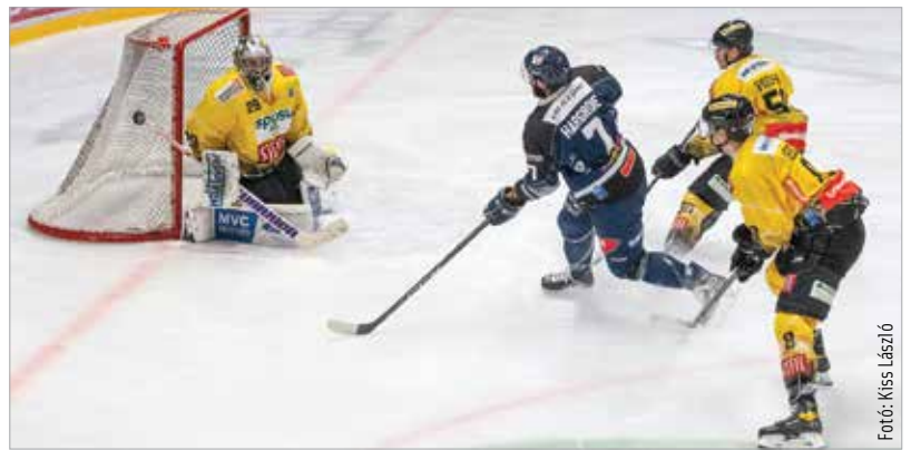
Az elmúlt pár meccsen remekelt a Volán!

gödörbe került – öt meccsen mindössze egy pontot sikerült bezsebelni – azóta azonban újra visszatértek a győzelem útjára, és a legutóbbi három meccset egyaránt megnyerték. Ráadásul a Linz, a Villach és a Graz ellen is mindhárom pontot a fehérváriak neve mellé vették be. A megszerzett kilenc pont azt jelenti, hogy a Volán biztonságosnak tűnő távolságból tekinthet az öt üldöző Salzburgra: hét pont a különbség a két együttes között. A következő hetekben folytatódik a nagyüzem: a fehérváriakra még ebben az évben, vagyis két hét alatt hét meccs vár. Csütörtökön a Klagenfurt érkezik az Ifjabb Ocskay Gábor Jégcsarnokba, ahová sajnós szurkolók továbbra sem léphetnek be.