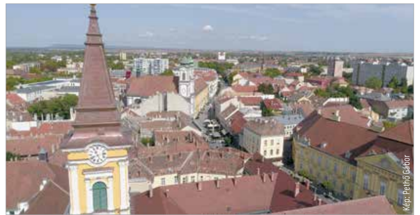
Székesfehérváron az országban negyedikként érhető el az 5G-szolgáltatás