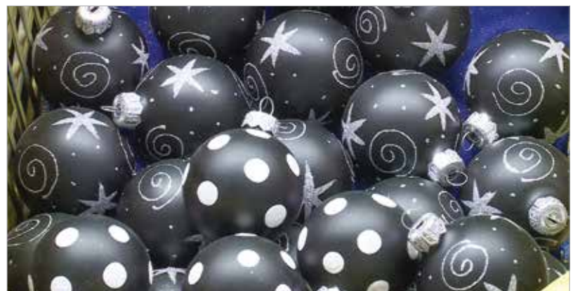
Fekete vagy fehér legyen a karácsony?