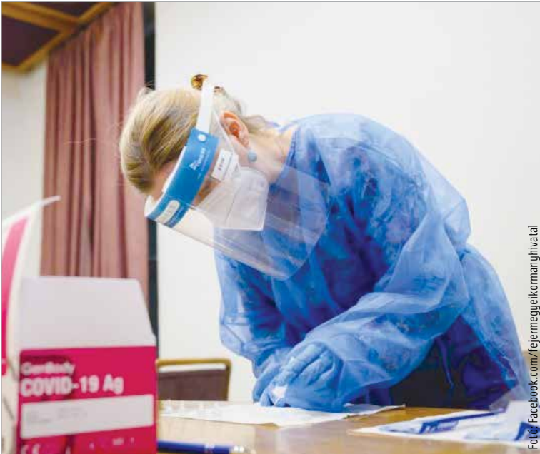
A vizsgálatok célja a járvány terjedésének további lassítása és az emberek egészségének védelme. Az érintettek a várakozás elkerülése érdekében a szoczsures.kh.gov.hu honlapon foglalhatnak időpontot.

A tesztelést a kormányhivatalok szervezik a január 16-17-i hétfő-gén. Országsszerte százhuszonhét mintavételi ponton várják az ágazatban dolgozókat – tájékoztatott a kormányhivatal.