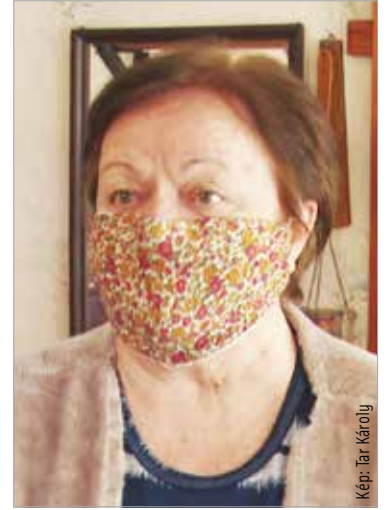
valaki nagyon komoly mellékhatást tapasztalt volna.”

„Számomra nem kérdés, hogy beoltassam magam! Szerintem nincs más esélyünk a vírus legyőzésére. Az önkormányzat igényfelmérést végzett az oltással kapcsolatban a nyugdíjasok körében. Az Öreghegyi Nyugdíjasklub vezetőjeként elmondhatom, hogy a száztizenkét fős klubunk tagjainak nagy része az oltást pártolja. Hetvenöt embert sikerült elérnem, közülük négyen egyértelműen elutasították a vakcinát, de több mint ötvenen regisztráltak már. Néhányan vannak, akik még kívárnak, de nem utasítják el. Mindenkinek át kell gondolni, hogyan tudja megvédeni magát és a családját, mert más védekezési mód ebben a pillanatban nem áll rendelkezésre. Én az influenza ellen is beoltattam magam, nem volt rossz tapasztalatom, és nem is hallottam, hogy