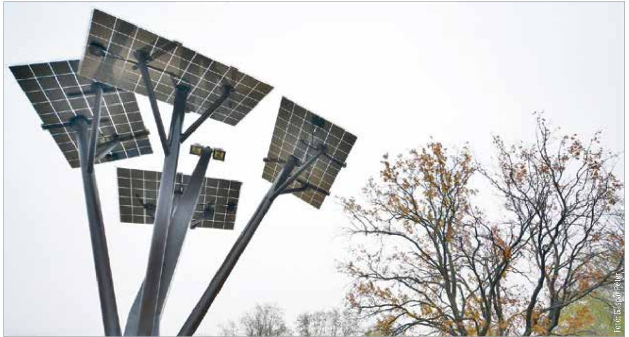
Vonzóak az okosmegoldások