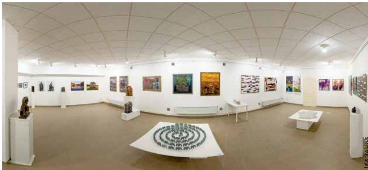
A tárlat a galéria közösségi oldalán valamint honlapján (artezi.hu) is megtekinthető