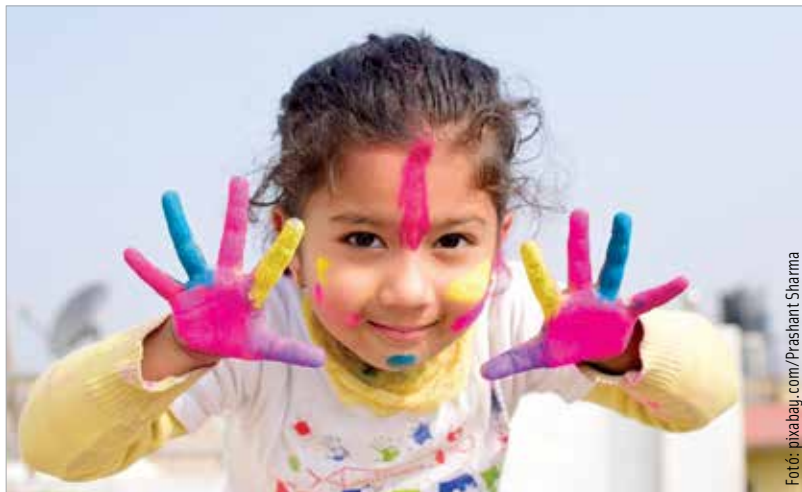
Mindenkinek van kedvenc színe

Szinte mindenkinek van kedvenc színe, amit szeret maga körül látni az otthonában vagy ruhaválasztáskor előnyben részesít. A színek nemcsak jó – esetenként rossz – érzéssel tölthetnek el minket, de a teljesítményünk-re is hatással lehetnek. Erre pedig egy szürkés, tompa téli napon nagy szükségünk lehet! Főként, hogy a korlátozá-