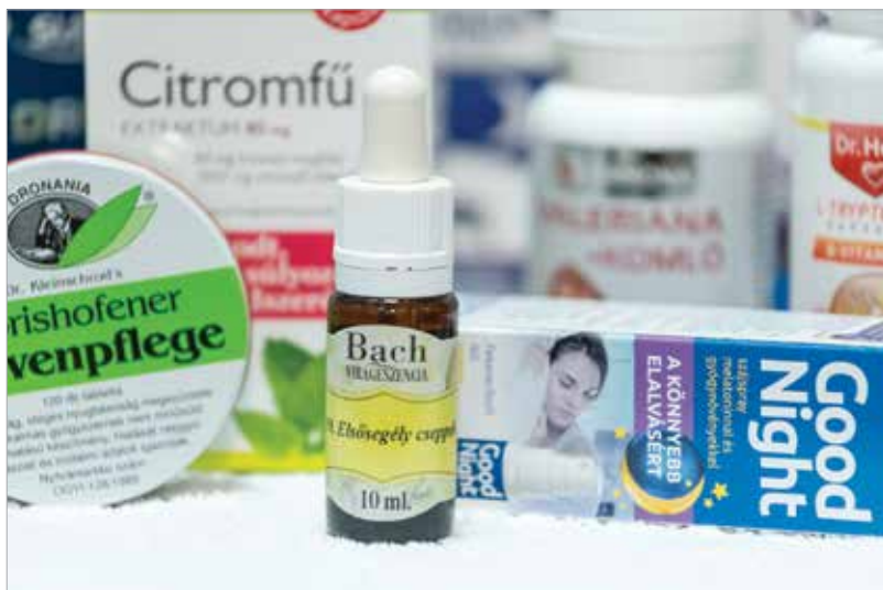
Ma már rengeteg elalvást és mélyalvást segítő szer létezik, közülük az egyik legnépszerűbb a virágterápiás csepp

A mellékvesekéreg gátoltsága vagy gyengesége is okozhat átváltsi zavarokat. Erre is megvannak azok a gyógynövények, amelyek segíteni tudnak. Azt látom azonban, hogy azok a szerek, amelyeket rendszeresen kell szedni, sokszor azért nem érnek célba, mert csak kevesen tudják betartani a rendszerességet. Erre jobban oda kéne figyelni, és türelmesebbnek kellene lenni! Nem biztos, hogy egy hét alatt fogunk visszatérni a normál alváshoz, elképzelhető, hogy több idő kell a szervezetnek.