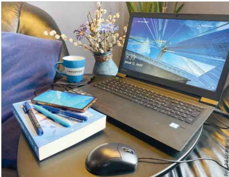
A kék szín segít az elcsendesedésben

Ez a szín nemcsak képes fokozni a szellemi aktivitás, pozitívítást sugároz, de a legerősebb pszichológiai hatással bíró árnyalatnak tartják.