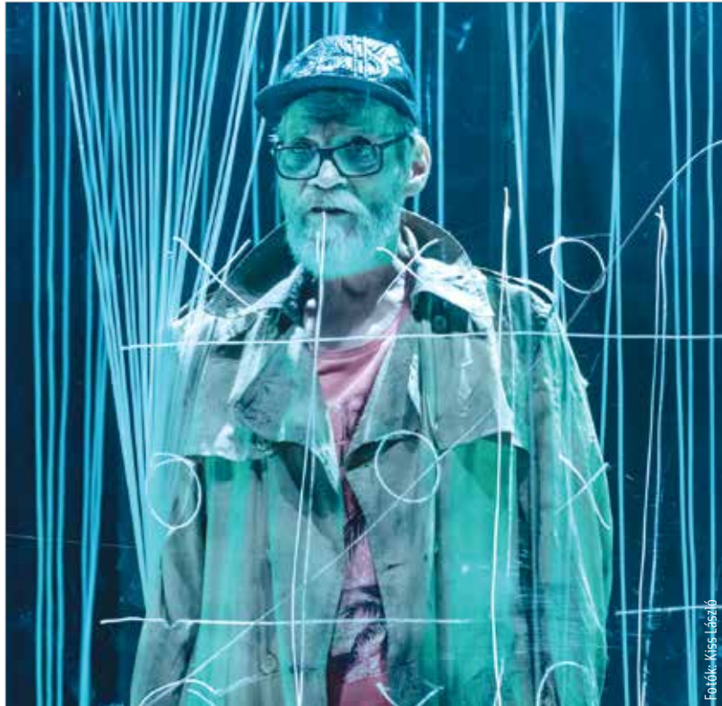
Közeleg az idő: Knuttebarn szerepében

Megérkeztek 2013-hoz, a Vörösmarty Színházhoz. Tudjuk, hogy ezt a társulatot sem a szél fújta össze.