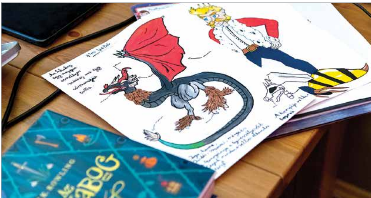
Ezek a rajzok kerültek be Az Ickabogba