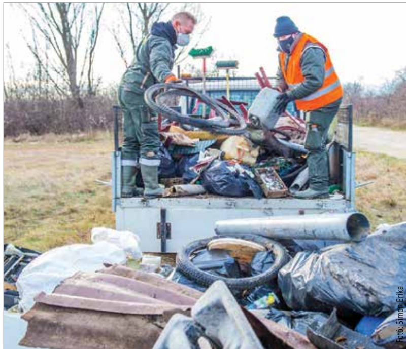
Múlt csütörtökön a város Szárazrét felőli határán, a Hernád utca végében gyűjtötték össze az illegálisan lerakott hulladékot a Városgondnokság szakemberei