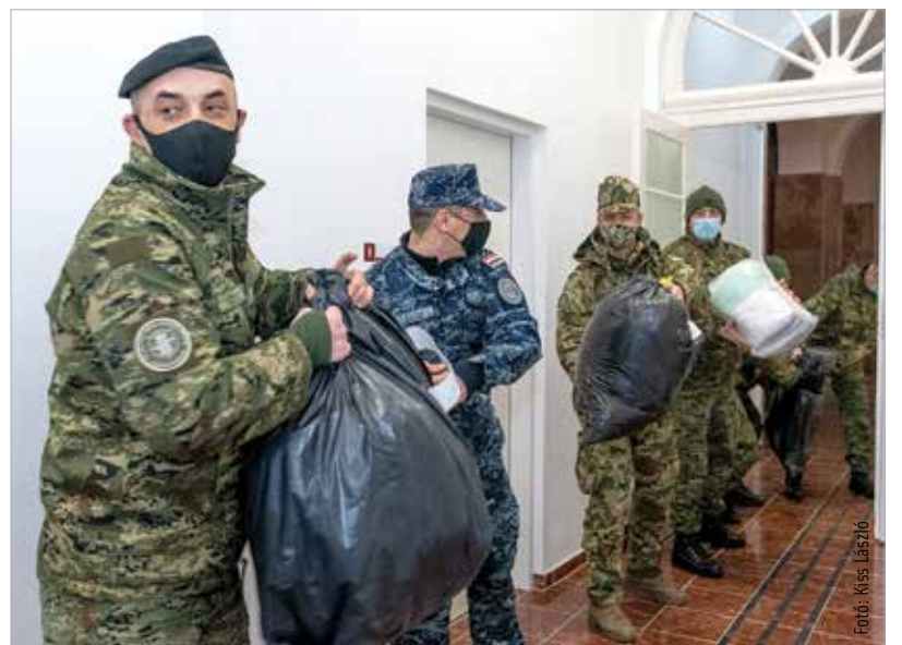
Egy teherautónyi segélyszállítmány indult Fehérvárról Horvátországba