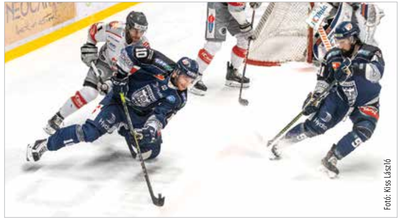
Eddig remekel a Volán!

erősebb támadója, aki harmincnégy mérkőzésen harmincöt pontot szerzett. – „Jobban is szeretem az ilyen időszakot, mint azt, ami most vár ránk!” A január huszonkilencedikei, Bolzano elleni összecsapásig nem játszik mérkőzést a csapat, van idő a finomhangolásra az utolsó négy összecsapás előtt. És hogy a remek szezon ellenére van min dolgozni, arra talán pont az elmúlt hétvége két hazai találkozója mutatott rá: a Dornbirn ellen nem sikerült gólt lőni sem (0-3), míg az Innsbruckot csak hosszabbításban verte a gárda. Hogy mennyire kényeztette el szurkolóit a klub, jól mutatja, hogy nem ilyen hétvégékhez szoktunk!