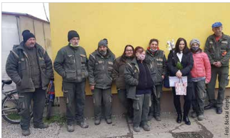
Kilencen munkát, négyen szállást is kaptak a Városgondnokságtól

2019 februárjában több mint harminc érdeklődővel indultak, majd április első napján húsz hajléktalan kezdte meg a munkát a Városgondnokságnál parkfenntartó-gondozó munkakörben, akik közül tizenhárom sikeres vizsgát is tettek kilenc hónappal később. A projekt végére tizen maradtak, közülük kilencen határozatlan idejű munkaszerződést kaptak a Városgondnokságtól, a Parkfenntartási Csoportban.