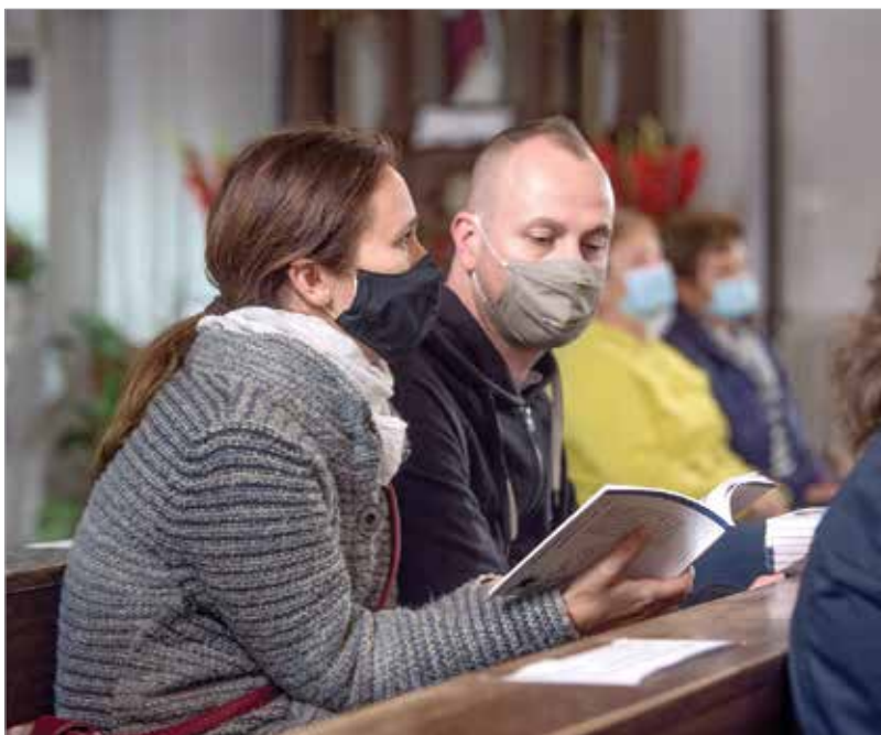
A Szellősétának bizonyosan lesz folytatása

Jelentkezés: 06 70 778 54 51 ellenorzes@privatposta.hu