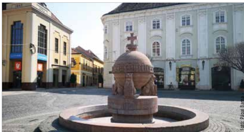
A Pátria Kávéház és Étterem is szerepel az adatbázisban, de nem regisztráltak és nem is nyitottak ki

Lapzártánkkor még mindig kétszáznegy olyan hely található rajta, amelyek elvileg hétfőn már helyszíni fogyasztásra várták a vendégeket, kockáztatva a kormány által belengetett súlyos bírságot. Székesfehérvárról összesen öt étterem szerepel a térképén – a Marxim Pizzéria mellett a Ring Sarok Söröző és Pizzéria, a HB Söröző, a Pátria Kávéház és Étterem