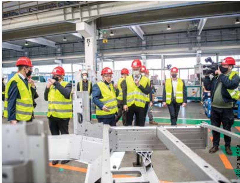
A kormány mostani, közel egymilliárdos támogatásának köszönhetően ezeröttszáz munkahelyet védenek meg és ötven újat hoznak létre a Hydro fehérvári gyárában

„Az elmúlt időszakban elsősorban az autóparrá, járművek szerkezeti elemeinek gyártására koncentráltunk. Könnyű és erős, de komplex