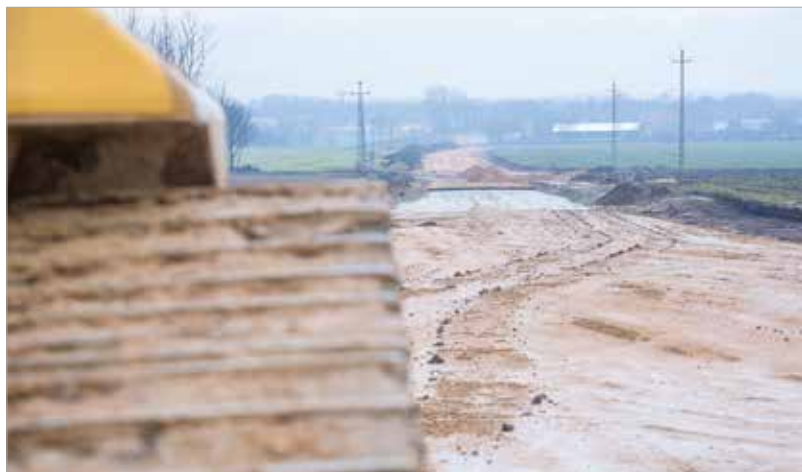
A déli összekötőút a belvárost is mentesíteni fogja a forgalom alól

A négy és fél milliárd forintos európai uniós támogatás segítségével új közúthálózati elemként megvalósul a 62. és a 63. számú főút városi szakaszainak – Seregélyesi út és Sárkeresztúri út – átkötése a Juharfa utca és a Köles utca közötti tervezett nyomvonalon, két vasúti keresztezés feletti közúti felüljáró létesítésével. Emellett – tervezetten kapcsolódó közúthálózati fejlesztésként – elkészül a Takarodó út és az Új Váralja sor bekötése a 62-es és a 63-as út közötti átkötőútba illetve a Köles utcába, az érintett gazdasági területek elérhetőségének javítása céljából.