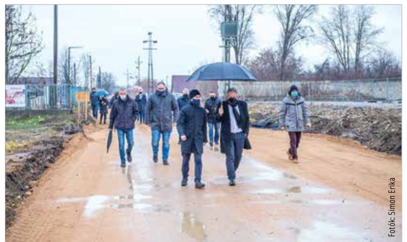
A kivitelezés várhatóan 2023 tavaszán készül el

„A közbeszerzés eredményes volt, és a rendelkezésre álló forrásból meg tudjuk valósítani a Móri út felújítását is, amelynek már zajlanak az előkészületei.” – mondta el Vargha Tamás országgyűlési képviselő. „A beruházás révén a munkahelyek, az egészségügyi és oktatási intézmények megközelítése is könnyebb lesz a városban belül.” – tette hozzá Törő Gábor országgyűlési képviselő.