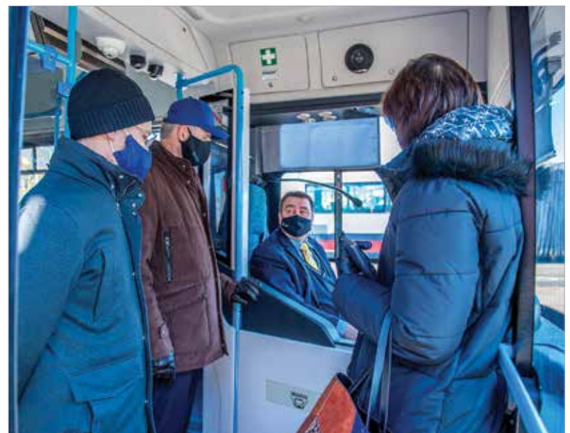
A buszvezetőnek jók a tapasztalatai az új járművel

Cser-Palkovics András a program indításakor kiemelte, hogy tárgyalásokat folytatnak a Volánbuszszal arról, hogy a közeljövőben minél több elektromos busz állhasson forgalomba: „Ez a busz az első fecske, amelyet reményeink szerint még sok követ!” A polgármester hozzátette: a szolgáltatóval már zajlik az egyeztetés arról, hogy indulnak a minisztériumi pályázaton annak érdekében, hogy az elektromos busz ne csak egy hónapon át járjon a városban. A Zöldbuszprogram fehérvári tesztüzemében egy olyan Ikarus