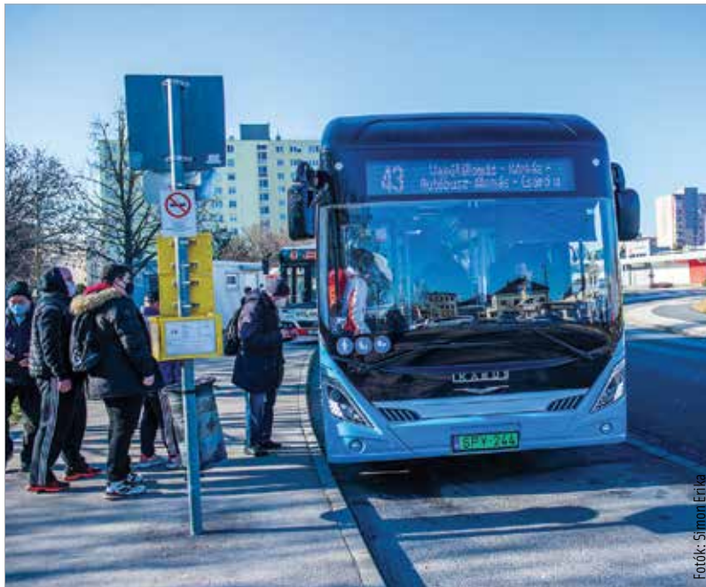
Szívesen próbálják ki a fehérváriak az új buszt

Mint azt az Innovációs és Technológiai Minisztérium államtitkára, Steiner Attila elmondta, a hazai szén-dioxid-kibocsátás ötödéért a közlekedés tehető felelőssé, ezért különösen fontos a környezetvédelmi reform ebben a szektorban is: „Ez egy hosszú felfutású program lesz: