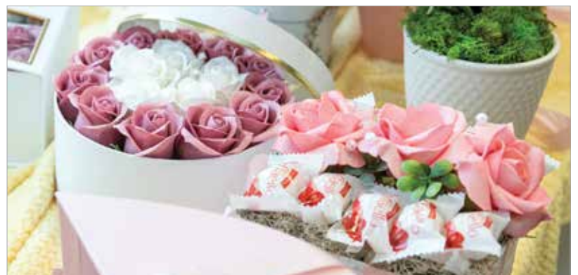
Egy doboz rózsák szép ajándék. Hát még, ha fürdéskor is kényeztethetjük vele magunkat!

illatos, de finom is a tartalom! Reméljük, adtunk néhány ötletet! Már csak egy jótanácsot teszünk hozzá: mindenki örül a meglepetésnek, a lényeg, hogy szívből jöjjön, és ne csupán Valentin-napon!