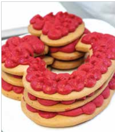
Készíthetünk egyszintes, de emeletes változatot is, bármilyen formában

És tegyük hozzá azonnal: nem csak e jeles alkalom adhat okot arra, hogy meglepjük párunkat! Ha éppen sütni támad kedvünk, és valami igazán kreatív elfoglaltságra vágyunk, ezt a kis mézestészta-alapú tortácskát nekünk találták ki! Nem gyors, és nem is diétára termett, de finom és látványos, ráadásul ajándékba is adható. És ami a legfontosabb: kisebb gyakorlattal rendelkező háziasszonyok is képesek összeállítani!