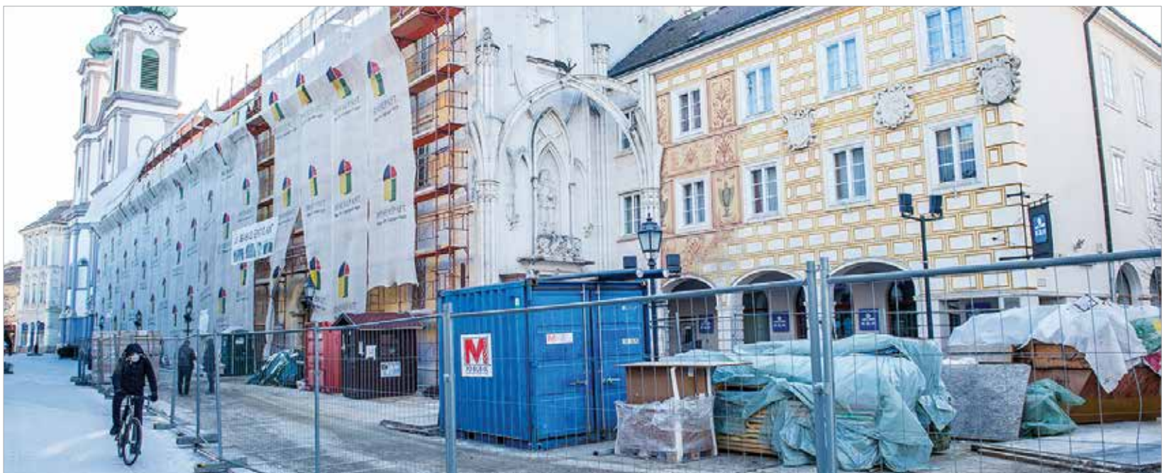
A felújítás a terveknek megfelelően halad. A munkálatok befejezésének céldátuma 2021. október 30.