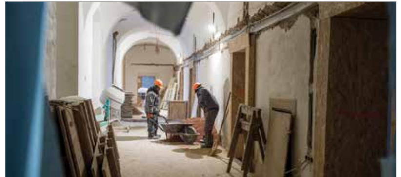
Az akadálymentesített, lifttel felszerelt épületben a tájékoztató, az információátadást digitális tárlatvezetői rendszer segíti majd, automatizált funkciókkal

Ha elkészül a rendház, 2022 tavaszán-nyarán meg is nyílnak az első kiállítások. Pokrovszki Krisztián, a Szent István Király Múzeum igazgatója elmondta: „Az első kiállítás a Királyok és szentek – az Árpádok kora címmel egy Árpád-házat bemutató tárlat lenne, ami az egész Árpád-kort felölelve bemutatja a magyarság akkori történetét. Ezt a Magyarországi Kutató Intézettel és a Nemzeti Múzeummal hármásban fogjuk megvalósítani.”