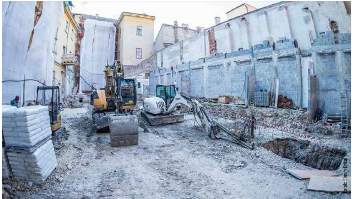
A rekonstrukció keretében beépítik a gazdasági udvart, létrehozva ezzel egy új előcsarnokot, ahol fogadják majd a látogatókat. A több mint nyolc méter belmagasságú térből a galériaszintre vezető lépcső indítja majd a múzeumi látogatást.

A bruttó 5,3 milliárd forint értékű rekonstrukció során korszerűsítik a védett történelmi értéknek számító épületet, melynek falrendszere változatlan marad. Magas szintű gépészeti és elektromos korszerűsítéssel lehetővé válik, hogy szabályozott légállapotú kiállítóterek jöjjenek létre. Cser-Palkovics András polgármester lapunknak elmondta: „Része az a nagy Árpád-ház-programnak, amelyben rengeteg dolog történik, de talán az egyik legjelentősebb a múzeumépületünk, a rendház épületének teljes megújítása. Olyan korszerű technológia lesz benne, amely lehetővé