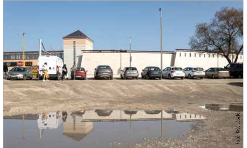
Az átalakítással legkorábban három év múlva végeznek, jelenleg a munkálatok előkészítése zajlik

a pláza tulajdonosa. Az Indotek Group a földszintre nagy rendezvényterületet képzelt el, valamint a mozi is új bejáratot kap. A tervek szerint a munkálatok végén több parkolóhely és jóval több szórakozási lehetőség várja majd a vásárlókat. Ezzel párhuzamosan beépítik a plázaival szemközti murvás parkolót. Ez lesz a városi piac jelenleginél lényegesen korszerűbb helye. A beruházó célja, hogy az Alba Plaza régiós szerepéhez méltó, modern és kényelmes kereskedelmi és szolgáltatóközponttá váljon.