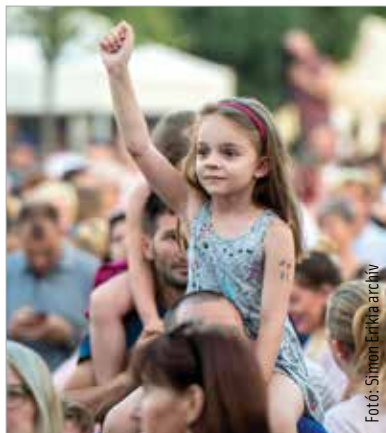
A koncertélmények még váratnak magukra, az előadók azonban már pályázhatnak a gázsijért

„Minden olyan utazási irodát működtető fehérvári vállalkozásnak, amely legalább a munkahelyek felét megőrizte, lehetőséget adunk pályázat benyújtására. Ennek keretében ötvezer forint támogatást fogunk nyújtani munkahelyenként, maximum kétmillió forint összegben. Ez hasonló támogatási forma, mint amit a vendéglátásban dolgozó vállalkozásoknak biztosítottunk.” – részletezte Cser-Palkovics András. A második elem az egész országban egyedülálló támogatásként jelenik meg. A város rendezvényei elmaradtak, a zenészek, előadóművészek most nem léphetnek fel. Számukra is írnak ki pályázatot: