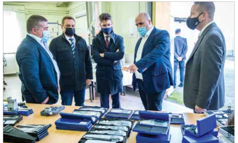
Az átvett mérőeszközök segítségével tudják majd ellenőrizni a széchenyis diákok a nagy pontosságot igénylő megmunkálásokat