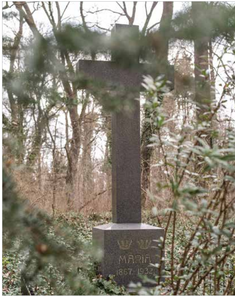
Mária Dorottya sírja ma is megtalálható a kastélykertben

Alcsúthoz visszatérve: József nádort már nem találta itt az 1848-as forradalom heve. Mintha a legmagyarabb Habsburgot szándékosan kímélte volna meg a sors: 1847. január 13-án, hetvenegy évesen