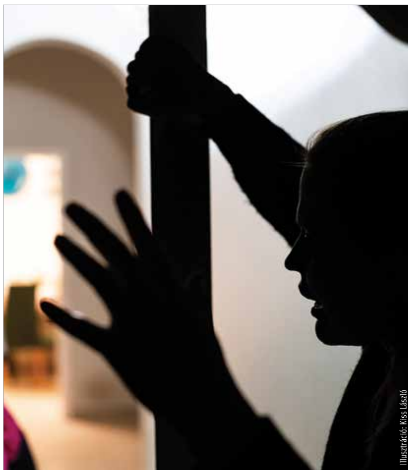
Illusztráció: Kiss László

De gyakoribb a második eset, az a változás, amit nem mi kezdemé-