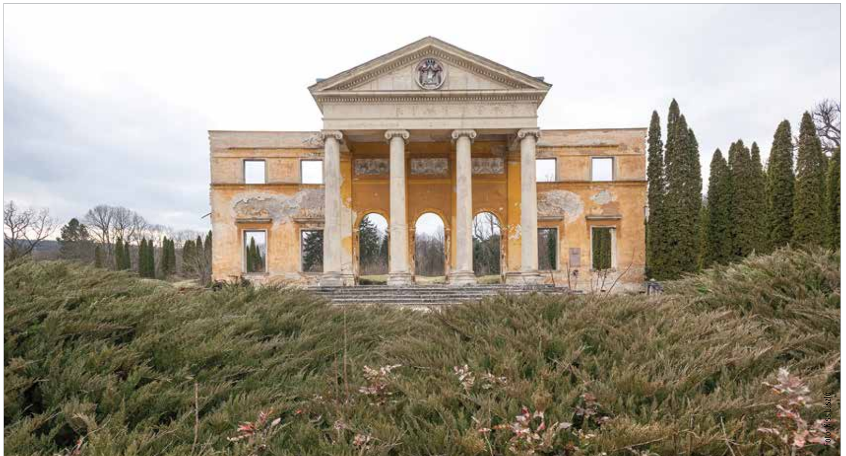
Már csak a megmaradt homlokzat hirdeti a Habsburg nádori család fénykorát

nagyrészt itt születtek. A hét gyermek közül Mária Dorottya, a későbbi címzetes francia királyné volt a második, aki kilenc nyelvet ismert. Festett, hangszeren játszott. Különösen a szentekről készített egyházi képei kaptak figyelmet. 1896 novemberében férjhez ment Philippe d'Orléans herceghez, aki VIII. Fülöp néven lett a trón várományosa – a harmadik francia köztársaságban. Nászútjukon bejárták a Földközi-tengert. Boldogságuk azonban a mézesheteknél tovább nem tartott. A férj visszatért korábbi könnyelmű kapcsolataihoz, amit Dorottya nem tolerált. A házastársak elhidegültek egymástól. Orléans hercege már egyedül járt a hosszú hajóutakra, Mária Dorottya inkább a régi családját látogatta. Legszívesebben Margit nevű testvérénél időzött, aki az „örökös főpostamester”, a regensburgi Thurn und Taxis Albert herceg feleségéeként élt harmóniában. 1906-ban egyszer még tettek egy erőtlen kísérletet házasságuk megmentésére, de Mária Dorottya határozottan elutasította az összeköltözés lehetőségét. Franciaország hiába várt „királyi” utódokra. 1914-ben a pápa gyermektelen házasságukat érvénytelenítette. Ezután Mária Dorottya végleg visszaköltözött Magyarországra, boldog gyermekkorának színhelyére, az alcsúti kastélyba. Itt érte a halál 1932-ben. A kápolna előtti sírkövén a Mária felirat felett két korona jelzi, hogy itt nyugszik a Habsburg királyi család tagja, valamint Franciaország boldogtalan címzetes királynéja.