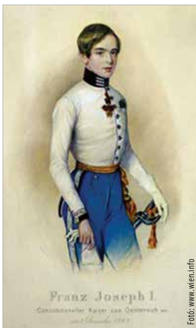
I. Ferenc József, az ifjú császár

Amikor az alcsúti hóvirágmezőn sétálunk, szenteljünk egy gondolatot Erzsébet Franciska emlékének, aki majdnem császárné lett Ferenc József oldalán!