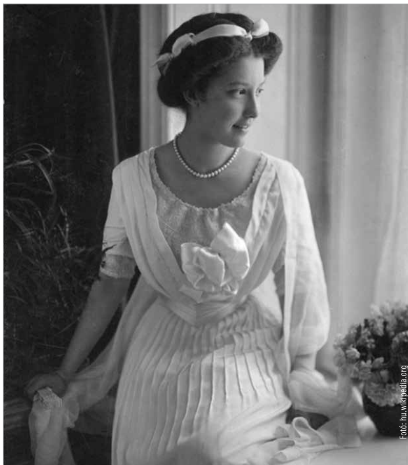
Erzsébet Franciska főhercegnő

A vele egykorú, ifjú Ferenc József császár éppen feleséget keresett magának. Szétnézett a számításba vehető, legszebb hölgyek között, és reménytelenül szerelmes lett a porosz király Anna nevű unokahúgába. De az erős, férfias poroszoknak nem tetszett a természetére nézve meglehetősen „karcsú” ifjú, akinek a fehér kabátja felett egy ábrándosnak tetsző arc mutatkozott, és Krúdy szerint a rossz nyelvű utókor „néha vitázni is mert származásán, az atyaság kérdése felett”. Európa legelső gavallérjának mondták őt, „miután II. Vilmos a hibás karja miatt nem mehetett férfiideálszámba, Angliában pedig a nagy öregasszony uralkodott”. Krúdy Gyula fullánkos szavait kérem kölcsön, hogy visszaadjam, amit a köznép császára külsejéről gondolt: „A gesztenyeszínű fürtök még abból a korból göndörödtek, amikor a nagyralátó és elszánt édesanya, Zsófia simogatta ezeket a fürtöket a lainzi kastélyban. Vöröskés bajusza ritkásabb, mint egy csapatvezérhez illenek, és tőszomszédságában feketére növekedett az a szakáll, amelyet Kaiser-Bartnak nevezett ötvenmillió alattvaló. A testhez álló formaruhának a császár nagy kedvelője volt, mert ezeknek nadrágszáraiban pontosan megmutatkoznak a lovaglástól izmos combok és a nyereg mellett növekedett térdek. A szűk kabátok, bár a későbbi korban nagyon hátráltatják a jó emész-