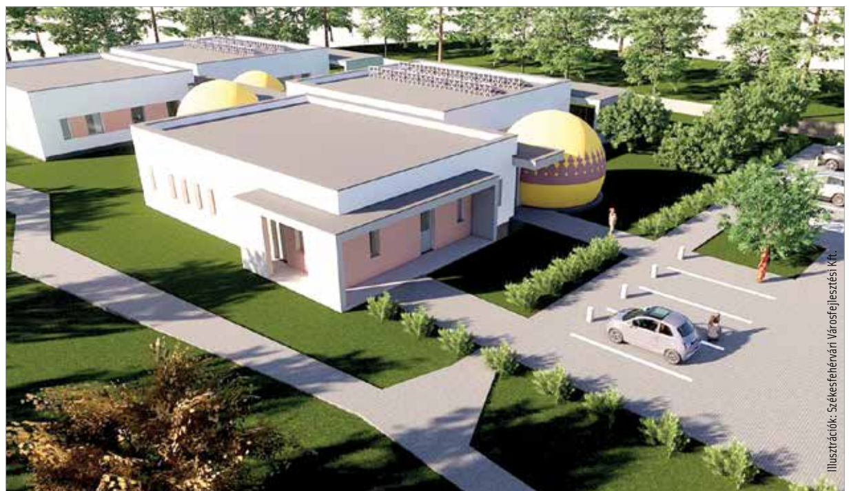
Igy fest majd Maroshegy új bölcsődéje a látványterv szerint

Az új bölcsőde engedélyezési tervei elkészültek, jelenleg a kiviteli tervek kidolgozása zajlik. Az építésre vonatkozó közbeszerzési eljárást várhatóan még idén tavasszal kiírják. Az épület a tervek szerint 2022 végéig megépül, és mindenben megfelel majd a legkorszerűbb szakmai, szolgáltatási, építészeti és energiahatékonysági kívánalmaknak.