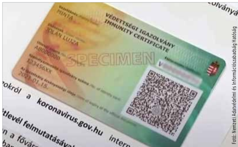
A védettségi igazolvány elektronikus igényléséhez ügyfélkapu-regisztráció szükséges

Ha valaki korábban igazoltan átesett a koronavírus-fertőzésen, akkor a fertőzésből való felgyógyulás napja jelenti a védettség kezdetét. A felgyógyulás napja az, az Elektronikus Egészségügyi Szolgáltatási Térben (EESZT) nyilvántartott dátum, amikor negatív PCR-tesztje vagy antigén-gyorstesztje lett, miután korábban pozitív tesztje vagy tesztjei voltak. Abban az esetben, ha valakinek csak a fertőzést igazoló pozitív tesztje van, de több teszt nem készült – mert például tünetmentes vagy enyhe tünetes volt, és otthoni karanténban maradt – akkor a teszt utáni tizedik nap a felgyógyulás hivatalos napja. A védettségi igazolvány érvényessége az igazolt felgyógyulást követő hat hónap. A kártya ebben az esetben is ingyenes, az állam hivatalból postázza, annak kiállítását külön nem kell kérni.