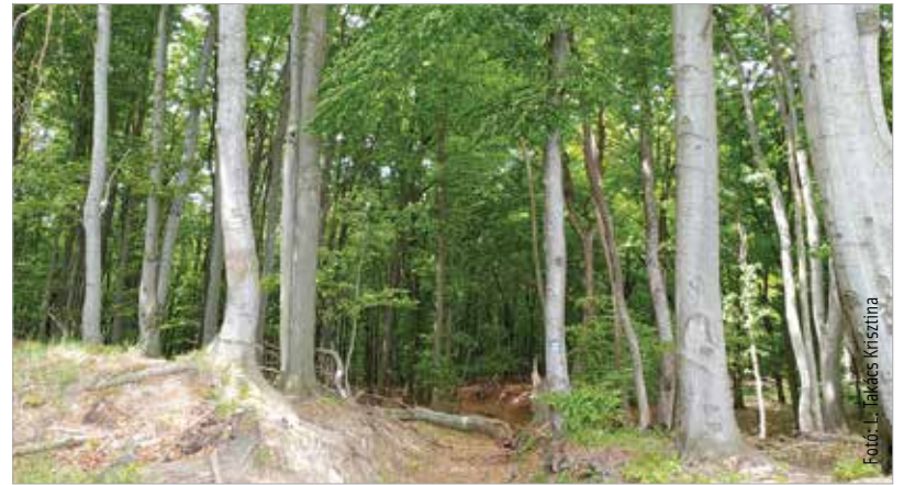
A tavaszköszöntő túra tizenöt, illetve huszonöt kilométeres lehet, az erőnlétünkön és a bátorságunkon múlik, melyik távot választjuk!

elektronikus levélben küldik az itinert, a GPX-fájlt, a térképet és az igazolólapot. A teljesítést úgy igazolhatják a kirándulók, hogy az érintési pontokon lévő kódokat feljegyzik az igazolólapra, és megküldik azt e-mailen a gyongyviragtura@gmail.com címre. Az igazolás után postán kapják meg a teljesítésért az oklevelet és a hagyományos ajándékkitűzöt. A túrával kapcsolatban a 20 3255 210-es telefonszámon kaphatunk további információt a túráról.