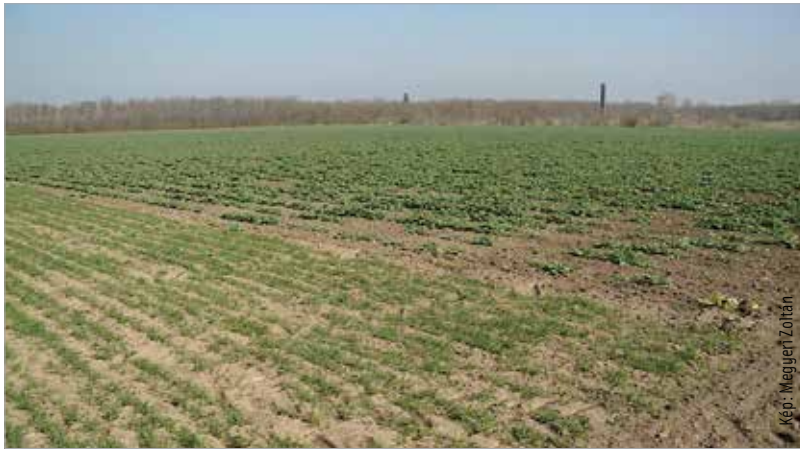
Rövidesen egy gazdája lehet a megosztott földeknek

Az osztatlan közös tulajdon megszüntetését célzó törvény elő kívánja segíteni a versenyképes méretű birtokok kialakítását. Ennek érdekében a megosztással létrejövő új ingatlanoknak továbbra is alkalmasnak kell lenniük mező- és erdőgazdasági művelésre.