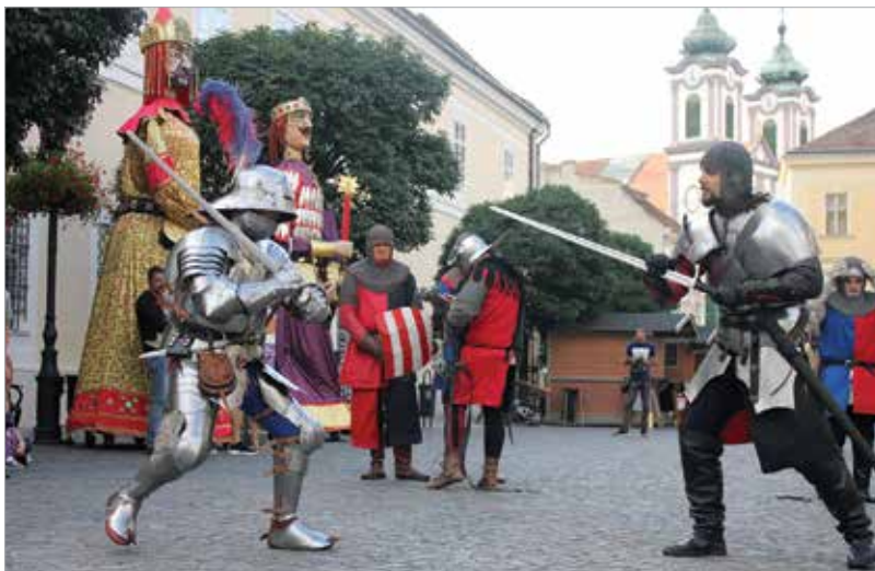
A Koronázási Ünnepi Játékok forgatagát is évről évre színesítik