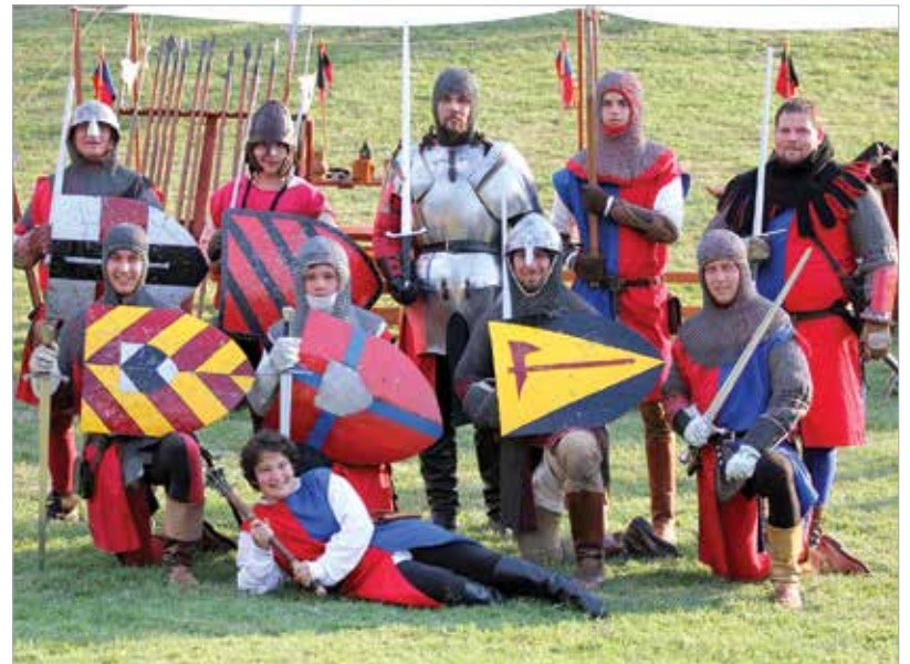
A Magyar Királyi Kardforgatók Rendje tizenöt év után önálló fehérvári egyesület lett

Sajnos nem edzhetünk együtt csapatunk tagjaival, de már alig várjuk a korlátozások feloldását, hogy beindulhasson a szervezeti élet! Addig is Skype-on tartjuk a kapcsolatot rendszeres időközönként.