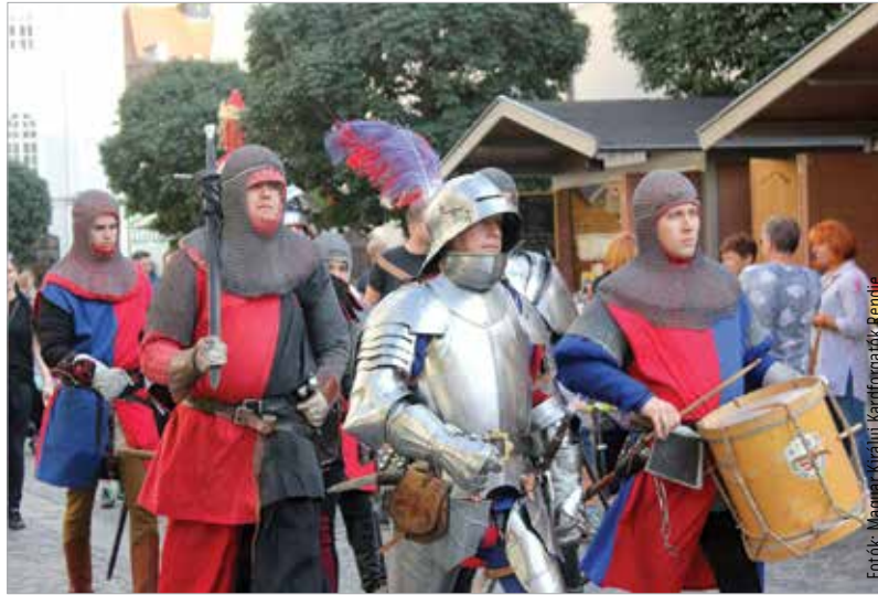
Több korszakot is megidéznek

Mióta működik Székesfehérváron a Magyar Királyi Kardforgatók Rendje? Csapatunk február tizenhetedikén töltötte be fennállásának tizenötödik esztendejét. A Magyar Királyi Kardforgatók Rendje néhány