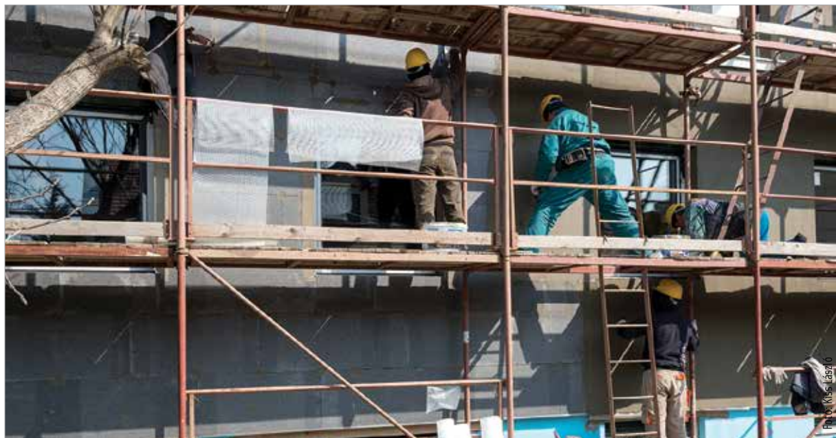
Nemcsak az építőanyag, de a szakmunka ára is egyre magasabb

„Nagyon megdrágította a családi házas építkezéseket az a rendelet, amelynek értelmében csak a közel nulla energiaigényű épületekre kaphatunk hatósági bizonyítványt, amit a köznyelv használatba vételi engedélynek ismer. Ezenfelül még az épület energiaigényének huszonöt százalékát megújuló energiaforrásból kell fedezni. Ezt ugyan most