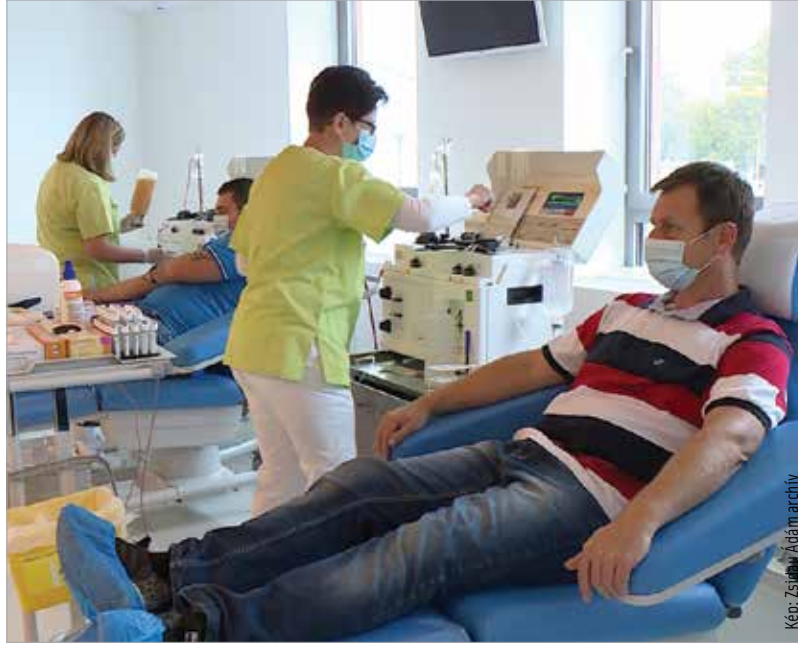
A véradásra regisztrálni lehet az OVSZ honlapján

Országos szinten napi 1200-1400 véradásra van szükség ahhoz, hogy fenntartsák a készleteket, és biztosítsák a folyamatos ellátást. Az OVSZ még a húsvéti hosszú hétvége előtt kiadott közleményében arra hívta fel a véradók figyelmét, hogy az ünnepek után is nagy szükség lesz a segítségükre, így aki csak teheti és egészségesnek érzi magát, menjen el vért adni, és életmentő adománnyal segítse a gyógyító munkát. Kiemelten kéri azokat, akik már legalább három hete kilábaltak a koronavírus-fertőzésből, hogy minél többen