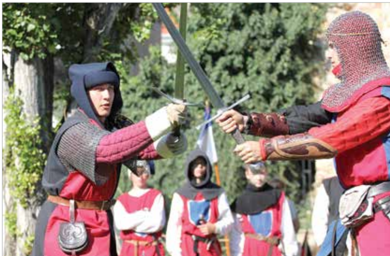
Az ország számos pontján lépnek a közönség elé

Székesfehérváron pedig elképzelhetetlen az augusztus a kardforgatók nélkül! Fehérváron a Koronázási Ünnepi Játékok alapcsapata vagyunk, de már előtte, a történelmi kavalkádoknak is részesei voltunk. Ha úgy hozza az élet, színpadon is otthonosan mozgunk: a Koronázási Ünnepi Játékok Szent László koronázását felelevenítő előadásában is részt vettünk. A Pákozdi Katonai Emlékparkban is jól cseng a nevünk. Az is érdekes volt, amikor Sopron-Ágfalván képviseltük városunkat, és annyira nyugaton állt a táborunk, hogy csak kelet felé láthattuk Magyarországot, mert a többi irányban már mindenhol Ausztriára tekinthettünk. Számos alkalommal bújunk más korok mundurjaiba is, hiszen a pákozdi, a nagyszabenyi csatában, a Pápai Történelmi Napokon reformkori, Győrben kuruc kori, számtalan eseményen pedig végvári vitézek voltunk. A Magyar Honvédség ünnepeinek is gyakori vendégei vagyunk.