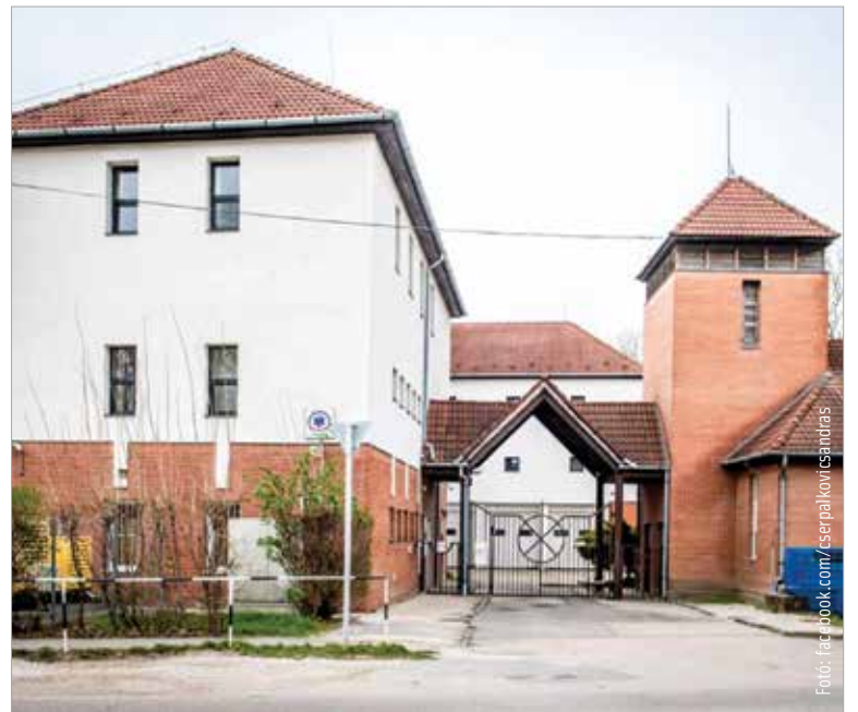
A mentősök naponta több mint kétszázhusz mentési feladatot teljesítenek

„Egyeztetve a mentőseinkkel – elfogadva a kérésüket – hatmillió forintos támogatásról rendelkeztem, amit az Országos Mentőszolgálat Alapítványnak, valamint a helyi RESQ Alapítványnak biztosít a város. Ez egy, a betegek szállítás közbeni biztonságát, és így túlélési esélyét növelő mellkaskompressziós eszköz megvásárlását teszi lehetővé, illetve olyan bútorok beszerzéséhez is hozzájárulunk, ami az állandó készenlétben lévő mentősök szolgálatteljesítését segíti az állomáson.” – fogalmazott a polgármester.