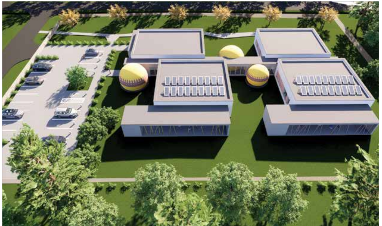
Az épület szerkezete a főtengelyen alapul, ehhez kapcsolódnak a gondozási egységek és a konyhablokk