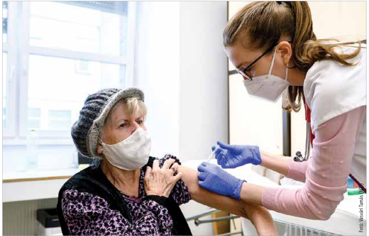
A Pfizer-BioNTech és a Szputnyik V koronavírus elleni vakcinával oltottak hétfvégén a Szent György Kórház oltópontján. Az oltási folyamat az ünnepek alatt sem állt le, ennek köszönhetően a beoltottak száma már meghaladta a két és fél milliót.

Szerdai lapzártánkig 1933 újabb magyar állampolgárnál mutatták ki a koronavírus-fertőzést, közülük 89-en Fejér megyeiek. Elhunyt 311,