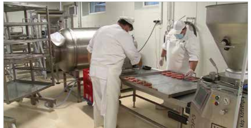
A soponyai üzemben világszínvonalú termékek készülnek

Árainkat nem a takarmányozott állatokból készült termékek áraihoz állítjuk be – soha nem is tettük ezt. A termékeink ára évek óta jelentéktelen mértékben változhatott csak, pl. az afrikai sertéspestis miatt lecsökkent vaddisznó-áralap miatt. Ezen túl nem használjuk ki áremeléssel a konkurens termékek áremelkedését. Így nem élünk vissza a fogyasztók bizalmával és pénztárcájával.