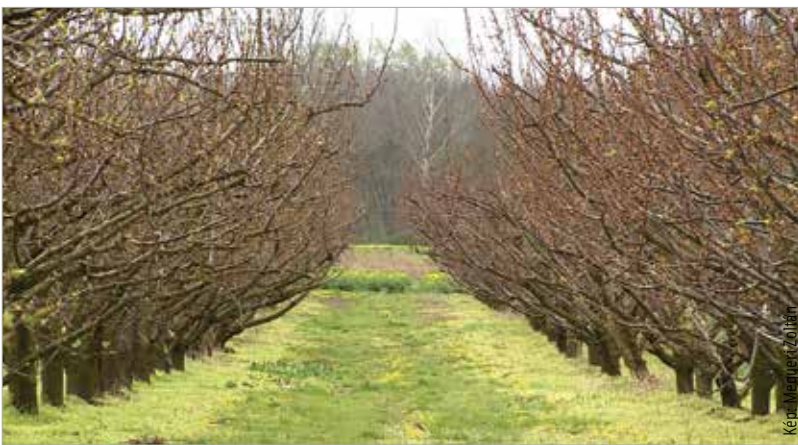
Elkeserítő a gyümölcsösök helyzete

zetben vannak, tartalékaik végén járnak. Emlékeztetett rá, hogy az idei sorban a harmadik év, amit tavaszi fagyok sújtanak, ez pedig komoly bevételkiesést eredményez. Az elmúlt évben a kárenyhítési alaptól a márciusi fagyok nyomán több mint huszonhétezer hektárnyi ültetvény tulajdonosa kapott valamilyen mértékű juttatást. Ezúttal is ebből a forrásból – a tavalyi is érvényes szabályok alapján – kompenzálják a gazdákat, akik a mostani, egységes kérelembenyújtási időszakban – május közepéig – önkéntesen csatlakozhatnak az alaphoz.