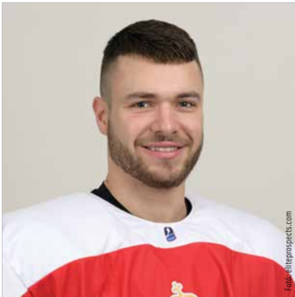
Másodszorra már nem mondott nemet

Tudom, hogy még keményebben kell, hogy készüljek a szezonra, mint az eddigiekben, hiszen míg az Extraliga technikásabb hokira alapul, az oszt-rák bajnokságban a fizikális játék kerül előtérbe. De úgy látom, ez a stílus fekszik nekem is! Már a tavalyi évben is beszélgettünk Szélig Viktorral, de akkor végül úgy döntöttem, maradok a MAC színeiben. Sok játékidőt kaptam, az első