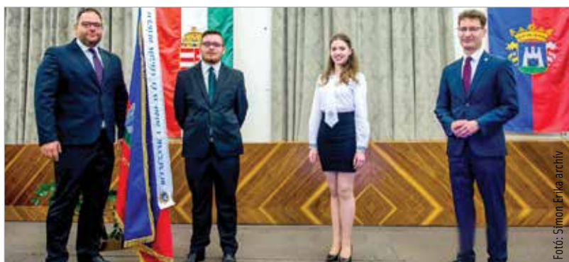
A városi ballagást május elsején, szombaton kilenckor élőben közvetíti a Fehérvár Televízió

A végzős diákok városi osztálykép- és tablógyűjteményét is a városi honlapon teszik majd közzé, de a városi Facebook-oldalon is láthatóak lesznek a ballagó osztályok által beküldött képek. Minden intézményhez levélben fordult Cser-Palkovics András polgármester, hogy küldjék be az elkészült fotókat, hogy minél teljesebb legyen az idej online tablógyűjtemény is. A legfontosabb cél, hogy a megváltozott helyzetben is méltó módon tegye emlékeztessé a minden diák számára mérföldkövet jelentő eseményt Székesfehérvár.