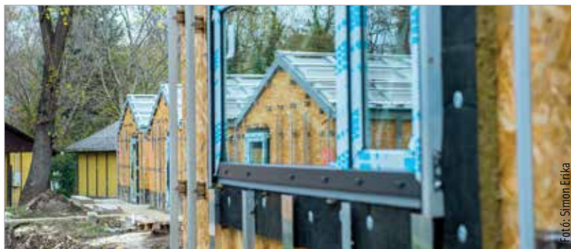
A tábor a felújítást követően egy téliestített központi épülettel is rendelkezik majd, melyben több mint negyven diáknak a téli időszakban is lehet tábort szervezni

„Nagyon szépen halad az építkezés, az eszközbeszerzések is folyamatban vannak, így bízom benne, hogy talán a nyári időszakban fogadhat már diákokat a tábor!” – mondta el lapunknak Cser-Palkovics András polgármester.