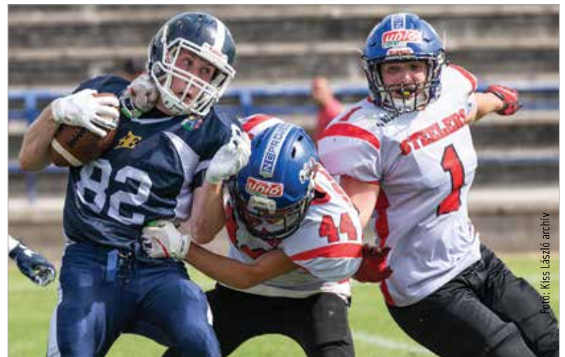
A nemzetközi porondon az eddigi legrangosabb megmérettetés vár a fehérváriakra

sorozatba. A Koronázók nem akárkivel kezdik meg a küzdelmet, hiszen a svájci bajnok Calanda Broncos csapatához látogatnak május 29-én. Mint azt közösségi oldalukon írják: „Természetesen tudjuk, hogy nagyon nagynevű mezőnybe kerülünk, hiszen Európa legjobb csapatai társaságában kell helytállnunk, és nem feltétlenül mi számítunk a párharc esélyeseinek, de minden igyekezetünkkel azon leszünk, hogy megnehezítsük a CEFL legutóbbi döntősenek dolgát! Köszönjük a lehetőséget a CEFL-nek, igyekszünk megszolgálni, és újoncként is jó teljesítményt letenni a rácsmezőre!”