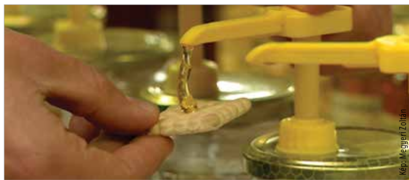
Reméljük, továbbra is csurran-cseppen!

nos megismétlődött a tavalyi helyzet: háromszor is fagyot kaptak az akácerdők, így a mélyebben fekvő területeken a virágok többsége elfagytott, csak a dombokon-hegyeken honos fákra hagyatkozhatunk. Idén is borzasztó évre számítunk. Ez annál is inkább megviseli a méhésztársadalmat, mert arányában az akácmez a harmadát teszi ki egy méhész egész évi méztermésének. Emellett fontos a repce és a napraforgó is, de ahogy a repcetáblákat nézzük, idén ezzel is problémák lehetnek, hiszen még alig kezdődött meg a virágzás. Ez az árakra is hatással lesz. Az akácmez ára valószínűleg jelentősen, akár másfél-kétszeresére is emelkedhet. A helyzet megviseli a méhcsaládokat is: a márciusi hideg időszak után egy teljes generáció tűnt el. Ebben a helyzetben fogunk nekiindulni az akácokban, illetve a repceföldeken a méz begyűjtésének.”