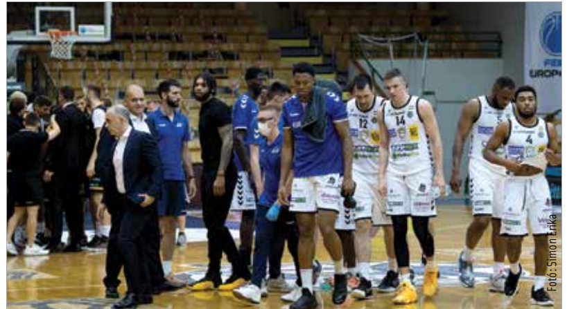
Nincs ok az öröme

A Debrecen előbb szépített, majd hétfőn – nem túl profi játékvezetés mellett – egyenlített. Jöhetett a mindent eldöntő ötödik összecsapás szerdán, Debrecenben! Az Alba küzdött, az utolsó pillanatig ott loholt a házigazda nyakán, 88-85-nél Gillon triplakísérleténél ketten is mintha szabálytalankodtak volna, a közelben álló Benczúr játékvezető azonban nem látott olyat, ami miatt fújni kellett volna. Így a büntető és az esetleges hosszabbítás helyett jöhetett egy nagyon hosszú hazaut Debrecenből. A DEAC a Szolnokkal játszik majd az elődöntőben.