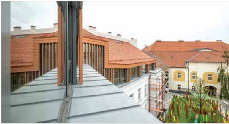
Közel két esztendő telt el az intézmény korszerűsítési terveinek bejelentése óta