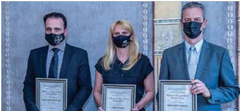
Idén immár hetedik alkalommal adták át a Fehérvári Fogyasztókért szakmai díjat. Gyártás kategóriában a Tortapalota, szolgáltatás kategóriában az Öreghegyi Patika, kereskedelem kategóriában pedig a Pinke Szívárvány Bt. érdemelte ki az elismerést. F. Sz.