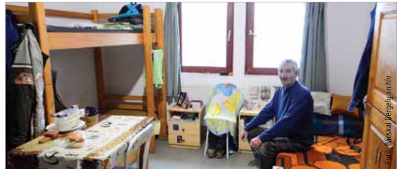
A Kríziskezelő Központban otthonos körülményeket biztosítanak az ellátottaknak

nak. Ugyancsak kap pénzt a központ lakókonténerek és egy szaniterkonténer bérleti díjára, tisztítására, fertőtlenítésére, bontására és elszállítására. A konténereket tavaly decemberben, a város finanszírozásával kapta meg az intézmény, hogy biztosítani tudja az utcáról újonnan bekerülők elkülönítését a járványidőszakban. Most ezen költségek fedezetére kap az intézmény egymillió forintot. Emellett felújítják a Sörház téri éjjeli menedékhelyt és átmeneti szállót is. Zsabka Attila hozzátette: az utóbbi időben az egyik legfontosabb feladatuk volt, hogy a járvány idején is folyamatos legyen a szakmai munka. A koronavírus elleni védőoltás beadatására is ösztönözték ellátottjait: a hajléktalanok közül száznegyvennyegen kapták meg a vakcinát.