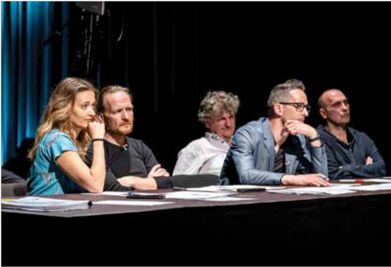
Munkában a zsűri

hogyan megtalálják a musical szereplőit: „Nagyon élvezetes a válogató, mert az egy nagyon nehéz műfaj, amikor valakinek tíz-tizenöt perc alatt kell megmutatnia magát. Ennyi idő alatt persze nem derülhet ki, hogy valaki tehetséges vagy sem, ezért egy ilyen rövid, stresszes meghallgatás nem feltétlenül alkalmas arra, hogy az ember mélyen megmértesse, de hát