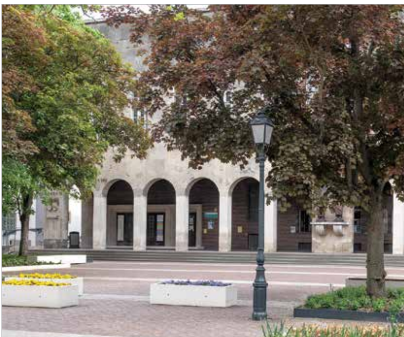
A megújult Bartók Béla téren számos színházi előadást láthatunk majd a nyáron

Moziba menni jelenleg az érvényben lévő járványügyi szabályok szerint lehet. Így a Barátság mozit kizárólag a koronavírus ellen védett személy, valamint a felügyelete alatt lévő, tizennyolcadik életévét be nem töltött személy látogathatja. A belépéskor itt is szükség lesz a védettségi igazolványra és személyazonosító igazolványra.