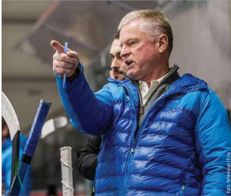
A Hydro Fehérvár AV19 új vezetőedzője a héten háromrészes videósorozatban mutatkozik be a klub Youtube-csatornáján

Az egykori kapus első évében az NHL legfiatalabb vezetőedzője volt. Az 1993/1994-es szezonban az év edzőjének járó Jack Adams-díjra is jelölték – nem is csoda, hiszen a San Jose ötvennyolc ponttal többet szerzett Constantine irányítása alatt, mint az előző évadban. Az NHL-es éveket követően dolgozott a WHL-ben, ahol 2004-ben az év edzőjének választották, majd az AHL-ben is. 2010-ben az Angers vezetőedzője lett, majd a fehérvári szurkolók előtt is jól ismert Ambri Piotta kispadjára került. A svájci kiterőt követően visszatért a WHL-be, majd az Ázsia-ligában töltött három év után a tavalyi szezonban a lengyel Unia Oświęcimet irányította.