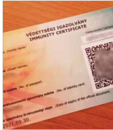
A védettségi igazolvány azonban továbbra is fontos, hiszen az újranyitott intézményekbe egyelőre ez jelenti a belépőt!

A Magyar Hírlap úgy tudja, hogy az applikáció a postai úton küldött kártyákhoz képest több információt mutat majd a regisztrálást követően. Szerepelni fog rajta, hogy az alkalmazás használója mikor kapta meg a vakcinát, valamint az első és a második oltás időpontja is látható lesz. Ez pedig fontos lehet bizonyos országoknál, ahol a beutazás feltétele a teljes védettség, amely a legtöbb oltóanyag esetében két dózis után számítható. A második oltás után az applikációban frissülni fognak az adatok. A Magyar Hírlap információi szerint az alkalmazás emellett mutatni fogja a kapott vakcina típusát is.