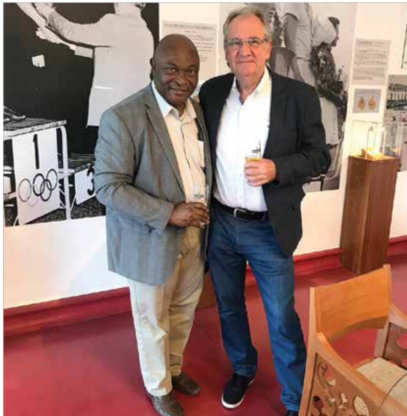
A szakmai találkozók ma is megerősítést jelentenek

A főhajtás és a köszönet a sok gyógyulttól természetes, ugyanakkor nagyon fontos, hogy azt az utat, amely a gyógyuláshoz vezetett, az új eredményekkel együtt megismerjék mások is. Ezt viszont publikálni kell, amiben szintén élen jár. Mennyire fontos ez az orvostársadalom számára itthon és külföldön?