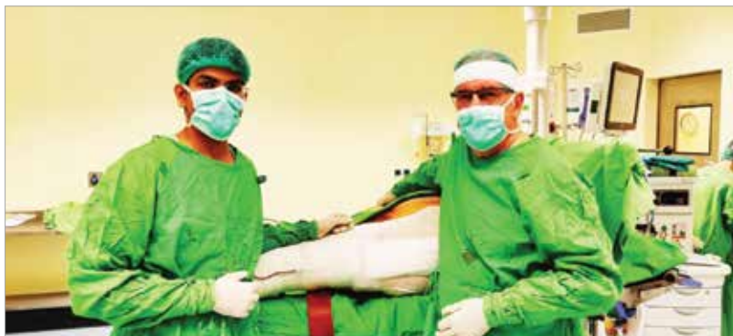
Bucsi professzor a műtőben is otthon van

Nagyon érdekes változások mentek végbe a mozgásszervi sebészetben. Székesfehérvár volt szinte az egyedüli kórház, mely létrehozta a Mozgásszervi Sebészeti Centrumot is. Már említettem, hogy az ortopédia és a traumatológia nagyon közel áll