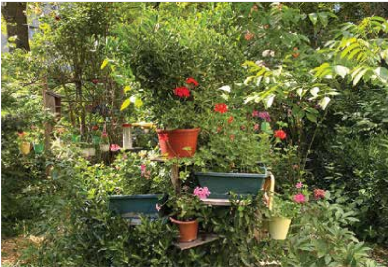
Még mindig a Köfémén, ezúttal a 42. szám előtt: buja kert, eklektikus cserepes elrendezés és rengeteg zöld mindenütt!