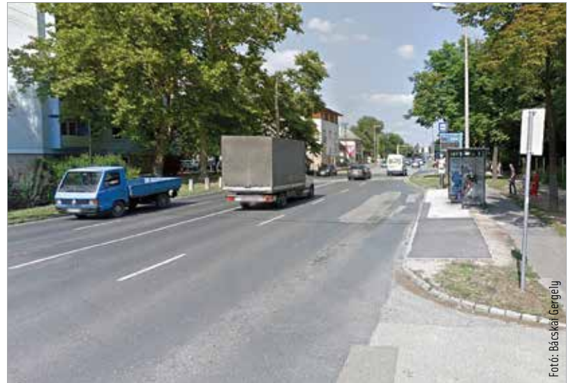
A gépjárművezetőknek a Hadiárva utcai, Bem utcai, Zrínyi utcai úti céljaik megközelítése során érdemesebb a Lövelde út–Huszár utca útvonalat vagy az Erzsébet utcát igénybe venni!

ni. A Zrínyi utcai csomópontban előreláthatólag július 21-ig szennyvízvezeték-építési munkálatok miatt kell korlátozásokra számítani. Amíg a szakemberek a helyszínen dolgoznak, nem lehet a Budai útról a Zrínyi utcába, valamint a Zrínyi utcáról a Budai útra balra kikanyarodni. A munkavégzés az előkészítő közműrekonstrukciókkal és közmű-kiváltásokkal együtt előreláthatólag szeptember 30-ig tart.