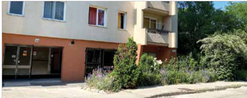
A Budai úton ilyen csodás lila mezőre bukkantunk

Városszerte számtalan társasház tövében pompáznak színes virágoskertek: az ott lakók gondos kezeinek hála idén is gyönyörű látvány fogad a lakótelepeken sétálva is. Körülnéztünk a városban a Kőfém-lakóteleptől a Budai úton és a Rákóczi úton át a Szedreskertig, meg is mutatjuk, milyen szépen gondozott társasházi kerteket találtunk mindenütt!