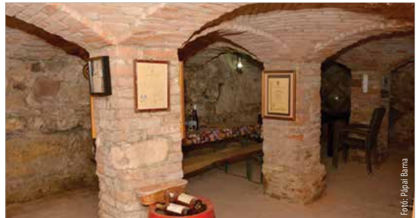
Az előadást követően végigsétáltunk beszélgetőpartneremmel a Rác utcán. A 19-es ház jelenleg is lakott, így belülről is megcsodálhattuk az épületet. A tulajdonos gondos gazdája a háznak, minden szeglete magán viseli a törődést.