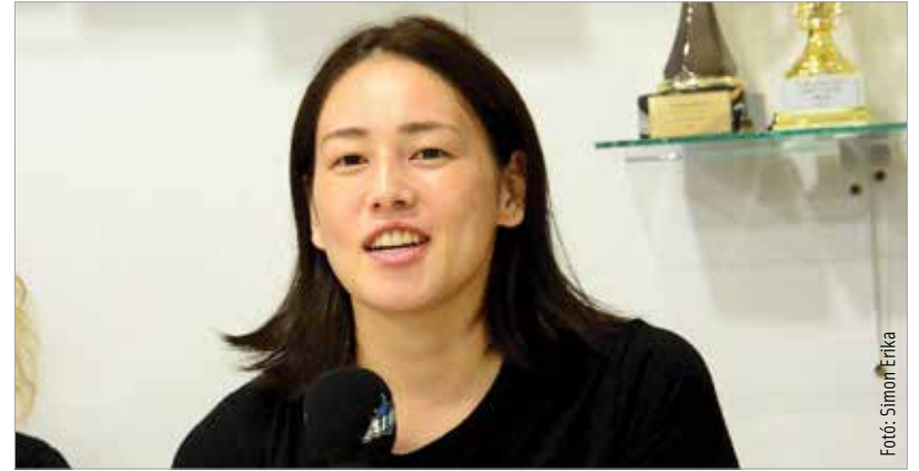
A japán válogatott irányító először játszik külföldi csapatban

A csapat vezetőedzője, Boris Dvoršek elmondta, hogy az elmúlt egy hónap során remekül alakult a felkészülés, jó úton jár a csapat: „Rengeteg munkát végeztünk az edzések folyamán, és máris meglátszik az eredmény, mert az edzőmeccsek közül hármát megnyertünk, és csak egyszer kaptunk ki. Lépésről lépésre haladunk. Folyamatosan zajlanak az erőnléti edzések, és persze labdával is sokat edzünk. Készen leszünk a bajnokság kezdetére!”