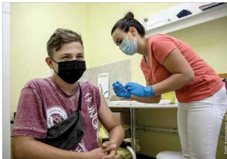
Minél nagyobb számban lesz átoltott a fiatal generáció, annál nagyobb esély van a következő tanévben a jelenléti oktatásra

Magyarország az elsők között ért a tizenkét év feletti oltásához – írja a koronavírus.gov.hu. A szülők június óta tudnak regisztrálni. A tizenkét és tizenhét év közöttiek korosztályában eddig közel kétszázezren jelentkeztek oltásra, és százhatvankétezen már fel is vették azt, ami a regisztráltak több mint nyolcvan százalékát jelenti. Az internetes regisztráció és időpontfoglalás továbbra is nyitott, ez a legegyszerűbb módja a gyermek beoltásának. Emellett augusztus 30-án és 31-én, valamint szeptember 2-án és 3-án az iskolákban is lesz oltási akció – írja az internetes portál. A szülők az iskolától kapnak tájékoztatást, és augusztus huszonötödikéig az iskolának is kell visszajeleznüik, hogy kérik vagy nem kérik gyermeküknek az oltást. Az iskolásokat Pfizer-vakcinával oltják majd be az iskolaorvosok és a háziorvosok bevonásával. A cél, hogy az iskolák továbbra is zavartalanul, jelenléti oktatásban