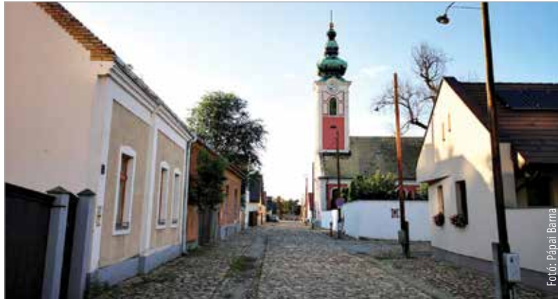
Egy ezeréves, történelmi városrész esett áldozatul a kommunista falanszterépítés lázalmának, melynek jelszava: „A múltat végképp eltörölni!” A Rác utcai épületegyüttes maradt egyedüli hírnemlőnk.

Ezért – a körülményekhez képest – egy nagyon bölcs gondolat született: megtartanak egy