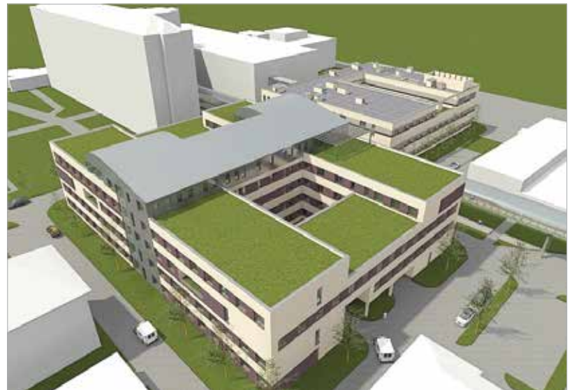
A tervezett új belgyógyászati tömb látványterve

hogy folyamatosan emelje a szolgáltatás színvonalát, növelve ezzel a felhasználói elégedettséget. Ehhez nyújt segítséget ez a felmérés is. Ennek érdekében kérjük, szíveskedjen együttműködni a közvélemény-kutatást végző Bellresearch Kft. munkatársaival, akik a SZÉPHŐ Zrt. által kiállított megbízólevéllel és kérésbiztosítási igazolvánnyal igazolják majd magukat. A kérésbiztosok pénzt semmilyen formában nem kérhetnek és fogadhatnak el Önöktől. Segítő együttműködésüket előre is köszönjük! Üdvözlettel: SZÉPHŐ Zrt.