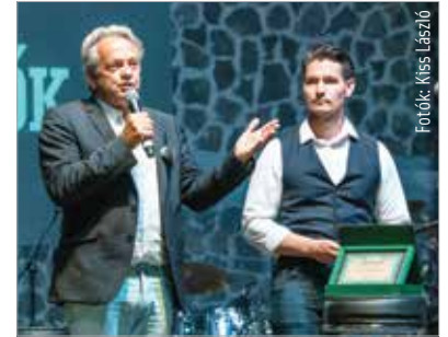
A rendezvényen Vargha Tamás országgyűlési képviselő az Értékmentő Egyesület emlékplakettjét vehette át. Az államtitkárnak fontos szerepe volt abban, hogy kormányzati támogatásból színpad jöhetett létre Gorsiumban.