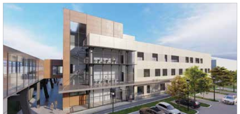
Az új épület háromszintes, hatezer négyzetméteres lesz