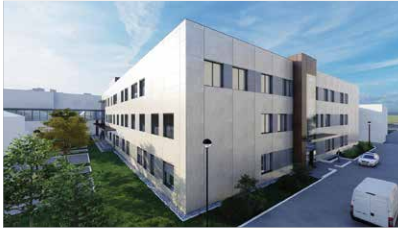
Új kórházi tömb épül, melynek köszönhetően száztizenkét ágygal bővül a kórház onkológiai, pulmonológiai és infektológiai ellátása

A Fehérvár Televízió Híradójában a képviselő elmondta: „Folytatjuk az építkezést, amit 2010 után elkezdtünk. Ha 2010 előttre visszatekintünk, akkor láthatjuk, hogy az akkori szocialista kormány Gyurcsány Ferenc vezetésével két ízben is meghiúsította a kórház fejlesztését és bővítését. Ezt követően az Orbán Viktor vezette kormány döntött úgy 2010-ben, hogy folytatjuk a kórház fejlesztését. Megépült egy tömb, mely otthont ad az intenzív osztálynak és a központi műtőnek, most pedig a másik új épület kivitelezése következik.”