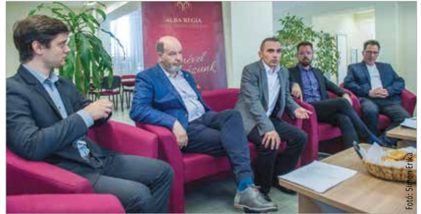
A hosszú kényszerszünet után rövidesen megkezdődhet a komolyzenei évad

A koncertsorozat szeptember 13-án kezdődik a Farkas Ferenc-bérlet hangversenyével a Vörösmarty Színházban. Szeptemberben a Somorjai-bérlet első koncertjét is megrendezik, de nem maradnak zene nélkül a Partitúra bérlet fiataljai sem: az ifjúsági korosztály hangversenyei októberben kezdődnek, és ebben az esztendőben már a Filharmónia bérlet hangversenyeivel is számolhatnak a klasszikus zene rajongói.