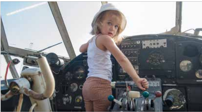
Nemcsak a nagyfiúk, de a kislányok is érdeklődnek a vasmadarak iránt