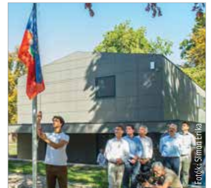
A megnyitót az ünnepélyes kulcsátadással zárult, a zászlófelvonás után pedig a diáktanács tagjai birtokba vehették a tábort

mondta el lapunknak Cser-Palkovics András polgármester. Vargha Tamás a megnyitón saját fiatalkori tábortábori élményeit is felidézte, azt az időszakot, amikor még egészen másfajta táborok voltak a kisházak. Bár a tábortábori élmény ugyanolyan jó volt akkor is, az országgyűlési képviselő szerint a megszépült környezet, a komfort is fontos: „Bízom benne, hogy a fehérvári és a környékbeli gyerekek otthona lesz majd itt nyáron, hiszen fantasztikus dolgok épültek, és gyönyörű a park, a Velencei-tó.”