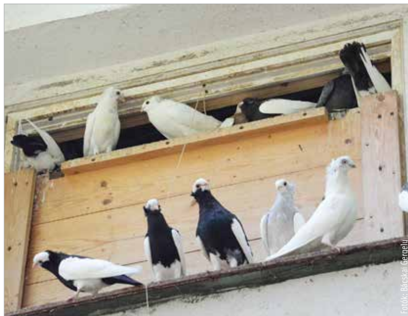
A bukógalamb Felsővárosból származhat

fehérváron belül a Felsővárosból származhatott a madár, aminek jellegzetessége, hogy egyszínű, szíves hátú és fekete szalagos kék madár. A legnagyobb populációja a fajtának Székesfehérváron kívül Székelyföldön található. Az ottani kiállításokon a legtöbb bemutatott fajta a székesfehérvári bukógalamb.