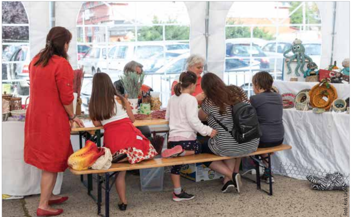
Színes, változatos programok várták a fiatalokat is a környezettudatos életmód jegyében

Pénteken a gyerekeké volt a terep: egészségtudatos és környezetbarát életmódra nevelő játékos foglalkoztatási program várta az általános iskolás csoportokat, melynek keretében hallhattak arról is, miért fontos az újrahasznosítás, és mit lehet tenni ennek szellemében környezetünkért. Az iskolások a Jancsárkert parkolójában felállított nagy sátor alatt először mézet kóstoltak, majd almalevet készítettek, később kipróbálhatták a Játékos tudomány – Érzékszervek világa című interaktív kiállítást, végül szemetet szelek-