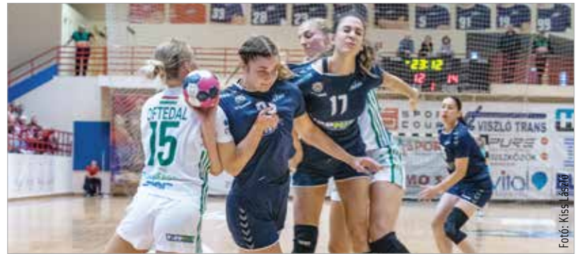
Nagy küzdelemre készítette szerdán világlklasszissokkal felálló ellenfelét az Alba Fehérvár KC a női kézilabda-bajnokságban, de a Győr végül öt góllal, 30-25-re nyert a Kőfém-sportszarnokban a fehérváriak ellen