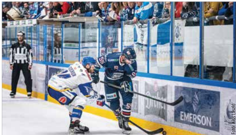
Végre ismét nézők előtt játszhattak Sarauerék a fehérvári jégcsarnokban!

Pesze a Villach 5-1-es és a ligaújonc Val Pusteria 5-2-es legyőzéséhez a többiek is sokat tettek hozzá, nem véletlenül dicsérte a mester az egész csapatot. Pénteken és szombaton, nem egészen huszon-négy óra leforgása alatt kellett a két meccset lejátszani, de fejben is frissnek tünnek a fehérváriak. Így két sima sikerrel nyitották a hosszú szezont, melyben lesznek persze még nehezebb feladataik is. Például az első idegenbeli mérkőzésükön, pénteken a Vienna Capitals otthonában, ami után vasárnap ismét a Villachot fogadják.