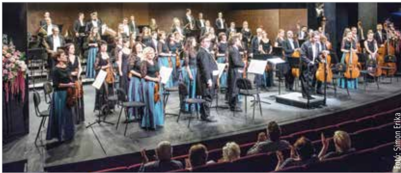
Megkezdődött a komolyzenei évad

A koncertsorozat szeptember 23-án a Szent István Hitoktatási és Művelődési Házban egy Csajkovszkij-esttel folytatódik.