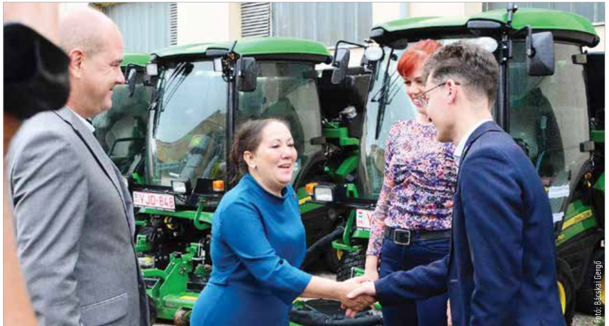
A Városgondnokság, a Roma Nemzetiségi Önkormányzat és a város együttműködése többeket visszasegíthet a munka világába

Az új munkatársak egy új foglalkoztatási program keretében érkeztek a Városgondnoksághoz. Cser-Palkovics András, Székesfehérvár polgármestere lapunknak elmondta: „Egyértelmű, hogy erőteljes a munkaerőhiány a városban, az elmúlt másfél év minden nehézsége ellenére. A város gazdasága növekedési pályán van, és a világ legkorszerűbb technológiája működik a fehérvári vállalatoknál. A Városgondnokságnak is egyszerű saját gépparkja van, amit azonban működtetni kell. Szeretnénk megtalálni és segíteni azokat az embereket, akik nehéz körülmények között