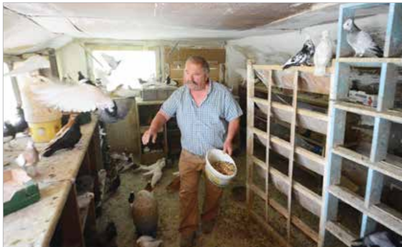
A galambászat folyamatos jelenlétet igényel

Nehéz dolog a galambászat, hiszen folyamatos jelenlétet igényel. A galambtenyésztés azonban egy nagyon szép dolog! A székesfehérvári bukóval pedig egyértelműen értékmegőrzést végzünk. Ez egy olyan fajta, ami jellemzően fehérvári, és itt is alakult ki két-háromszáz évvel ezelőtt. Akárhány fiatal érkezne holnap, hogy szívesen belekóstolnának a galambászatba, mindenkinek szívesen segítenék!