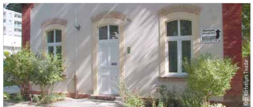
Nemcsak szépülhetnek a nyugdíjasok a szolgálatotól, de megbízható szakemberekhez is fordulhatnak segítségért