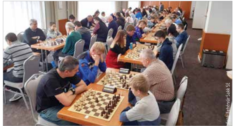
Nyolcvanegyén ültek táblához a nemzeti ünnepen rendezett versenyen