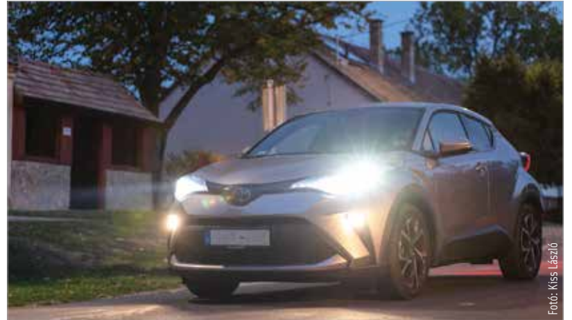
Szürkületben és a sötét napszakokban is biztonságot jelent a jól kivilágított autó!

vizsgálthatjuk át autónk világító és fényjelző berendezéseit, gumiabroncsait. A Látni és látszani! kampány weboldalán (osz.latnieszlatnizani.hu) akár a térképen, akár a településkereső funkciót használva gyorsan ellenőrizhetjük, hogy közelünkben mely szervizekben kérhetjük az ingyenes átvizsgálást.