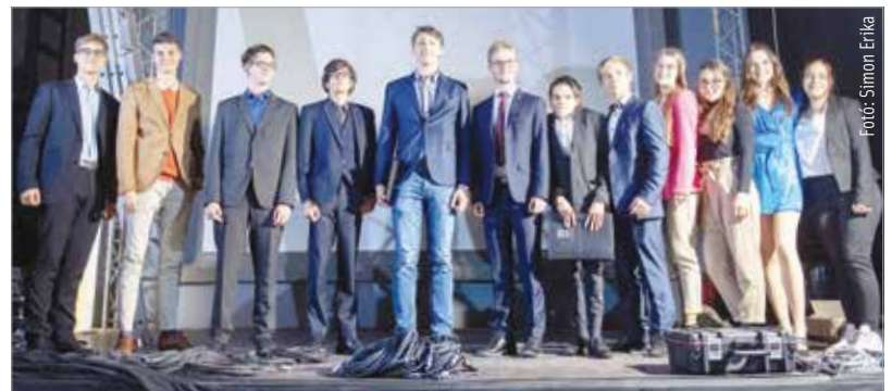
A Szóval győzni tavalyi döntősei