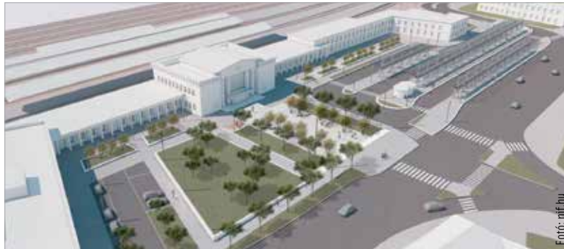
A székesfehérvári intermodális csomópont esetében a helyi és helyközi buszok, valamint a vasút találkozik majd egy központban

A fehérvári intermodális csomópont esetében a helyi és helyközi autóbuszok, valamint a vasút találkozik egy központban, ami kiegészül kerékpáros és egyéni autós megközelítési és parkolási lehetőséggel. A vasútállomás épületében is lesznek belső átalakítások, mivel helyet kell kialakítani benne a Volánbusz számára, illetve az autóbusszal utazókat is itt fogják kiszolgálni. Ezenkívül a Vasvári Pál Gimnázium mögött egy parkolóház és felszíni parkolók, valamint a Széchenyi út irányába egy busztároló és a buszvezetőket kiszolgáló szociális épület létesül. A Béke téren kap helyet egy tizenkét állásos buszpályaudvar, a vasútállomás főbejárata és a keleti szárny által határolt területen pedig