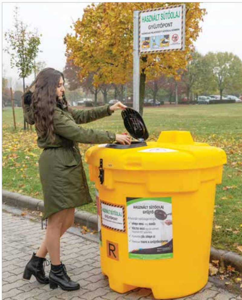
A gyűjtőpontok listája elérhető a www.deponia.hu honlap „Szelektív szigetek” elnevezésű oldalán, a használsütőolaj-gyűjtőpontok keresője segítségével

A begyűjtött sütőolaj hasznosítóhoz kerül, ahol egy zárt rendszerben száz százalékban feldolgozzák. A folyadék kb. kilencven százaléka tisztított növényi olaj, mely elsősorban a biodízel-iparágban hasznosul újra, azaz az üzemanyaggyártás alkotórészeként használják fel, a maradék tíz százalék a szűrőkön fennakadt anyag, ami biogázüzemekbe kerül. A biogáz elektromos és hőenergia formájában haszno-