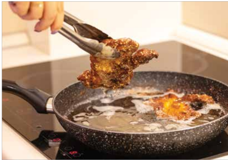
Egyes tesztek szerint rántott ételeket háromszor, sült krumplit akár nyolcszor is süthetünk ugyanabban az átszűrt olajban

Magyarországon évente több mint ötvezer tonna olajat használunk fel sütési célra. Az így keletkező használt zsiradék sorsa azonban csak az üzemi konyháknál és éttermeknél megoldott, az otthoni felhasználásnak csupán hat-hét százaléka kerül újrahasznosításra. A lakosság által használt olaj jelentős mennyisége jelenleg sajnos a lefolyóba, a WC-be vagy a háztartási hulladékba kerül. Ez több szempontból is igen káros, hiszen a csatornarendszer falára