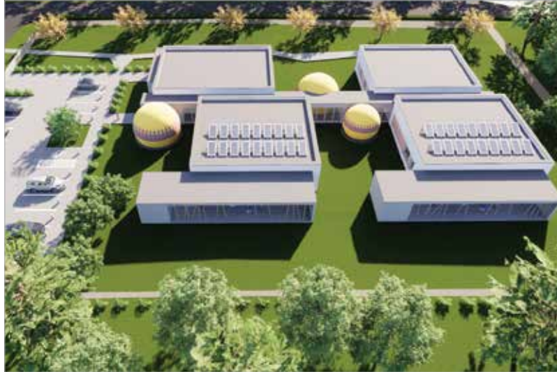
Az új maroshegyi bölcsőde az egyik legkorszerűbb nevelési intézménye lesz a városnak

A közgyűlés elfogadta a helyi közösségi közlekedés díjszabásának módosításáról szóló rendeletet is, így januártól kétszáznyolcvan forintért, azaz egy vonaljegy árért lehet majd havi tanulóberletet váltani Székesfehérváron. A berlet árának drasztikus csökkentésével az önkormányzat arra szeretné ösztönözni a fiatalokat és családjaikat, hogy iskolába járáshoz a saját autó helyett minél többen a közösségi közlekedést használják. Ez a közlekedési problémák és a zsúfoltság enyhítése mellett a családok anyagi terheit is csökkenti, valamint a klímavédelmet is szolgálja. Székesfehérvár polgármeste-