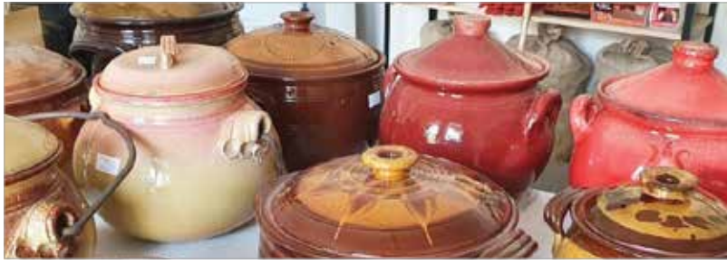
A cserépedények nemcsak szépek, de hasznosak is!

Az új irányvonalat a füstmentes kandallók képviselik fal- és asztaldíszek formájában. Ezek a termékek bioetanollal üzemelnek, használatuk és tisztításuk egyszerű. Mivel nem kell hozzájuk kémény, akár a panel- vagy társasházi lakások díszé is lehet. A bioetanol nemcsak szagtalan változatban létezik, hanem illatosított formában is. Újdonságként megemlíthetjük a gázkandallókat is, melyek nagy kényelmet nyújtanak a felhasználónak.