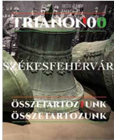
A vándorkiállítás Székesfehérváron november huszadika és december harmadika között tekinthető meg a Jancsárkert Termelői Piac melletti parkolójában

államot. A tematikus egységekre bontott tárlat számos forrás bevonásával, a kort megidéző kulisszákkal mutatja be a trianoni békediktátumhoz vezető utat, annak következményeit és az államiság megőrzése érdekében tett erőfeszítéseket.