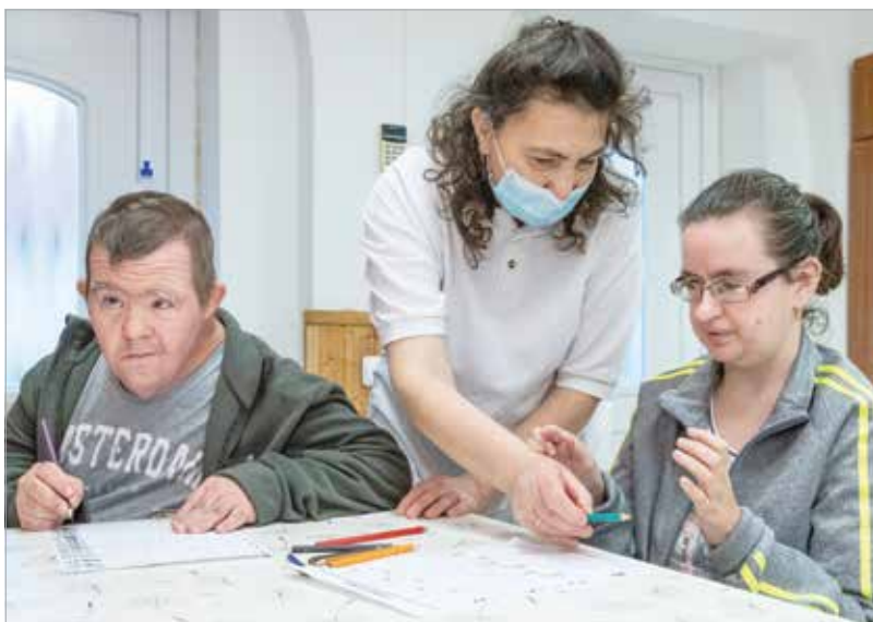
A város szociális intézményeiben dolgozók hűségjutalmi rendszerének bevezetéséről a decemberi közgyűlésen születik döntés

Jövőre a hűségjutalom a négy intézményben összesen száztizenhat munkavállalót érint, az ehhez szükséges forrást, több mint húszmillió forintot az önkormányzat az intézményeken keresztül biztosítja. A munkavállalók a jutalmat a munkaviszonyuk fordulónapjának hónapjában kapják majd meg.