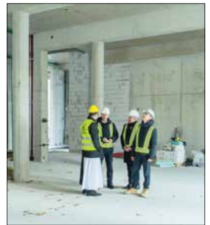
A tornacsarnok után a kormányzati támogatásnak köszönhetően rögtön indulhat az új tantermek építése is

Az országban kétszázharmincezer diák tanul egyházi intézményekben, a kormány számára ezért is fontos a különböző rendek támogatása – mondta el lapunknak Soltész Miklós, az egyházi és nemzetiségi kapcsolatokért felelős államtitkár.