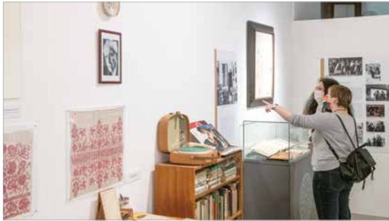
A látogatók elmélyülhettek a Pesovár-életmű sokszínűségében

hagyományaink, a kultúránk, benne pedig a népzene, a néptánc jelenti. A város és Fejér megye sokat köszönhet Pesovár Ferencnek, aki 1957-től 1983-ban bekövetkezett haláláig volt a múzeum néprajzosa, osztályvezetője. A megye és az egész magyar nyelvterület népzene- és néptánc kultúráját kutatta, miközben az akkori Alba Regia Tánc-együtteshez is ezer szállal kötődött – emelte ki Cser-Palkovics András polgármester. Varró Ágnes néprajzkutató, a tárlat kurátora köszönetet mondott