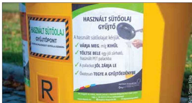
Ilyen sárga hulladékgyűjtőbe kell elhelyezni a használt sütőolajat!

A gyűjtőpontok listája a www.deponia.hu honlap „Szelektív szigetek” elnevezésű oldalán, a használt sütőolaj gyűjtőpontjainak keresője segítségével érhető el.