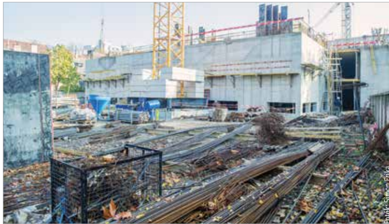
A díszterem, a tornaterem és az ebédlő várhatóan jövő őszre készül el, a tizenkét új tanterem pedig a jövő év végére

A Ciszterci Szent István Gimnázium sportcsarnokának és dísztermének építési munkálatai egy évvel ezelőtt kezdődtek. A tervek már 2013-ban megfogalmazódtak, 2017-ben pedig megérkezett megvalósításukra a 2,6 milliárd forintos kormányzati támogatás. Az alapkövet 2018-ban tették le, és tavaly ősszel megkezdték a kivitelezést a szakemberek. Bérczi László Bernát, a zirci ciszterci apátság kormányzó perjele elmondta: „Amikor az apátság ezt az iskolát a huszadik század első felében építette, más létszámra készült: négyszáz fős iskola volt. Most már a duplájánál tartunk. Egyre fejlődik az iskola, egyre többen választják, egyre jobb az eredmények!” Egy ideig úgy tűnt, csak a modern tornacsarnok, a díszterem és az ebédlő épülhet, illetve újulhat meg, a második ütemre,