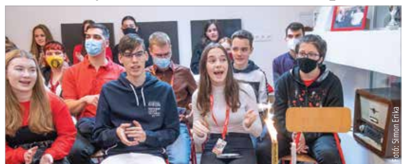
A magyar rádiózás napján tartotta tíz plusz egyedik születésnapját a székesfehérvári Táska Rádió a Lánzos Kornél Gimnáziumban. A rendezvényen megnyitották a rádió fennállását ünneplő fotókiállítást, valamint bemutatták a Táska Rádió stúdióját és az itt tevékenykedő önkéntes diákrádiósokat.