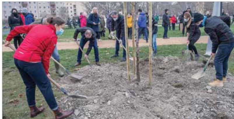
Sokan kivették a részüket a faültetésből

A sétány ünnepi megnyitóján Cser-Palkovics András, Székesfehérvár polgármestere köszönetet mondott a vállalat kiemelkedő és példaértékű társadalmi szerepvállalásáért, a közösséghez való viszonyáért.