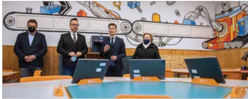
A Munkácsyban is egyedi arculatot kapott a digitális „játszóter”

De nemcsak a kinti újdonságokban lelhetik örömeiket a diákok: egy okostantermet is átadtak az intézményben. Így az Alba Innovárral és a Székesfehérvár Fejlődéséért