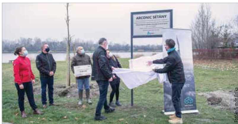
A sétányt jelző tábla a gyárban előállított alumíniumból készült