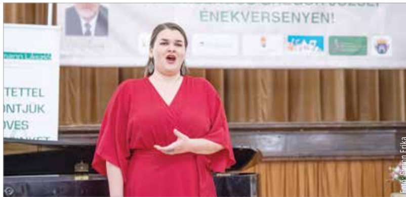
Huszonhárom intézményből nyolcvankilenc nevezés érkezett az énekversenyre, mellyel méltó módon állítottak emléket a 2006-ban elhunyt operaénekesnek, Gregor Józsefnek

A diákok három kategóriában, korcsoportonkénti bontásban versengtek. Magyar népdalfeldolgozásokkal, XX. századi magyar dalokkal, barokk, klasszikus és romantikus dalokkal, áriákkal és szabadon választott művekkel készülhettek.