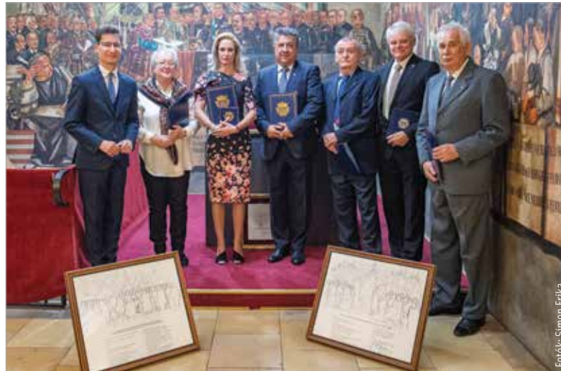
Együtt a díjazottak, akiknek sokat köszönhet a város

Cser-Palkovics András polgármester köszöntőjében kiemelte: a város az elismerések adományozásával kifejezi tiszteletét és megbecsülését mindazon személyek és közösségek iránt, akik életművükkel, munkájukkal, a város közéletében való közreműködésükkel kiemelkedő teljesítményt nyújtottak, a köz érdekében végzett tevékenységükkel segítették Székesfehérvár szellemi és anyagi gyarapodását: „Kicsit más körülmények között adjuk át most a város díjait, szakmai elismeréseit, mint ahogy szoktuk. Szűkebb körben, de mondhatjuk, hogy baráti körben. Szimbolikus, hogy a különböző szakmai díjakat,