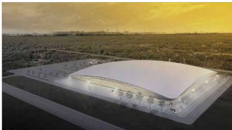
A jelentős mennyiségű termőföld elszállítása elsősorban munkanapokon és munkaidőben, esetenként szombati napokon történik

(az Auchan mellett) és a 7. sz. főút elkerülőszakaszát érintik majd. Az üresen visszatérő gépjárművek esetében az önkormányzat egy, a lakosságot kevésbé zavaró útvonallal tervezett, de a Magyar Közút előírásai mellett erre nincs lehetőség, így a Budai úton, a Topolyai utcai jelzőlámpás csomópontnál és a Palánkai út egy szakaszán közlekedve tudnak csak visszafordulni a teherautók a munkaterület irányába.