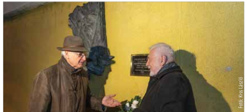
Vigh Tamás Pilinszky-reliefje mellé most névtábla is került

Az esten bemutatták az idén megjelent, Önéletrajzaim című könyvet is. Pilinszky élete utolsó éveiben ugyanis ezzel a címmel publikálendő kötetben dolgozott – a teljes mű azonban már nem készült el. A most megjelent könyv az elkészült, és életében megjelent fejezeteket rendszerezi, mellette pedig közreadja a kapcsolódó töredékeket is. A könyv szövegeit Bende József válogatta és rendezte sajtó alá. A könyvbe bekerült az a kézirat is eredeti formájában, mely negyven évvel Pilinszky János halála után került elő idén tavasszal a költő egykori bérletéből.