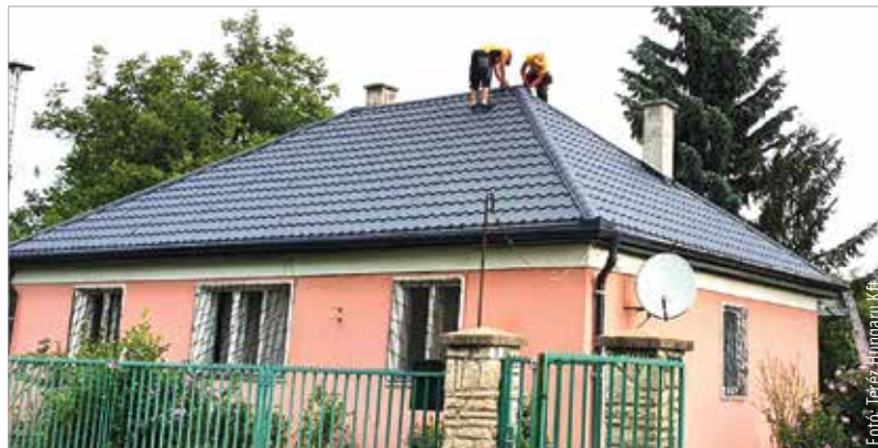
Régi ház, új tető, alpinista technikával, állványozás nélkül