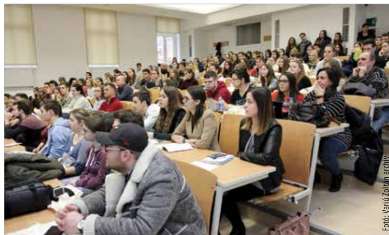
Várhatóan az új tanévben is benépesülnek a fehérvári egyetemek előadótérmei

Székesfehérváron mindhárom felsőoktatási intézménybe pótfelvételezhetnek a továbbtanulni szán-