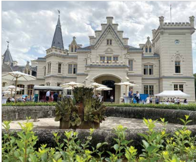
Ismét megnyitotta kapuit a látogatók előtt a Nádasdyak otthona

A legfőbb attrakciók közül említésre méltó, hogy az Ősök csarnokába a restaurálás után visszakerültek az eredeti portréfestmények. Így a kastélyban olyan neves festők munkáival találkozhatnak a látogatók, mint Benczúr Gyula vagy Barabás Miklós. A portrékon szereplő családtagok története élményszámba megy, a legérdekeseb-