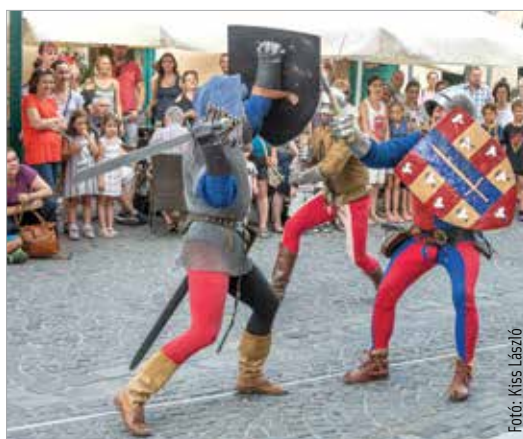
A harcosok küzdelme visszarepítette a nézőket a középkorba