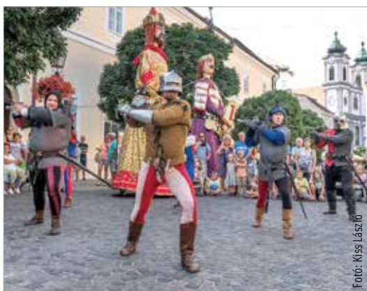
A Magyar Királyi Kardforgatók Rendje a régmúltba kalauzolta el a látogatókat