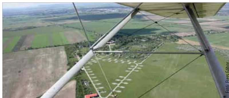
Sport- és üzleti célú repülőtér épül Börgöndön

A pályázatok értékelésénél ugyanolyan súlyt kap az ár és a minőség, a pályázók ajánlattételi határideje augusztus 26.