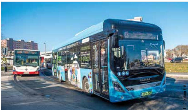
Korábban már kipróbálhatták a fehérváriak az elektromos autóbust

A Zöld Busz Program keretében meghirdetett, az elektromos autóbuszok és a kapcsolódó töltő-infrastruktúra beszerzését támogató felhíváson a Volánbusz hét pályázata szerepelt sikerrel. Az összesen száz jármű beszerzését követően a Volánbusz üzemeltetheti majd az egyik legnagyobb, alternatív meghajtású járművekből álló autóbuszflottát Közép-Európában.