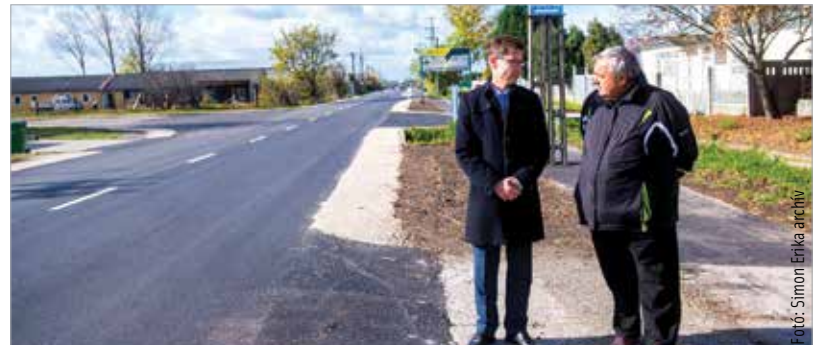
Cser-Palkovics András és Szigli István egy korábbi eseményen Feketehegyen

és egy önkormányzati tisztviselő hölgynek írt kommentet, amelyben azt írja Szigli István: „túl sok rajtad a ruha”. A nyílt levélben a polgármester felszólítja Szigli Istvánt, hogy tartsa be a képviselői esküjében foglaltakat, értekezzen, fogalmazzon és szolgáljon úriemberhez, képviselőhöz, Székesfehérvárhoz méltó módon. Cser-Palkovics András azt is kifejezte, helyes lenne az elfogadhatatlan kijelentésekért nyilvánosan elnézést kérnie az önkormányzati képviselőnek. A nyílt levélre Szigli István közösségi oldalán érkezett válasz. A politikus azt írja, a pandémiának köszönhetően érzékenyebben reagált az eseményekre. Így néha előfordult, hogy meggondolatlanul, elhamarkodottan ítélte meg helyzeteket. Azoktól a honfitársaktól, akiket bármilyen módon megbántott, elnézést kér.