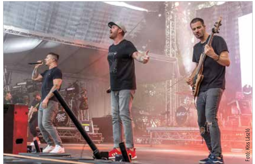
A Ligetbe ezúttal a Wellhello és a Halott Pénz koncertje vonzotta a fiatalokat