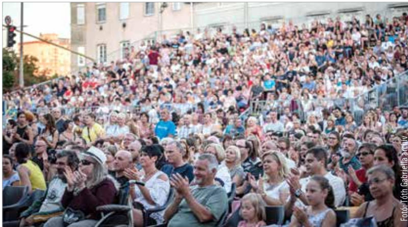
Telt ház a Zichy-színpad előtt – idén újra jöhetnek a nézők a belvárosba