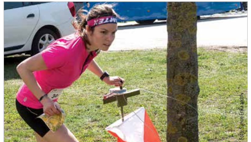
Fiataloknak volt már verseny Fehérváron, most az idősebbek mutathatják meg, hogy mire képesek

a versenyzők ezen a távon nem terepen, hanem Székesfehérváron, a Csónakázó-tónál és a belvárosban keresik majd az ellenőrző pontokat. Ez pedig alkalmas rá, hogy a közönség számára is vonzóvá tegye a programot. A rövid távú döntőben a Palotai út–Mátyás király körút–Zichy liget–Várkörút–Kis Budai út által körülvevő területen futnak majd a versenyzők. Terepen is lesz azért verseny: közép- és normál távon a selejtezőket Csákvár környékén rendezik. Augusztus 11-én a középtáv döntője Csala és az Ingókövek környékén lesz, a normál táv pedig újfent Csákváron.