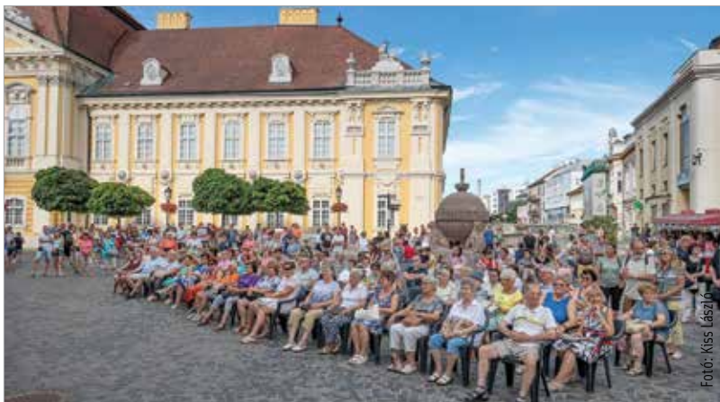
Ismét nagy közönségsikert aratott a szombati Művészkör