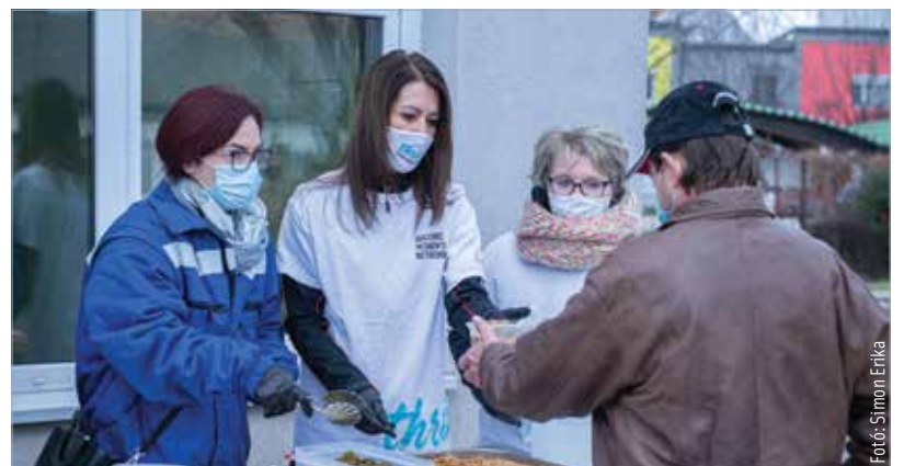
Kétszáz adag meleg ételt és takarókat is kaptak a Kríziskezelő Központban ellátott hajléktalanok