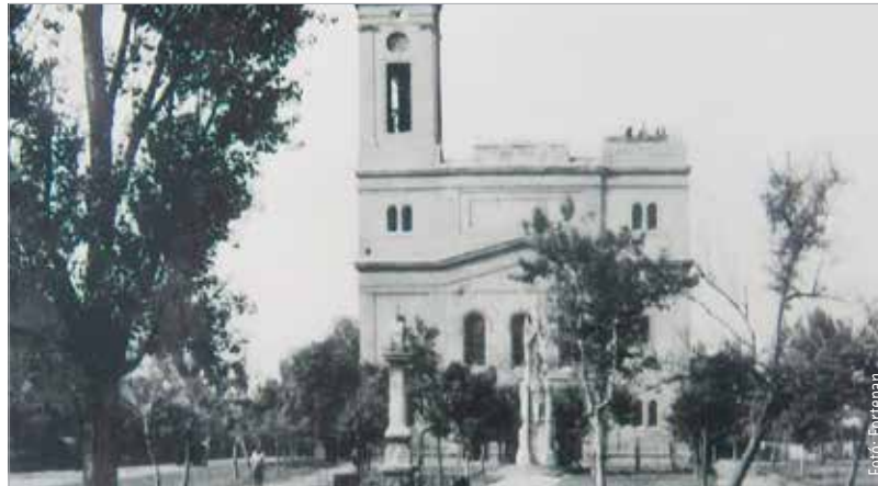
A templom a II. világháborúban megsérült, egyik tornyát el is veszítette, és csak 1960-ra épült fel teljesen a tornyok a hívek adományából. Ekkor restaurálták Szent Sebestyén szobrát is.

A felsővárosi gazdák 1807-ben ajánlották fel, hogy a Szent Sebestyén-templom melletti romos iskolát megveszik, és lebontják a tűzveszély miatt. Az élelmes hívők a bontási anyagot elárverezték és 1070 forintért eladták, majd a vételárat a templom javára felajánlották. A templom előtti utat 1809-ben lekövezték, amihez a belvárosi plébánia is hozzájárult. A két torony építése 1836-ban tör-