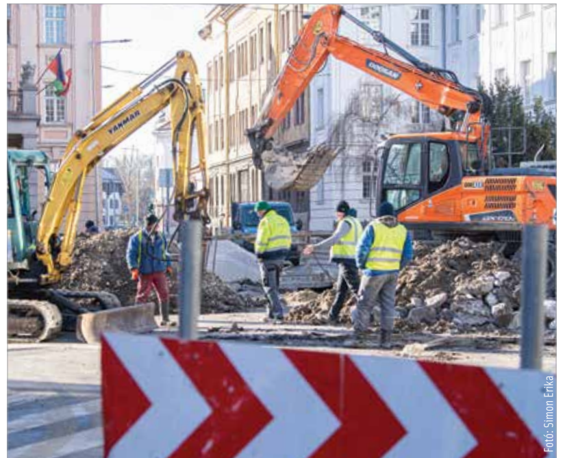
Várhatóan március közepén kapják vissza az autósok a kedden lezárt útszakaszokat

A lezárások érintik a helyi és regionális autóbuszok útvonalát, ezért az érintett járatok a korlátozások időtartama alatt terelőútvonalon közlekednek. Az ideiglenes útvonalokról a város honlapján lehet tájékozódni.