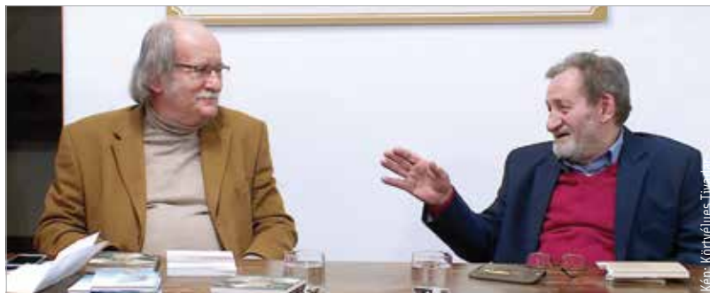
Jó hangulatú beszélgetéssel indult a Királykúti esték új évada

A székesfehérvári irodalombarátok a találkozón meggyőződhetnek róla, hogy költészetében továbbra is egybeolvad, eggyé szervesül hagyomány és modernség, részletgazdagság és elvonatkoztatás, környezetünk tárgyyszerű leltárba vétele és intellektuális átlényegítése, líraiság és gondolatiság, játékosság és komorság, a kezdet és a vég.