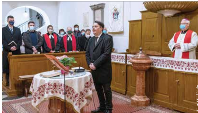
Január huszonharmadikáig minden nap este hatkor kezdődnek a közös imádságok