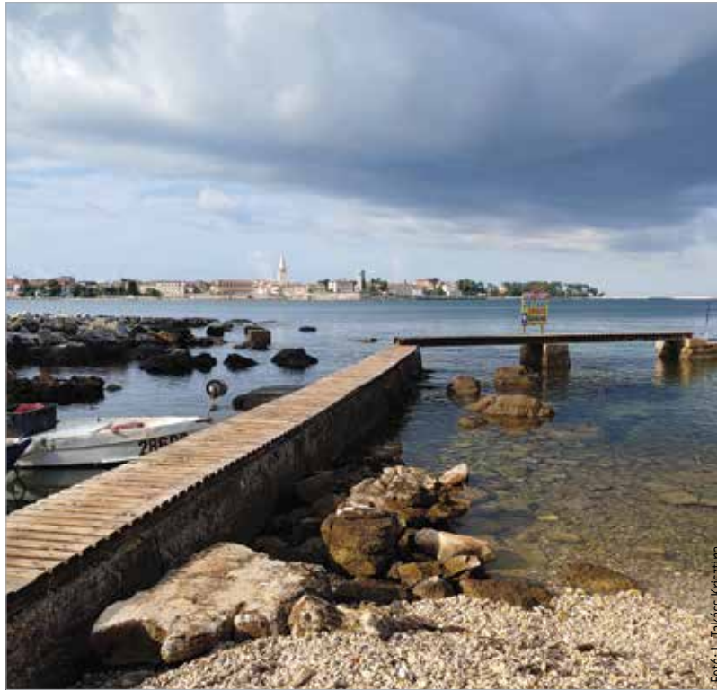
Idén érdemes hamarabb foglalni, mert a járvány miatt a lemondási feltételek is kedvezőbbek!

előfoglalási kedvezményeket kínálnak a partnereik: például kötbérmentes lemondási lehetőség van a bizonytalan helyzetre való tekintettel, bár ez már a tavalyi évben is rugalmasan működött. Idén sokan a török rivierára vagy a görög szigetekre szeretnének eljutni, illetve Közép-Amerika, ezen belül Mexikó és Dominika népszerű, de Dubai is sokak áhított úti célja.