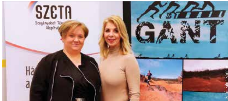
Két futóversennyel is támogatja a SZETA szervezetét az Alba Triathlon SE. Az egyik a Gánt Trail, amit március hatodikán rendeznek meg Gánton, míg a Cerbona Fehérvár félmaraton május nyolcadikán lesz városunkban.

A március hatodikán megrendezésre kerülő versenyen két kategóriában fogadják a nevezéseket: a High5 13 km Trail 220 méter, a Gánt 25 km Trail 460 méter szintet tartalmaz. A tizenhárom kilométeres távra már tizenhat éves kortól lehet jelentkezni, de huszonöt kilométeren csak a tizennyolc éven felüliek próbálhatják ki magukat. A futóversenyről az Alba Triathlon SE honlapján lehet tájékozódni, ahol online formában nevezni is lehet. A rajthelyek száma limitált, a két versenyszámra összesen ötszáz fő nevezését tudják elfogadni.