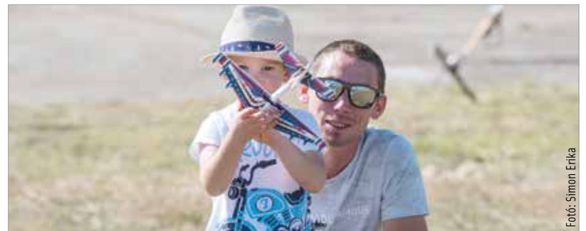
A Börgöndi Repülőnap is a száz legkeresettebb magyarországi program egyike volt tavaly

érdekesen alakult. Ha a Fejér megyei összképet nézzük, akkor messze kiszorultunk az első tízből: az első megyei program a listán ugyanis a negyvenhatodik helyen álló Móri Bornapok. Székesfehérvárról az adventi esemé-