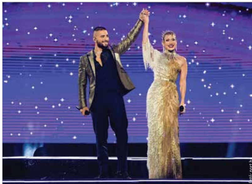
Az előadás után a Vegyél el! című amerikai zenés filmet láthatja a Csajos est közönsége