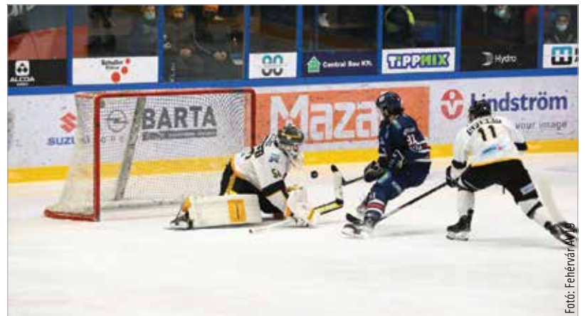
Majdnem mindent védett, ezzel a kupadöntő főszereplője lett a Debrecen kapusa