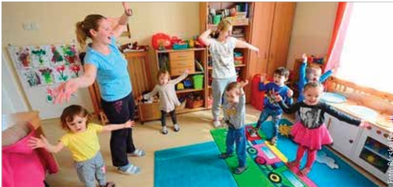
A hűségjutalmi rendszer kiterjesztéséről pénteken, a költségvetés elfogadásával döntenek a város képviselői

„Mivel a város anyagi, költségvetési helyzete polgáraink munkájának, a gazdaság teljesítményének köszönhetően azt lehetővé teszi, bevezetjük a hűségjutalom rendszerét az óvodai és bölcsődei dolgozóink számára is.”