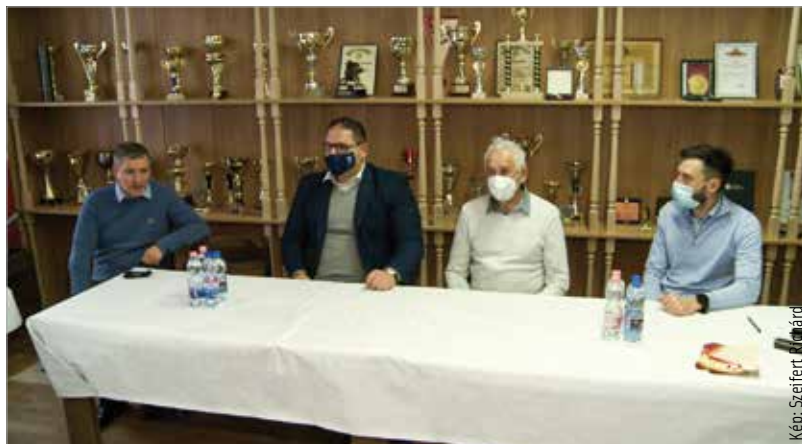
A sajtótájékoztató szobá került az egyesület múltja, jelene és jövője is

Jelenleg tizenhárom szakosztállyal rendelkeznek: asztalitenisz, atlétika, birkózás, íjás és lövés, cselgáncs, közelharc-kézitusa, ökölvívó, tenisz, természetbarát, triatlon, vívó, valamint a honvédelmi és ifjúsági, illetve a tömegsport szakosztály. A Honvéd Szondi György Sportegyesület folyamatos felvételt hirdet mind a tizenhárom szakosztály kezdő, haladó, és utánpótlás korú csapataiba, ahol az edzések tudásszinthez mérten, csoportbontásban zajlanak.