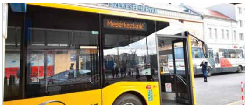
A most beszerzett nyolcvannal új, magyar busz több mint hatmilliárd forintba került

Fejér megye útjaira most hat környezetbarát, alacsony padlós busz érkezett, de nyár közepéig összesen nyolcvannal ilyen jármű érkezik az ország útjaira. A buszokat Debrecenben gyártották.