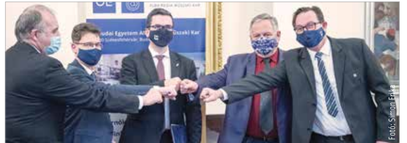
A megállapodás az egyetemi képzést segíti

A polgármester hozzátette, hogy a börgöndi repülőtér kialakításának már elindult a tervezési folyamata, a tervekhez pedig ezt a területet is hozzákapcsolják. Mindez része lesz annak a tudományos innovációs parknak, amit harmincötmilliárd forintból hoznak létre Székesfehérváron.