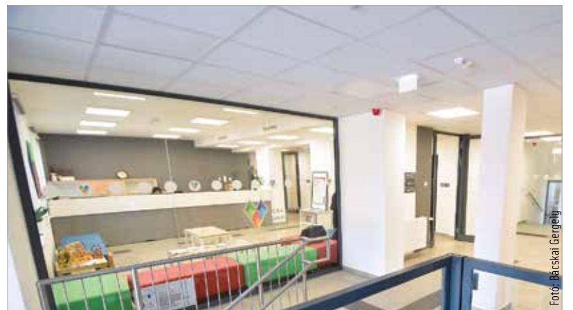
Többek között interjúszobákat, fejlesztőszobát, előadótermet és csoportszobát alakítottak ki, és megvalósult az épület akadálymentesítése is

eszközökben is olyan változások mentek keresztül, ami nagyban segíti a hatékony munkát. A földszinten kapott helyet az ügyféltér és a hozzá kapcsolódó helyiségek, az emeleten a központot kiszolgáló igazgatási, üzemeltetési funkciókat ellátó és a szakmai munkát végző kollégák dolgoznak. Korszerűsítették a fűtést, a hideg- és melegvízellátás rendszerét, új eszközöket, bútorokat és két járművet is beszerettek.