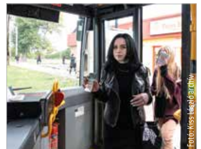
A terv szerint éjjel jár buszok is lesznek