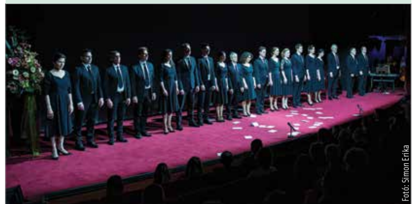
Az ember tragédiája-darabokból készült összeállítás emelte az ünnep fényét

A díjátadót követően A teremts ünnepe címmel Az ember tragédiája, illetve Az ember tragédiája 2.0 című kortárs darabokból láthattak részleteket az ünneplők, Horváth Csaba rendezésében.