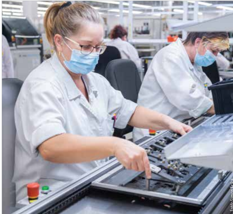
A Videoton elektronikai és autóelektronikai termékeket gyárt vevői számára. A képünkön látható fehérvári üzemem túl Bulgáriában további ezerkétszáz fő dolgozik a vállalat munkatársaként. Ezt a létszámot is szeretnék növelni az új beruházással.

Az elmúlt két évben komoly kihívásokkal kellett szembenéznie Magyarországnak, új világgazdasági korszakba léptünk. A kihívás egyben lehetőség is az ország számára, hogy új beruházásokkal versenyelőnyre tegyen szert – hangsúlyozta Szijjártó Péter külgazdasági és külügyminiszter a Videoton Holding Zrt.-nél tett látogatásán, ahol külpiaci támogatási oklevelet adott át a vállalat számára: „A tavalyi esztendő a magyar gazdaság szempontjából az egyik legjobb év volt, hiszen három olyan rekord is megdőlt, amelynek megdöntése békeidőben sem egyszerű. A legtöbb beruházás, a legtöbb munkába álló ember, a legtöbb export rekordja most már 2021-hez fűződik: 1886 milliárd forintnyi beruházás kormányzati támogatással, 4,7 millió munkában lévő ember és