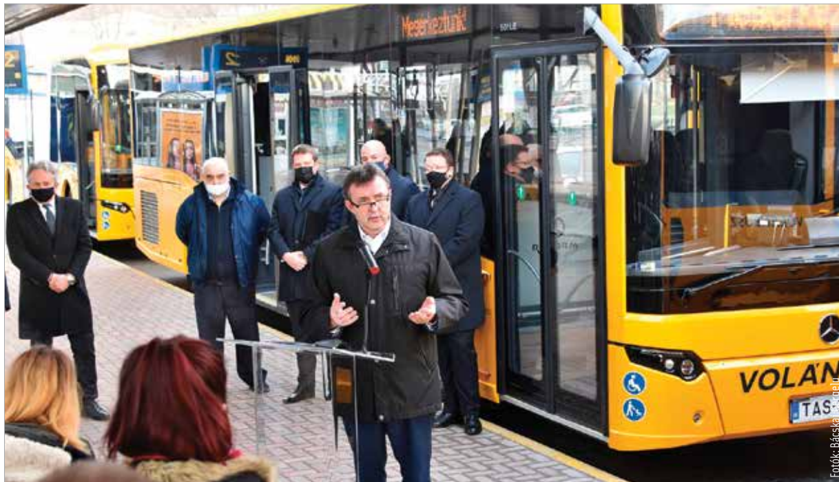
Tavaly háromszázhatvanöt új busz állt forgalomba országszerte

A kormány négy évvel ezelőtt indította el közösségi közlekedés-fejlesztési programját, melynek célja, hogy minél fiatalabb és biztonságosabb buszokkal utazhassunk a települések között. Ennek érdekében a buszok negyven százalékát már újra cserélték, és hamarosan tíz év alá csökken a flotta átlagéletkora. „Nagyon sokan használják ezeket az eszközöket, ez indokolta a kormány azon döntéseit mind a közúti, mind a vasúti területen, hogy hatékonyabb, biztonságosabb, kényelmesebb közlekedéssel szolgáljuk az utasokat.” – hangsúlyozta az új buszok bemutatóján Palkovics László innovációs és technológiai miniszter.