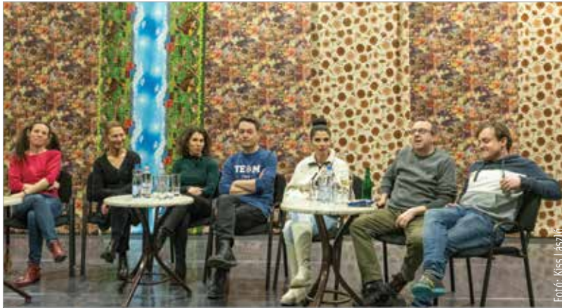
A beszélgetés során a résztvevők bepillantást nyerhettek a darab színpadra állításának titkaiba

már apokaliptikussá fokozza azzal, hogy mindenki kimondja, amit gondol, ami konfliktusokat szül, ahol az abszurditás és a valóság találkozik. A tömör megfogalmazásokkal, humorral átszótt dráma jó fogadtatásra talált. A nézők pedig a jó hangulatú beszélgetés során megtapasztalhatták, hogy a színészek miként indultak neki a feladatnak, hogy elmélyüljenek a köznapi lét hiteles ábrázolásában, hogyan éltek meg szerepüket a szemlélődő álomvilágban, ami bizony nem több, mint önmagunk becsapása, aminek pedig ára van.