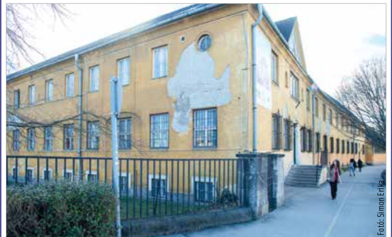
A meglévő épület felújítására és bővítésére ötmilliárd, az új tornaterem építésére egymilliárd forintot fordíthat a város. A felújítás műszaki tartalmáról olvasóink is tájékozódhatnak a város honlapján és az fmc.hu oldalon.

Az iskolafelújítások terveinek bemutatása hamarosan folytatódik a Kodolányi és a Tóparti gimnázium tanestületeivel tartandó egyeztetéseken, amelyek eredményéről szintén részletesen beszámol majd Cser-Palkovics András.