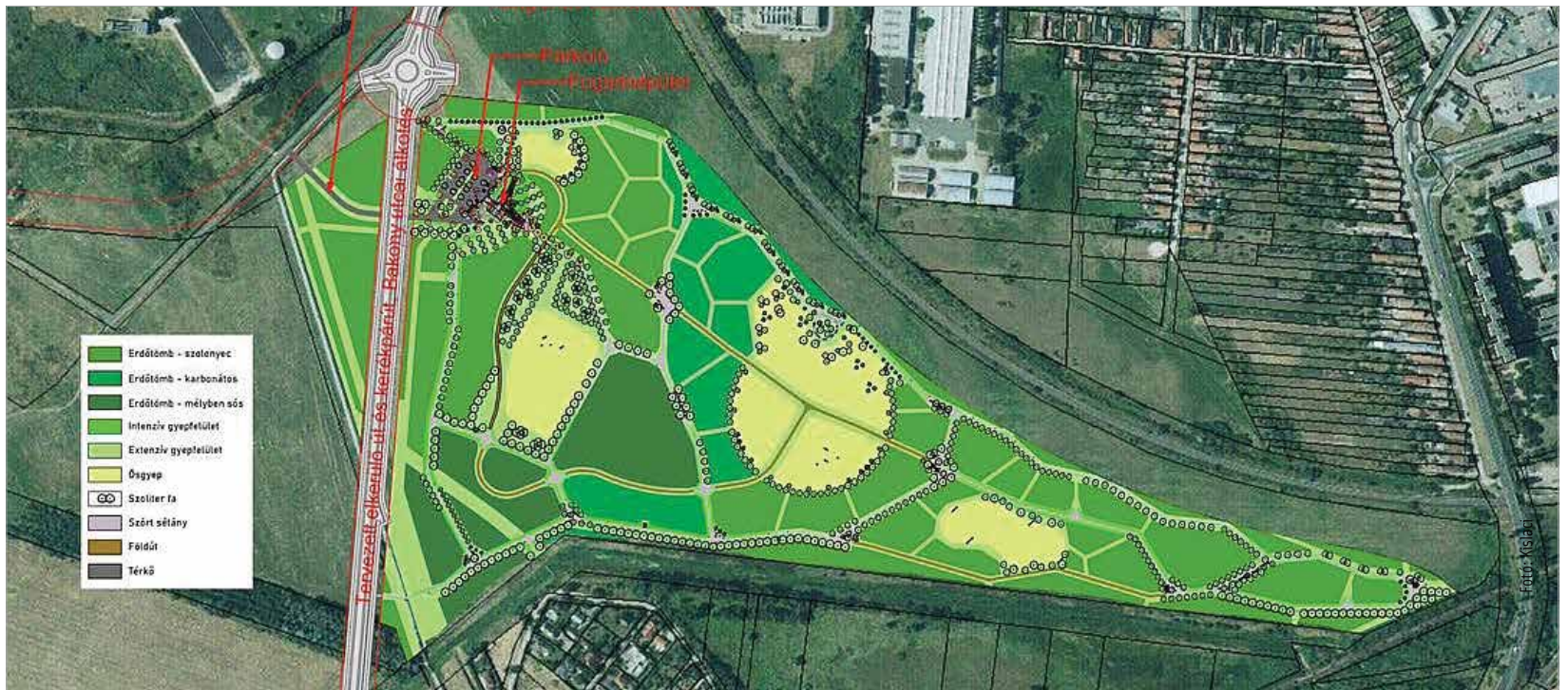
Székesfehérvár polgármestere az Alsóvárosi-réttel kapcsolatban hangsúlyozta: egy újabb szép kirándulási helyet teremtenek a városon belül, összekapcsolva az embert a természettel

„Az elmúlt napokban megjelent cikkek kapcsán leszögezném tehát: szó sincs az Alsóvárosi-rét beépítéséről, térkövezéséről – éppen ellenkezőleg! Megmentettük a rétet a beépítéstől, hogy zöldterület maradjon. Egy újabb szép kirándulási helyet teremtünk a városon belül, összekapcsolva az embert a természettel, ahogyan azt a Sóstónál is tettük!” – fogalmazott a polgármester.