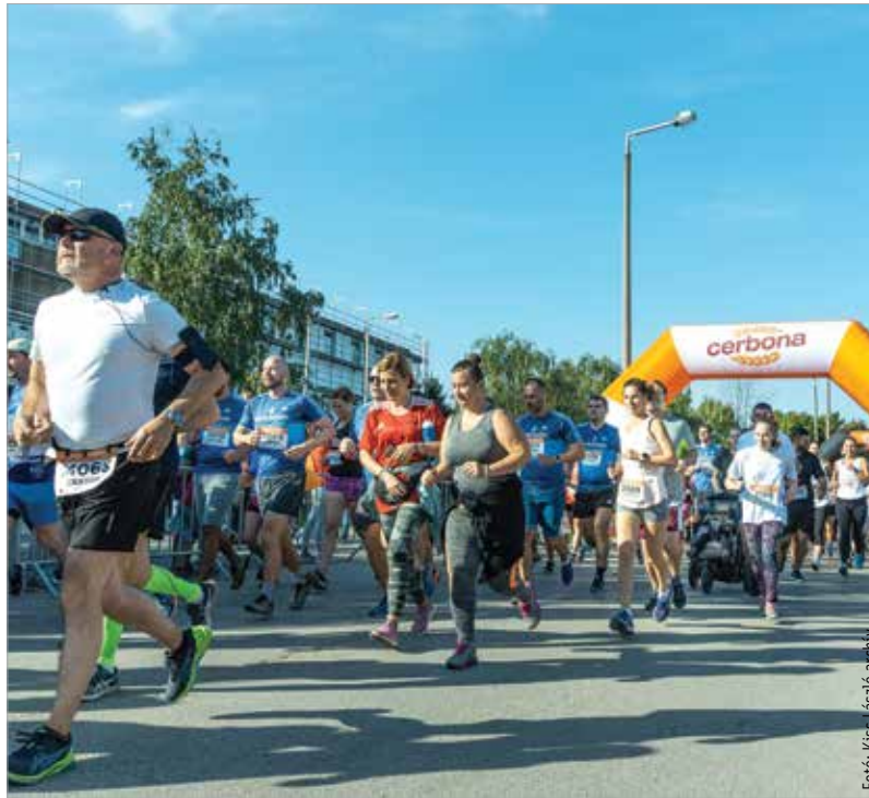
Idén is a Bregyóból rajtol a mezőny, és fut a belváros felé