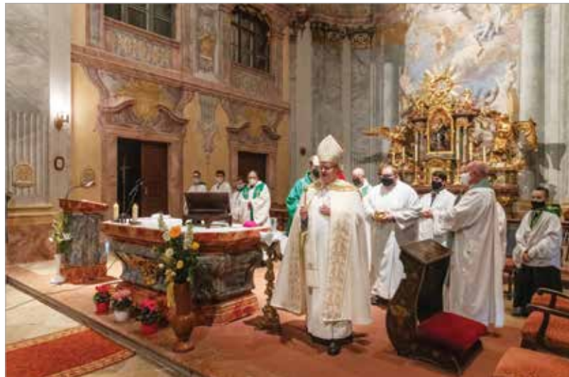
A megújult épületet Spányi Antal püspök áldotta meg. Az egyházmegye is hozzájárult a felújításhoz: tízmillió forinttal támogatták a beruházást.

Miklós, a Miniszterelnökség egyházi és nemzetközi kapcsolatokért felelős államtitkára megköszönte a rend kitartó, több száz éve – kisebb-nagyobb kihagyásokkal – zajló nevelőmunkáját: „Szükségük van a keresztény embereknek arra az összefogásra, amely az értékeket megvédi és a kereszténység elleni támadásokat visszaveri. Ezért termé-