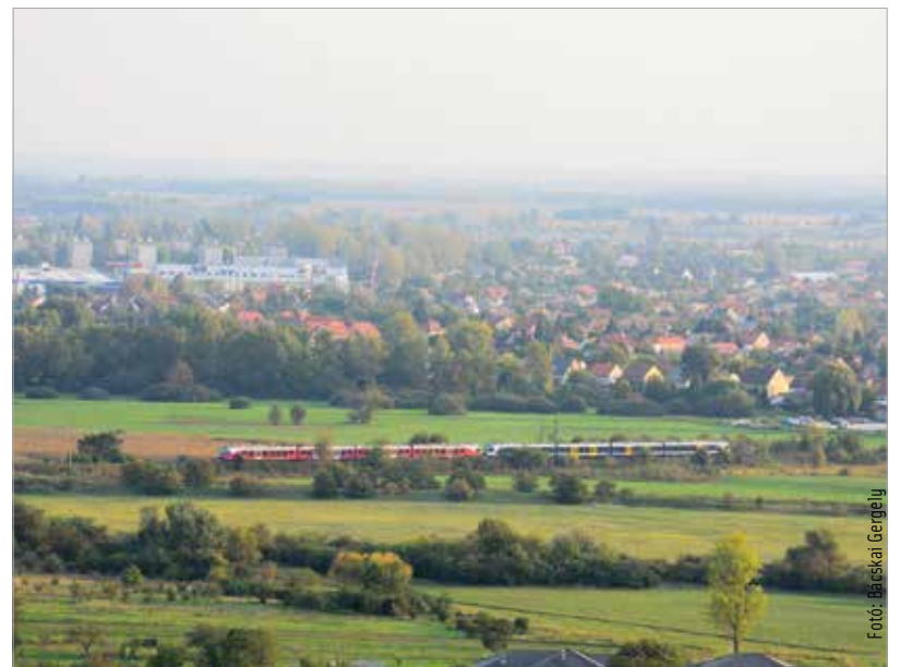
A réten hamarosan jelentős fásítás és parkosítás indul