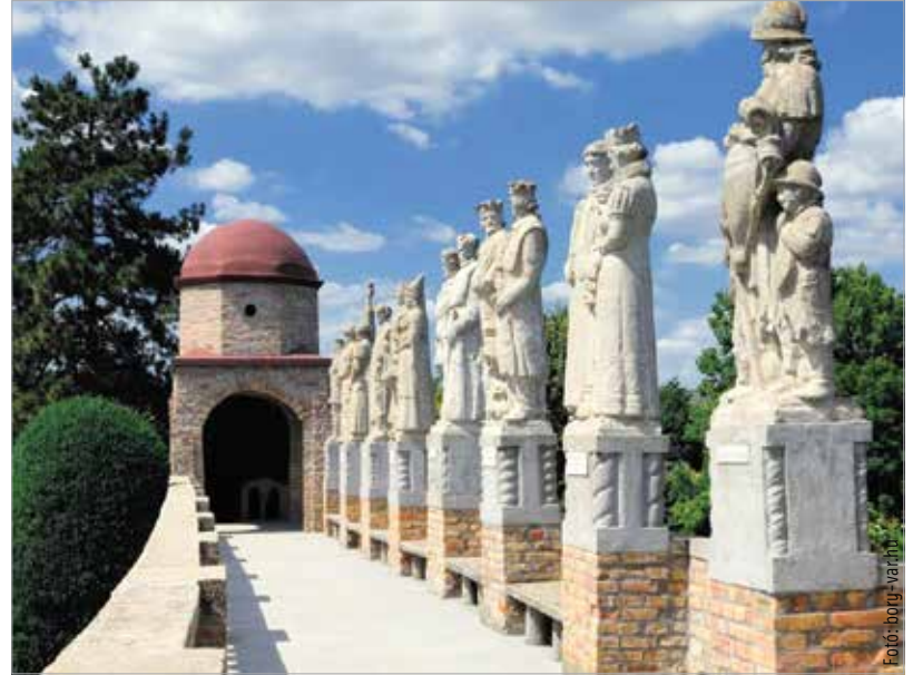
Január végén megnyílt a Bory-vár

1959-ig építette, bővítette, emléket állítva ezzel a hitvesi szeretetnek és művészi álmainak. Az épülecsoport ma is fontos kapocs a családtagok között, hiszen jelenleg is Bory Jenő leszármazottai működtetik az általuk létrehozott alapítványon keresztül.