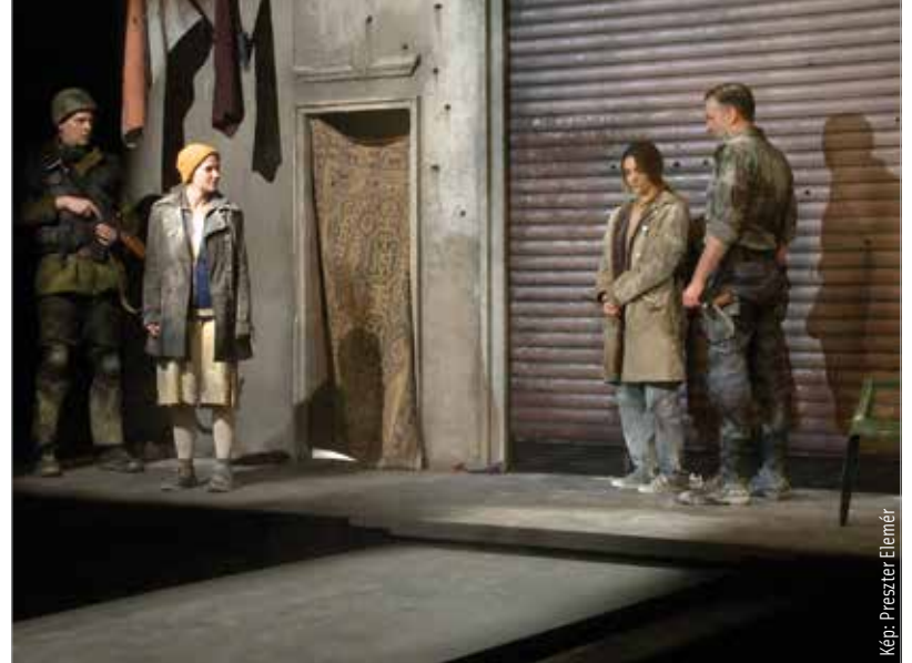
Iszméné, Antigoné és Kreón harca