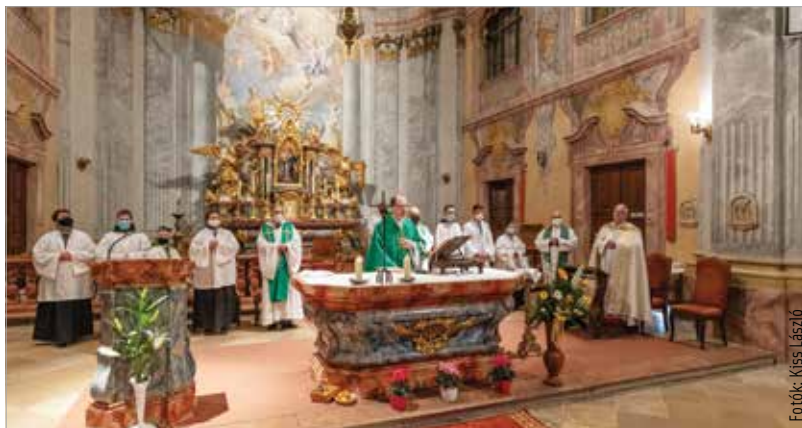
A korszerűsítés érintette a templom belső terét is, ahol restaurálási munkálatokat végeztek a szakemberek