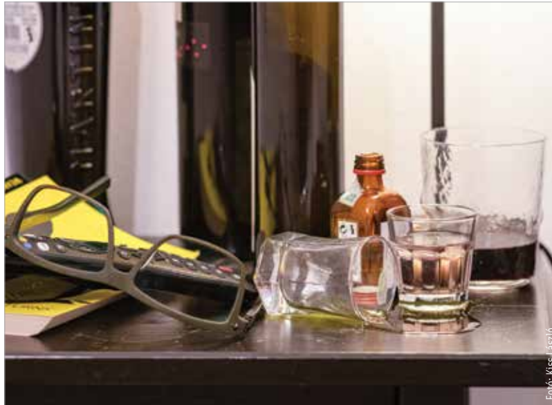
A járvánnyal járó korlátozások a tömény italok forgalmát is megdobták