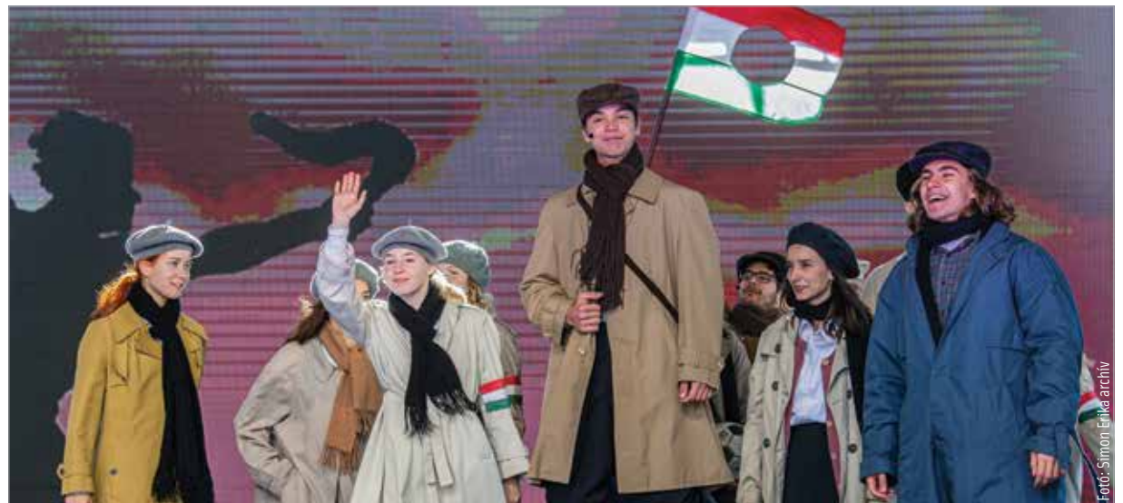
A város diáksága állandó résztvevője az előadásoknak

A történetek megosztásával kapcsolatos információk megtalálhatók a Székesfehérvári Közösségi és Kulturális Központ weboldalán. Az emlékeket április tizenötödikéig várják.