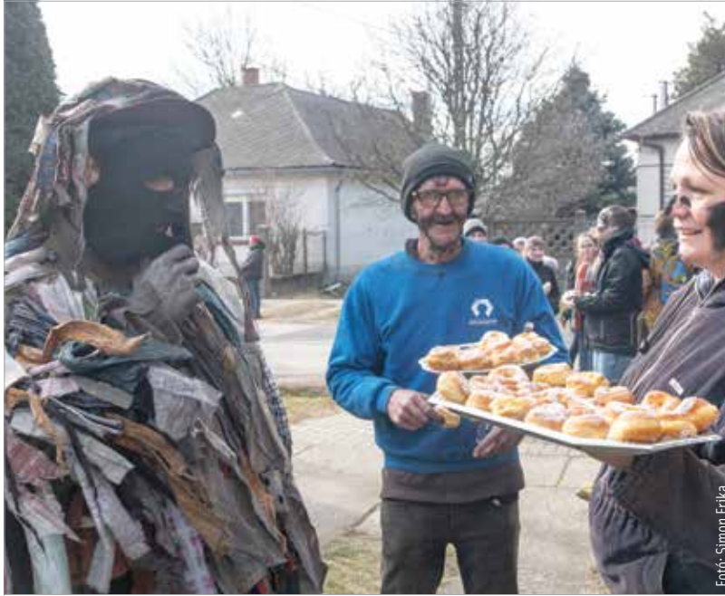
A település asszonyai is kivették a részüket a munkából: igazi mohai fánkot sütöttek, hogy az ország minden részéről érkező látogatókat kínálják

Márciusba fordult a naptár, de kellett némi „varázslás”, hogy ne csak hivatalosan legyen tavasz. Hétvégén még egy utolsó, nagyböjt előtti kolbászoltást tartottak a Jancsárkertben, a Szabad Színház télüző maskarás felvonulásával pedig végképp befellegzett a télnek! Húshagyókedden Mohán is megjelentek a maskarások, hogy a tikverőzés népi hagyományával korommal izzék el a hideg időt. Fotósaink pedig lencsevégre kapták a legjobb pillanatokat!