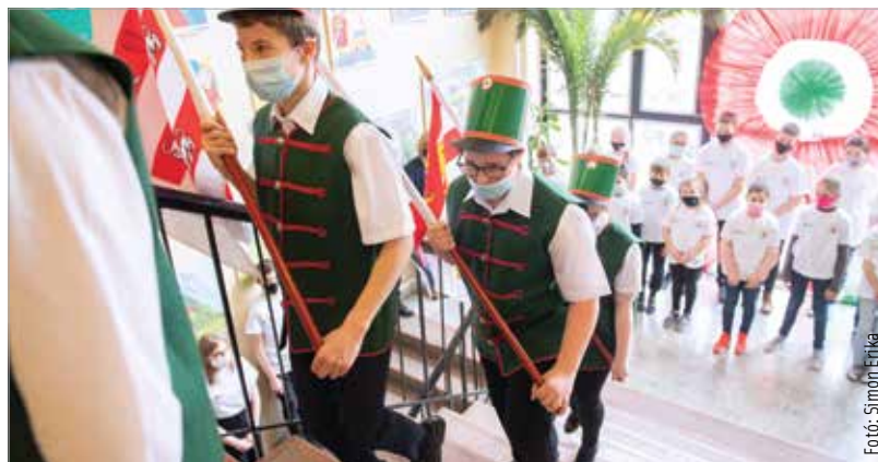
A diákok sorfalloal tisztelegtek a történelmi zászlók előtt, melyeket ifjú huszárok dobpergés kíséretében vittek a honvédelmi sportnap megnyitójára

A tornateremben kétféle sporttal is megismerkedhettek az iskola diákjai: a Székesfehérvári Judo Sportklub jóvoltából bepillantást nyerhettek a gyerekek a küzdősport alapjaiba, míg a terem másik oldalán a vívás került terítékre a Székesfehérvári Vívó és Szabadidő Sportegyesület képviselői által. A Vasvári honvédelmi napját a Honvédelmi Sportszövetséggel éveken ezelőtt kötött együttműködési megállapodás keretében szervezték meg idén is.