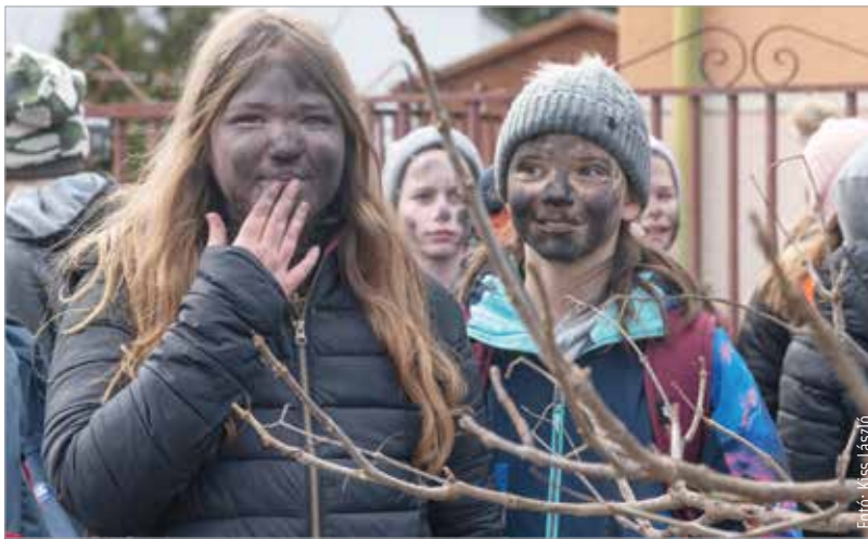
Koromban idén sem szűkölködtek a mohaiak