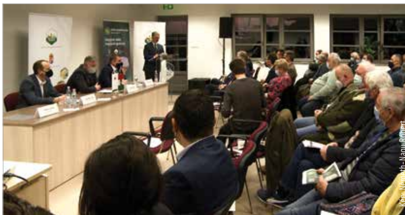
Nagy érdeklődés kísérte az uniós agrárpolitika változásait bemutató előadásokat

az agrárminisztérium vidékfejlesztésért felelős helyettes államtitkára, Fürjes Balázs, a kamara országos elnöke, Tessely Zoltán, a térség országgyűlési képviselője és vendégként Varga Imre István, a házigazda megyei kamara elnöke. Az előadásokból a gazdák megtudhatták, hogy a 2023 és 2027 között megvalósuló Közös Agrárpolitika kereteit a Megújuló vidék, megújuló agrárium elnevezésű program megvalósításának szentelik. Ebben a tudatban fejlesztik az agráriumot és az élelmiszer-előállítás, megőrzik a természeti értékeket, illetve a vidéken élők számára jobb életminőséget tesznek lehetővé.