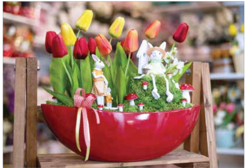
A piros és a sárga élénksége a tavasz frissességét hozza otthonunkba

kis fák is, melyek mellé általában egy-két tavaszt idéző figura is dukál. Ezeket a bejárati ajtó elé vagy a szoba egy-egy hangsúlyosabb pontjára is helyezhetjük.