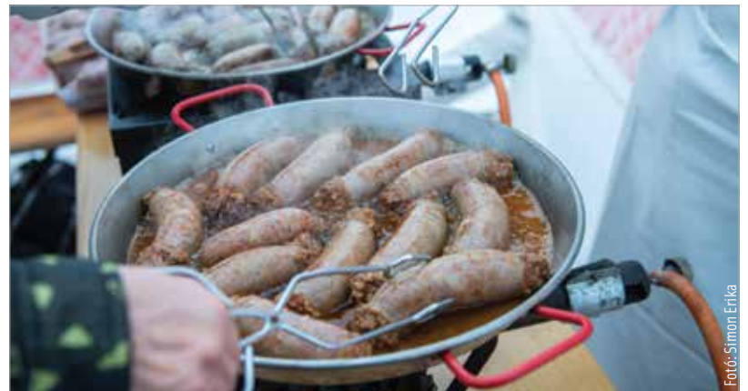
A hideg idő indokolta a kiadós falatokat!