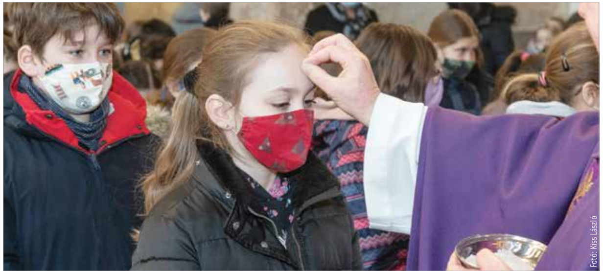
Hamvazószerdán az élet mulandóságára és a hitben megélt reményre emlékeztet a liturgia