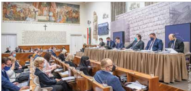
A rendkívüli ülésen döntés született az iskolafelújítási program folytatásáról is: öt általános iskolánál indították el a kivitelezésre vonatkozó közbeszerzési eljárást. A programon belül összesen tizenöt iskola vizesblokkját újítja fel az önkormányzat.

követően anafilaxiás rohamban meghalt. Az ilyen tragikus esetek elkerülésére Gyula példáját látva Székesfehérvár is az Epipen-injekciók beszerzése mellett döntött az oktatási-nevelési intézmények számára. Cser-Palkovics András polgármester elmondta: „Az elmúlt hetekben szakembereink az előkészítő munkát elvégezték. Ennek megfelelően nemcsak az iskolák és óvodák, hanem a bölcsődék is bekerültek a programba. Ez egy novum ebben a tárgykorban. Az injekciók használatának oktatását is megszervezzük, ez a mentőszolgálat és az önkormányzati intézmények közreműködésével fog megtörténni.”