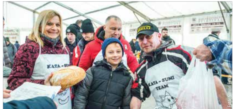
Hetedik alkalommal rendezték meg a múlt hétvégén a Kolbászoltó fesztivált a Jancsárkertben. A szakmai zsűri idén a Kata-Sumi Team kolbászát találta a legjobbnak.