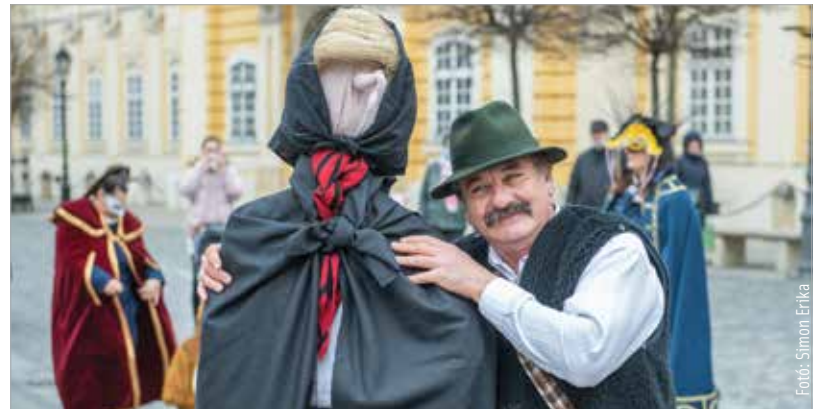
A banya, miután megjárta a Jancsárkertet, végigvonult a városban, hogy beteljesítse küldetését: el kellett vinnie minden rosszat, bűt, bajt, betegséget Fehérvárról. Reméljük, sikerült neki!