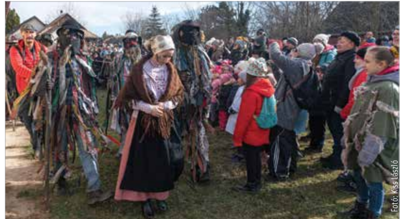
Kormos arcok, alakoskodó lányok, szalagos bohócok, szalmatorök és kéményseprő – idén is megrendezték az országban is egyedülálló télüző maskarás fesztivált, a mohai tikverózást, hogy megkaphassák a bőséget. A hagyomány szerint húshagyókedden a településen így búcsúztatják el a telet.