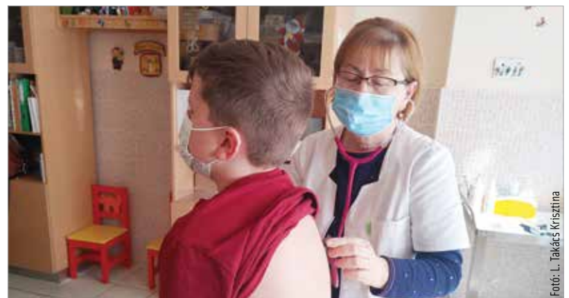
Ha néhány nap alatt nem enyhül a köhögés, érdemes orvoshoz fordulni, nehogy nagyobb baj legyen!

Általános tapasztalat az is, hogy amíg a koronavírus-fertőzést a szülők általában elkapják a gyerekektől, a jelenleg terjedő influenzavírusra ez nem jellemző.