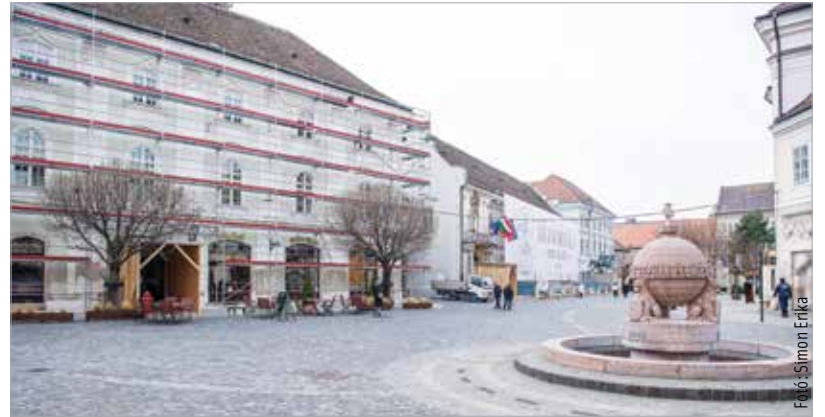
A kivitelezés az év végére készülhet el, ezzel a város főterének megújítása teljessé válik