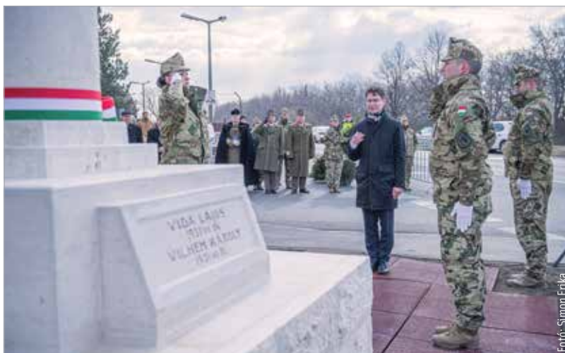
Az avatóünnepség koszorúzással ért véget

Az ünnepélyes avatáson Cser-Palkovics András halálját fejezte ki mindenkinek, aki segítette az emlékoszlop újbóli felállításának ügyét. A polgármester elmondta: az emlékmű azokban az időkben épült Székesfehérváron, amikor a város újra kezdte megélni korábbi történelmi nagyságát, és tudatosan vállalta azt. A polgármester beszédét követően Jákob János dandártábornok, a Tábori Lelkeszi Szolgálat protestáns püspöke és Alácsi Ervin alezredes, általános helynök közös imával avatta fel a repülőhalált halt bajtársak emlékművét.