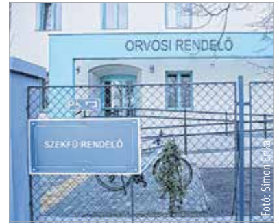
Kívül-belül teljesen megújul a Szeffű Gyula utcai rendelőintézet

Összesen tizenöt házi orvosi és fogorvosi rendelőt alakítottak ki a város egyik legnagyobb rendelőintézetében, mely több ezer, különböző városrészekben élő embert szolgál ki hétről