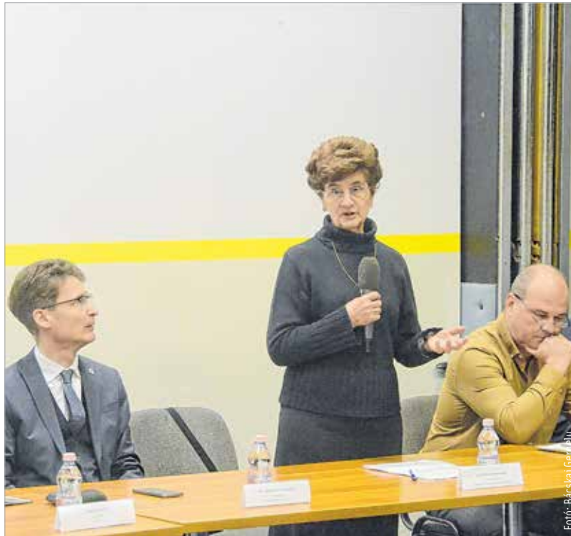
Megújulnak az utak, a járdák és a parkolók is Vízivárosban