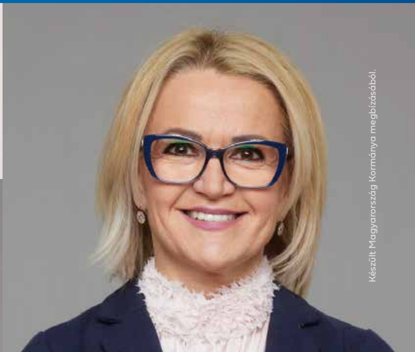
Készült Magyarország Kormányának megbízásából.