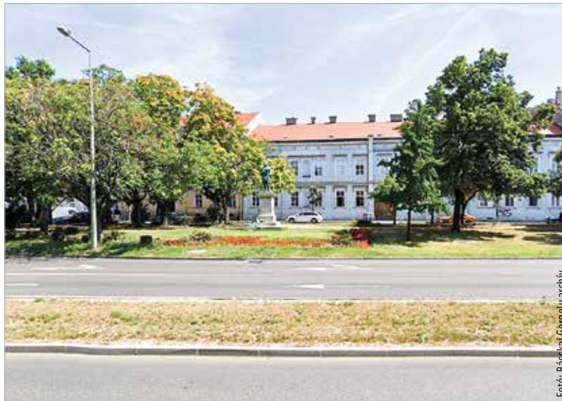
A park egész területét újrafüvesítik, és automata öntözőrendszert építenek ki

A park felújítása során a belső korhadástól rossz állapotban