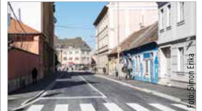
A közműveket is kicserélték, így remélhetőleg sokáig élvezhetjük az új útburkolatot!

A jelzett útszakaszt pénteken tehát ismét megnyitják a forgalom előtt, április 9-én, szombaton üzemkezdettől pedig a helyi és regionális járatok is újra az eredeti járatútvonalon közlekednek. Ez alól kivétel a 35-ös, a Vasútállomás irányába közlekedő 33-as, valamint a Fecskepart irányába közlekedő 34-es jelzésű autóbuszjárat, melyek továbbra is a Rákóczi út–József Attila utca–Deák Ferenc utca terelőútvonalon járnak, és a terelőútvonalon rendszeresített megállóhelyeken állnak meg. Kimaradó megállóhelyek: Zsuzsanna-forrás, Prohászka Ottokár út, valamint a Prohászka Ottokár-templom.