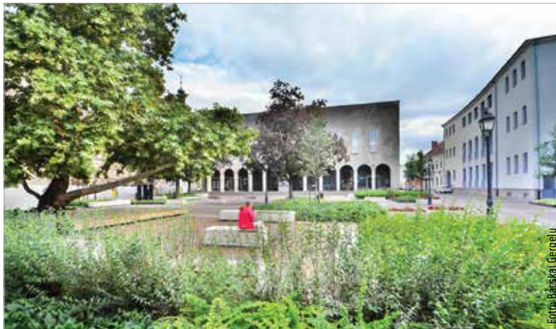
A munkák befejezése június végére várható. A lezárt területre érvényes behajtási engedélyeket a környező utcákban is elfogadják.

séges megjelenést ölthet, és igazi közösségi térként funkcionálhat. A burkolatépítéshez kapcsolódóan az Oskola utcában a forgalmi rend is megváltozott. A gépjármű-forgalom elől lezárásra került az Oskola utca Ady Endre utca és Szent János köz közötti, Bartók Béla térrel határolt szakasza. Az építési munkálatok időtartama alatt az Oskola utca az Ady Endre utca–Jókai utca–Városház tér útvonalon, a Hiemer-ház előtti útszakasz igénybevételeivel közelíthető meg, és hagyható el az ellenkező irányban.