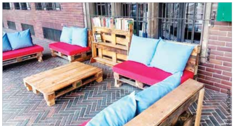
A hangulatos szellemi oázis nyitvatartási időben várja az olvasókat