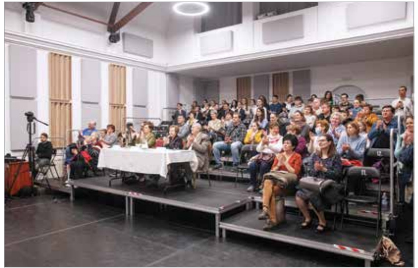
Megtelt a Táncház, a zsűri mellett meghatódott hozzátartozók hallgatták a szép dalokat

A hagyományoktól eltérően ebben az évben nem minősítették a kóru-