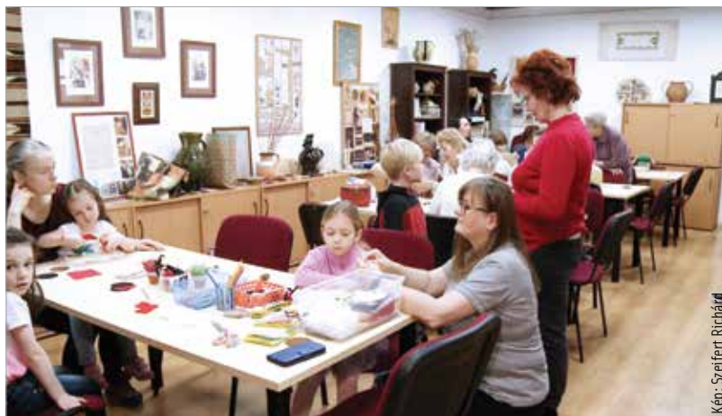
Kicsik és nagyok ismerhették meg a kézművesség rejtelmét

Ezen a napon az alkotóházak, műhelygalériák, nyitott műhelyek, kézművességgel foglalkozó egyesületek és közösségek helyszínei, műhelyei olyan egyedi programokkal jelentkeztek, melyekben a helyi területi népi kézművesség, a népművészet hagyományai és értékei, a népművészek alkotásai jelentek meg.