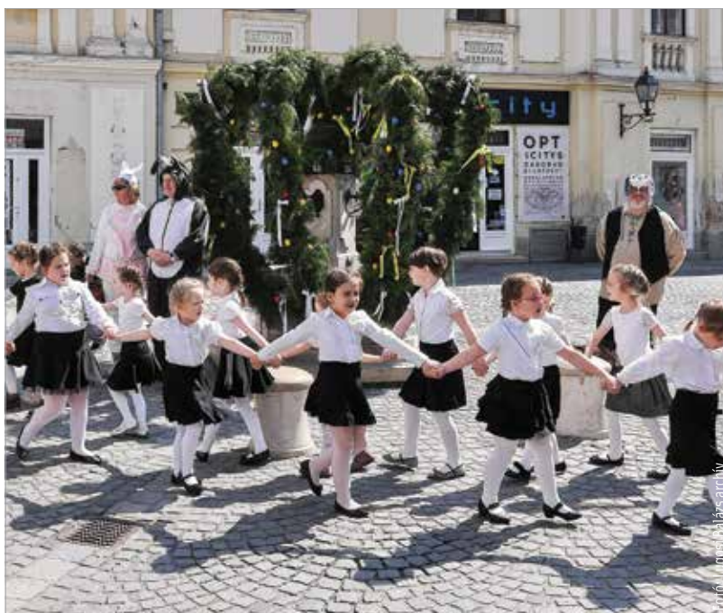
Három éve így avatták fel a kutat a belvárosban

ban ivókútként is szolgál. Szép hagyomány, hogy minden év tavaszán ünnepi díszbe öltöztetik a kutat. Így lesz ez idén is: a tojásfutó ünnepélyes átadására április tizenkettedikén, kedden délután fél kettőkor kerül sor. A műsorban felsővárosi óvodások szerepelnek, tekerőlanton közreműködik Varró János népzeneész.