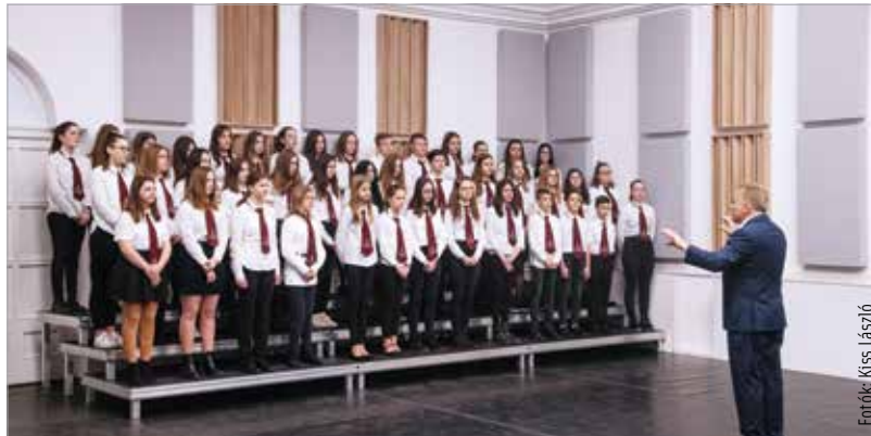
Közel ötszáz diák vett részt a hangversenyen

sokat, a neves szakemberekből álló zsűri csupán értékelte a fellépőket. Az Éneklő ifjúság az egyik legnagyobb hagyományú zenei rendezvény Magyarországon: a Magyar Kórusok, Zenekarok és Népzenei