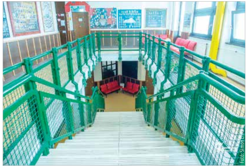
A város régóta várt arra a nagyszabású intézményfelújítási lehetőségre, mely a kormány döntésének köszönhetően most megvalósulhat

„A tavalyi kormánydöntésnek hála 19,1 milliárd forint értékben kezdetünk bele Fehérvár iskoláinak történelmi