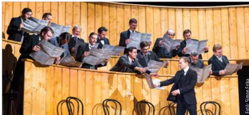
Április huszadikán Székesfehérváron, huszonhatodikán pedig a budapesti József Attila Színházban láthatjuk a Trianont. Mindkét előadás este hétkor kezdődik.

kontra. Hiszen nézőként valóban egy tárgyaláson vagyunk: van védő, ügyész, tanúk. És persze jelen vannak a nagy háború utáni világpolitika képviselői, akik a széljártástól függően hol erre, hol arra teszik le a voksukat. Az előadás nem ítél, nem ítélezik, nem dönt, nem akar befolyásolni, érzelmeket felkorpácsolni. Tényeket mutat be, párbeszédre sarkall egy olyan megosztó kérdésben, ami – ha tetszik, ha nem – a magyar történelem része marad.