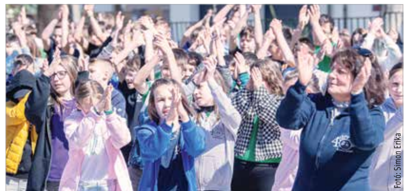
Az utóknak szóló üzenetekkel, zenés, mesés műsorral és közös énekkel, születésnapi tortával ünnepelték negyvenéves iskolájukat a Hétvezér diákjai, pedagógusai

Az ünnepélyes alkalom csúcspontját az időkapszula elhelyezése jelentette, amit a tervek szerint legkorábban 2052-ben, azaz harminc év múlva bonthatnak majd fel a következő generációk tagjai.