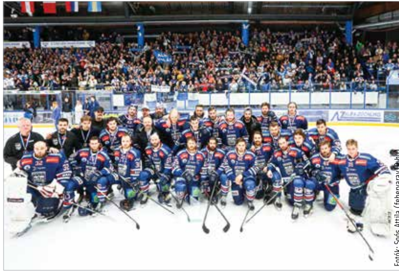
A döntő után az arcokon még kevés a mosoly, de a szurkolók tudják, hogy történelmet írt a csapat!

A Red Bull Salzburg ellen ugyanis valóban mindent kiadott magából az összes fehérvári hokis, és nemcsak az utolsó, hétfői meccsen. Az NHL-ben is elismert, hatalmas tapasztalattal rendelkező vezetőedző, Kevin Constantine is meghatottsággal a hangjában bizonygatta, hogy ezt a döntőt nem csalódként élte meg: „Nagyon boldog vagyok! Hogy