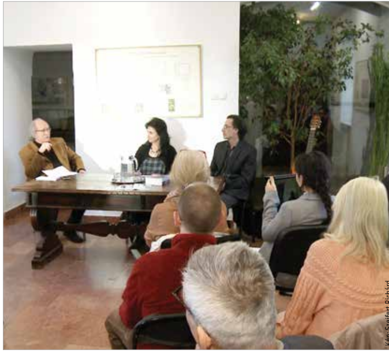
Telt ház fogadta az újraindult irodalmi-sorozatot a Királykúton