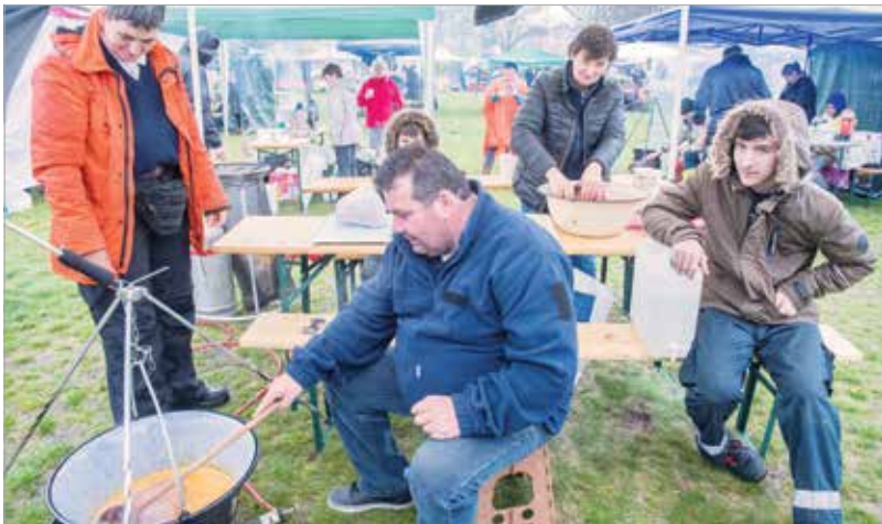
Az esős idő sem vette el a főzőcsapatok kedvét

pontyból, eredeti szegedi paprikából és bajai tésztából készült levesből idén is nagyon sokan falatozhattak.