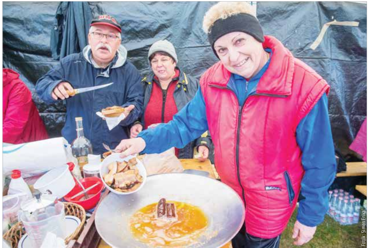
Hagyomány, tehetség, minőségi alapanyag és szeretet: ha ezek megvannak, biztos, hogy rendkívüli finomságok kerülnek ki a mesterek keze alól!