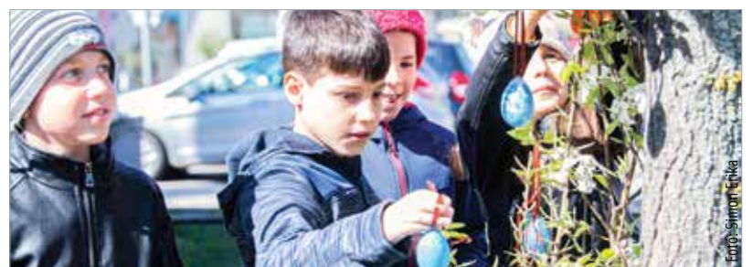
Nagy izgalommal készültek az elmúlt napokban a Kossuth iskola alsó tagozatos diákjai: kétszáznyolcvan egyedi húsvéti tojást festettek, amiket a Pozsonyi út mellett álló fákra helyeztek ki kedden délelőtt

Idén Öreghegyen is csatlakoztak a húsvétváró tojásfadiszítés kezdeményezéséhez: a Kossuth Lajos Általános Iskola alsó tagozatosai festették meg a tojásokat, amiket képvisletükben a 3. b osztályosok, illetve a Városgondnokság munkatársai helyeztek fel kedden délelőtt a Pozsonyi út melletti fákra.