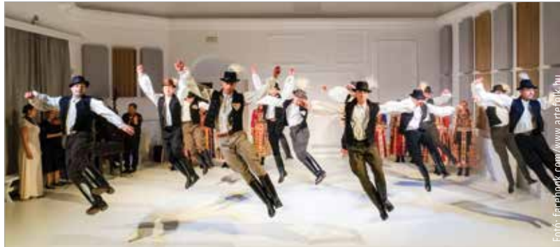
Húsvétvasárnap is várják a Táncházba a ropni vágyókat!