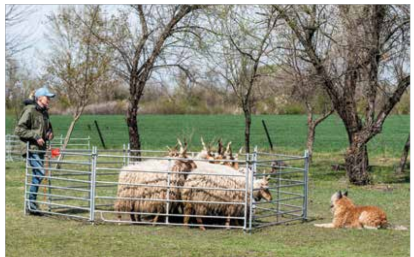
Végül mindenki a helyére került!