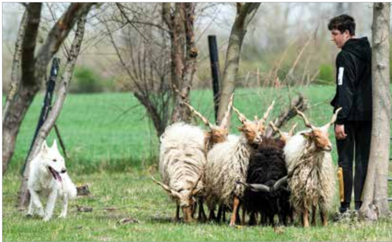
A siker titka a kutya és a pásztor közötti összhangban rejlik