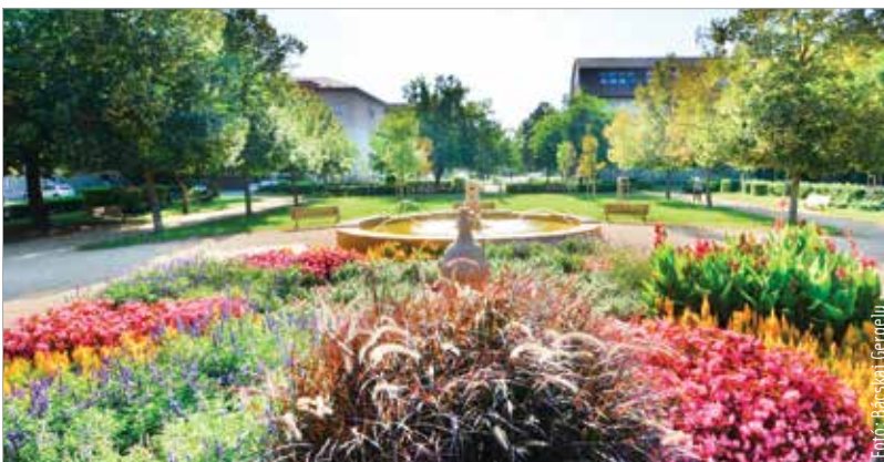
Egyre több a zölddel, virággal beültetett terület a városban

A szakember hozzátette, hogy nem lehet megmondani, milyen esélyekkel indul Székesfehérvár, hiszen egy ilyen megmérettetésnek nagyon sok összetevője van: nem csak a virágosításról szól, hiszen ez egy környezetvédelmi verseny, ahol fontos az is, hogy érzik magukat a település lakói.