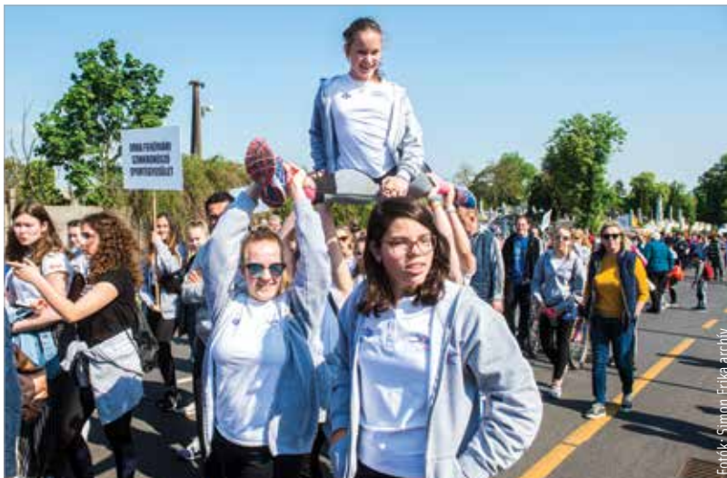
Három éve az eseményt nyitó felvonuláson több mint ötven sportegyesület vett részt, és közel kétezer sportoló vonult fel a Petőfi-szobortól a stadionig

Este pedig Király Viktor koncertjét, valamint Dj Kátai produkcióját láthatják-hallhatják majd az érdeklődők.