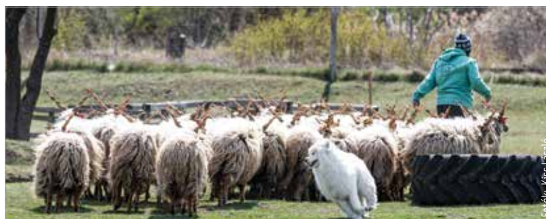
A látogatók a magyar fajták mellett találkozhattak tradicionális francia, belga és ausztrál terelőkutyaákkal

„A birkák ki vannak engedve, a kutyaáknak pedig különböző feladatokat kell teljesíteni: milyen irányba,