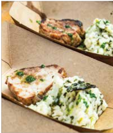
Medvehagyma felhasználásával készült rizottós szűzermét is kóstolhattak a látogatók

Sok színes program várta az érdeklődőket az első alkalommal megrendezett medvehagyma-fesztiválon a soponyai Ökoturisztikai Központban. A Vadex