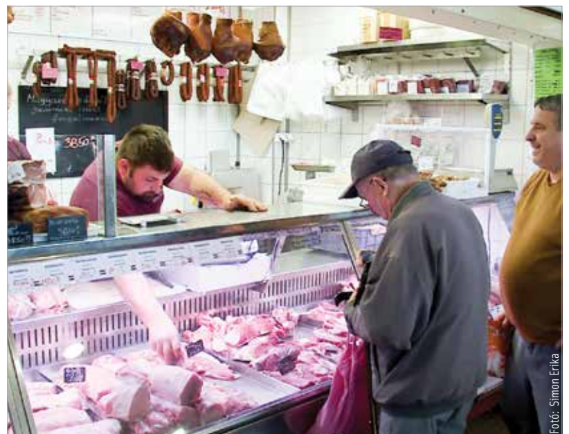
A mintavételek során kevés problémával szembesültek a szakemberek

szезonálisan népszerű termékek, valamint az azokat előállító és forgalmazó helyek álltak. A termékek közül a sonka, a tojás, a bor, a különféle édességek, valamint a szezonális zöldségek és gyümölcsök is górcső alá kerültek. Az érintett termékköröket és celterületeket előre nyilvánosságra hozták, az elsődleges cél ugyanis az volt, hogy az esetleges hibákat még az ellenőrzések előtt kijavítsák az érintettek.