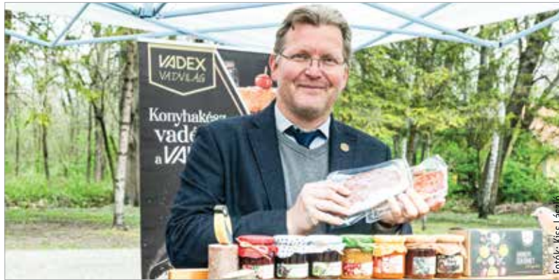
Számos gasztronómiai érdekesség került terítékre

Zrt. szervezésében megvalósuló programon a látogatók megismerhették a medvehagymát és felhasználási módjait, volt kutyás bemutató, vadászgörey-bemutató, gasztronómiai programok, a gyerekeket pedig bábszínház és erdei játszótér is várta.