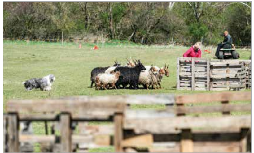
A rendezvény jó alkalom volt az ismerkedésre és a tapasztalatcserére

nagyon sokan vannak, akik felismerték, hogy a terelőkutya épp ez az ideális elfoglaltság.