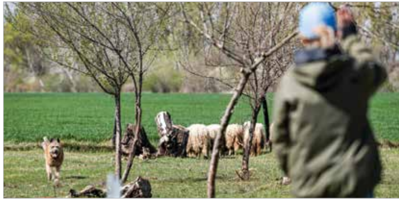
A terelési technikák országonként és kutyafajtánként is változnak. A Nyúl dűlői pályán sokféle megoldással, érdekes bemutatókkal találkozhattunk.

A mostani versenyt a tradicionális osztályba tartozó terelőkutya hirdették meg. Igyekeztek a feladatokat úgy összeállítani, hogy életszerű helyzeteket teremtsenek a párosoknak. Így a kutya meg-