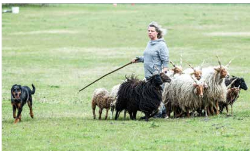
Nyolc országból ötvenegy kutya érkezett a terepversenyre