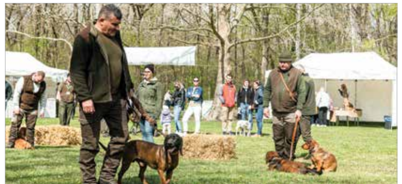
Kutyás bemutató is szórakoztatta a fesztivál közönségét

„Számos programmal készültünk: egyrészt szeretnénk megismertetni ezt a sokoldalú növényt, bemutatni, hogy mennyire sokféleképpen fel lehet használni a gasztronómiában. A gyerekeknek és a kisgyerekes családoknak kutyabemutatóval, változatos zenei programokkal és