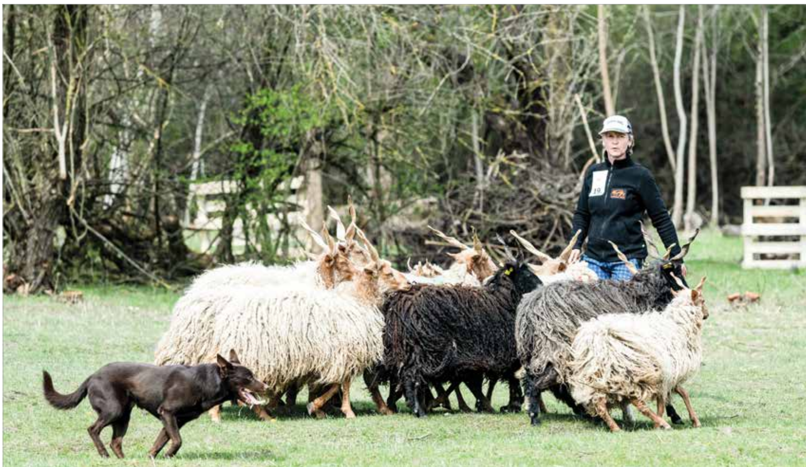
Közösen dolgozik a terelőkutya és gazdája a nyáj összetartásán

Magyarországon több mint száz éve rendeznek hasonló versenyeket. 1999-ben indult a terelősport, pár lelkes embernek köszönhetően pedig mára már