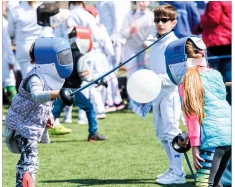
A sportegyesületeknek lehetőségük lesz egész napra kitelepülni és bemutatókat tartani a stadion körül, valamint a rendezvény színpadán, hogy a látogatók minél több sportággal ismerkedhessenek meg, a legnépszerűbbektől a legextrémebbekig

„Lesznek közös edzések olyan ismert sportolókkal, mint Katus At-