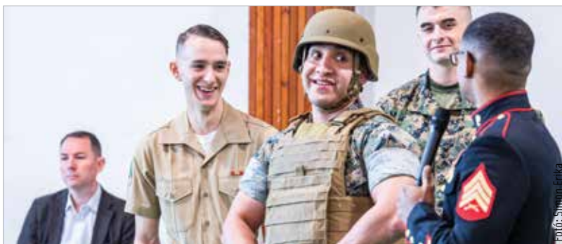
A tavaszi szünet előtti utolsó napon a diákok a nagykövetség munkatársaival és egymás társaságában tölthették el egy önélelt, vidám napot, ahol ugyan a szórakozásé volt a főszerep, de lehetőségük volt játszva tanulni is