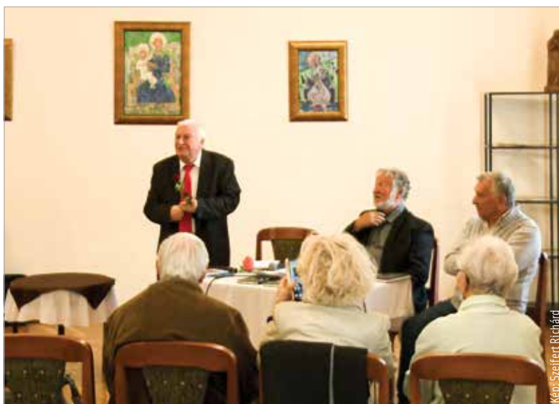
Balajthy Ferenc kivételes empátiával közelít az emberi sorsokhoz

szerető fehérváriakkal együtt. Balajthy Ferenc, a mindig mosolygós költő úgy fogalmazott: számára a sors adta tehetség mellett a mindennapok is ihletet nyújtanak. Verseiben ezért is találhatjuk meg a mindenség eredőjét, örömet, bánatot, vagyis mindazt, ami az embert emberré teszi. Balajthy Ferenc a kötetet gondolatébresztő sorokkal zárja. Kányádi Sándort idézve, illetve őt kiegészítve úgy fogalmaz: „A verset írni, mondani és szeretni kell!”