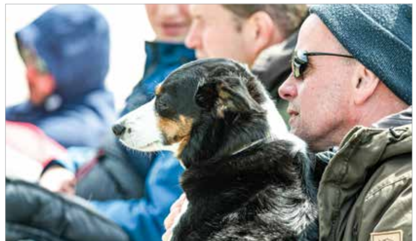
Kutya és ember a nézőtérén is összhangban