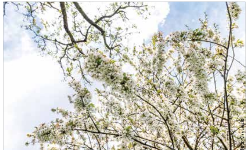
A virágok már készen állnak!

hiszen komoly feltételeknek kell megfelelniük a versenyen induló településeknek. Gyönyörű városokkal kell versenyeznie Székesfehérvárnak, ahol szintén magas szinten művelik a zöldterületek gondozását, de a Városgondnokság kertészcsapata maximálisan felkészült – a kiválasztott helyszínnek is bizonyítják ezt: „Június huszonegyedikén kerül sor az Entente Florale Europe verseny bejáráására. Jelenleg zajlik a