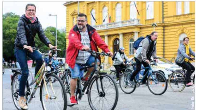
Szombaton délután négykor indul a kerékpárosok felvonulása

felvonulás célja felhívni a figyelmet a kerékpárutak fontosságára. Szeretnék elérni, hogy készítsenek átvezetést a Prohászka Ottokár út és a Horvát István utca, valamint a Horvát István utca és a Deák Ferenc utca kereszteződésében, valamint hogy adjanak teret a hivatalok annak, hogy az úttesten, járműként szabályosan, biztonságosan vehessenek részt a forgalomban a kerékpárosok is. Csökkenjenek városunk úthálózatán az olyan szakaszok, amelyeknél ma a kerékpáros közlekedés számára használható alternatíva nélkül szűnik meg a kapcsolat egy-egy kerékpározható hálózati elem között. A felhívásban kiemelték: értékelik, hogy a városban évek óta a hálózatosítás mentén folynak a fejlesztések, és ezen szakaszok néhány év múlva kerékpározhatók lesznek, és összekötik majd a fő kerékpáros tengelyeket.