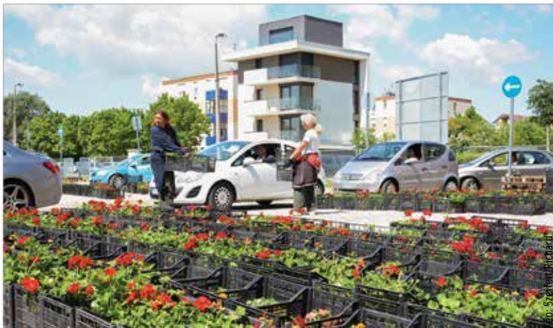
Idén minden eddiginél több, közel tízezer pályázat érkezett a Városgondnoksághoz

ták a csomagtartóba a virágokat. Sokan minden alkalommal élnek a lehetőséggel. Idén is rekordszámú, közel tízezer pályázat érkezett a Virágos Székesfehérvár programra, melynek keretében közel háromszázezer növényt, köztük muskátlit, napvirágot, büdöskét, begóniát, pistikét, továbbá hétszáz komposztládát is kiosztottak. Az önkormányzat több mint tíz éve rendezi meg az országosan is egyedülálló akciót, a cél pedig nem más, mint szebbé, gondozottabbá, színesebbé tenni Székesfehérvárt!