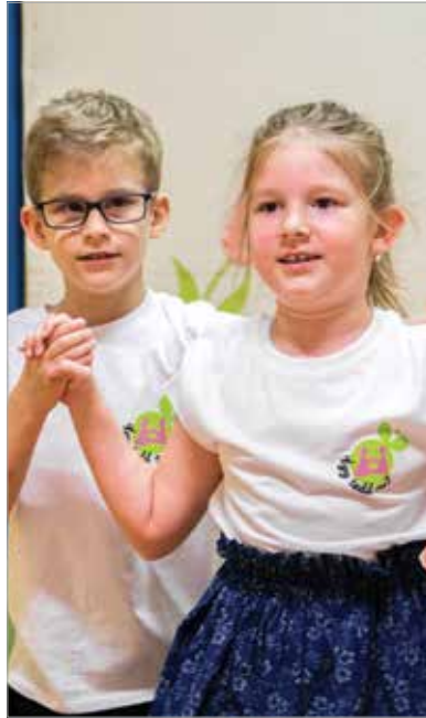
Az ünnepség fényét az óvodások néptánc-előadása emelte