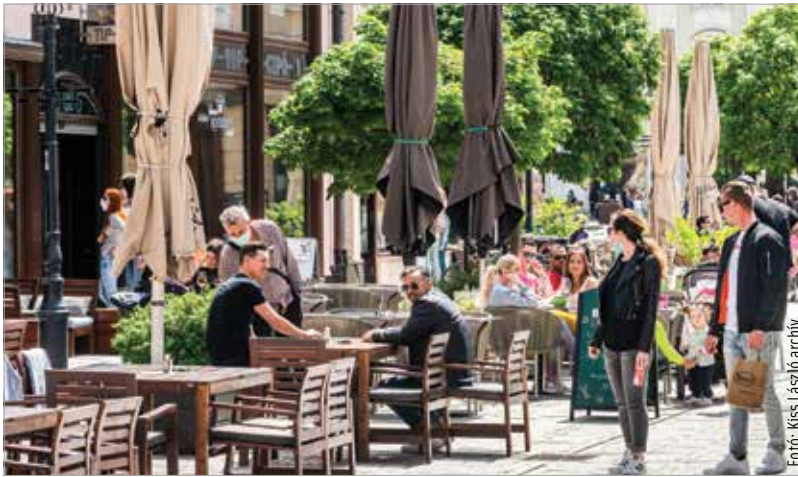
A teraszdíj elengedésének célja, hogy az önkormányzat segítse a vendéglátósokat anyagi helyzetük stabilizálásában

„Tekintettel arra, hogy az elmúlt két év járvány okozta gazdasági nehézségeinek többek között a vendéglátós szektor volt leginkább kitéve, szeretnénk segíteni e terület vállalkozóinak és munkavállalóinak teljes, tartós talpra állását.” – fogalmazott Cser-Palkovics András a közösségi oldalán megjelent bejegyzésében. A polgármester kifejtette, hogy 2022-ben is elengedi az önkormányzat a teraszdíjakat, abban a reményben, hogy a vendéglátósok számára ez segítség lesz az anyagi helyzetük stabilizálásában. – „Vendéglátóhelyek nélkül nincs turizmus, nincs élet a városban, tehát ez nemcsak gazdaságvédelmi, hanem stratégiai intézkedés is. Székesfehérvárnak és a fehérváriaknak szüksége van a vendéglátósokra!”