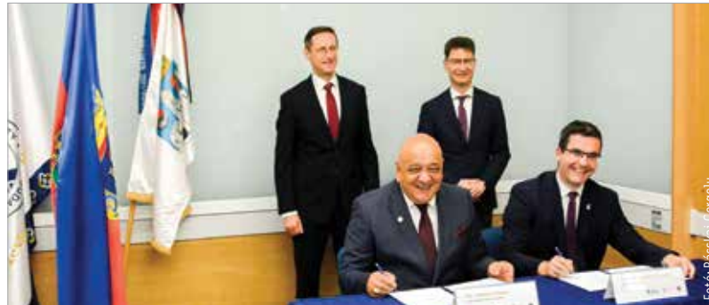
Székesfehérvár polgármestere a fehérvári felsőoktatás mérföldkövének nevezte a megállapodást

„Az elmúlt években a mi ajánlatunkkal sajnos nem tudtunk kiaknázni ekkora potenciált. Ezt a campust eredetileg hatszáz diákra terveztük, ezért egy nagyon önzetlen kérdést tehetünk fel magunknak: háromszáz diákkal valóban mi vagyunk ennek a campusnak a jó gazdája?” – a Budapesti Corvinus Egyetem elnöke, Anthony Radev ezekkel a szavakkal indokolta a szándéknyilatkozat aláírását az Óbudai Egyetemmel. Közösen nézik most át az oktatási tevékenységet, a képzéseket, és kidolgozzák a két egyetem és a város számára a legelőnyösebb együttműködési modellt. Ami biztos, hogy erős elméleti alapokon nyugvó, gyakorlat-orientált képzés lesz a campuson – az