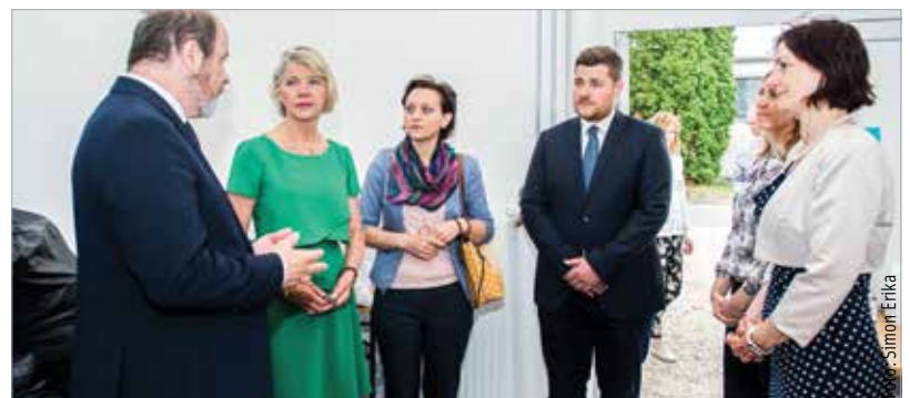
A nagykövet asszony az Alba Bástya Család- és Gyermejkölési Központba is ellátogatott

megszületett, hiszen fehérváriak is részt vesznek majd azon a tanulmányúton, melynek témája a holland kerékpáros infrastruktúra lesz. Így nem elképzelhetetlen, hogy holland mintára történjen majd a városban a jövőbeli fejlesztések. Ahogy Cser-Palkovics András fogalmazott: „Ebben a tekintetben Hollandia előttünk jár, de látszik az is, hogy Fehérváron is nő a kerékpárral közlekedők száma. Fel is hívták a figyelmünket, hogy az egyes szinteket elérve előjönnek problémák, amiket az ő tapasztalataikat figyelembe véve mi még elkerülhetünk, úgyhogy ez egy nagyon izgalmas együttműködési lehetőség!” A nagykövet asszony az Alba Bástya Család- és Gyermejkölési Központban is látogatást tett. Mint mondta, nagyon megható volt azt látni, mennyi segítőszándék van jelen Székesfehérváron, és milyen professzionálisan kezelik a kialakult helyzeteket.