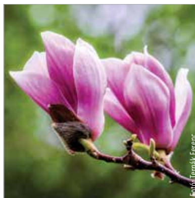
A magnólia a liliumfafélékhez tartozik. Tévesen tulipánfának is hívják, de az egy teljesen más növény, csak hasonlítanak egymáshoz.

Kontinensünkre a XVII. század második felében érkezett a liliumfa az angol misszionáriusok jóvoltából. John Banister 1688-ban küldte el a Magnolia virginiana töveit Virginiából Londonba. Ezt követte 1720-ban a Magnolia grandiflora, majd az ázsiai fajok. A Magnolia denudata volt az első mérsékelt övi ázsiai faj, ezt 1789-ben hozta be Joseph Banks. Ezt követte a piros változat (Magnolia liliiflora) 1790-ben. E kettő hibridje lett a nagyvirágú magnólia, amit 1820-ban kezdtek terjeszteni Franciaországban. A nemzetközi kereskedelemben 1852 után került be a növény – amerikai közvetítéssel. Magyarországra Eszterházy Miklós hozta be a XVIII. század végén. A herceg kismartoni parkját szerette volna színesíteni vele. Később a Kámoni Arborétumban is több példányt elültetett Saághy István.