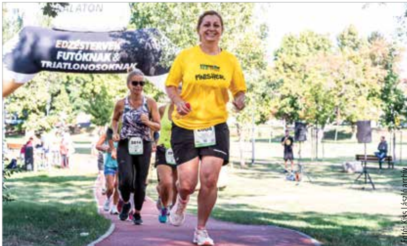
Tavaly szeptemberben rendezték meg először az eseményt

futópályáján zajlik majd a Futókörök napja szombaton, május huszonegyedikén. Akárcsak tavaly, idén is reggel kilenc és délután öt között csatlakozhat bárki a rendezvényhez a fehérvári Halesz-parkban. A nevezés ingyenes, és mindenki annyit fut, amennyit szeretne, hozzájárulva a város összteljesítményéhez. A három legtöbb kilométert gyűjtő település ugyanis díjat kap, amit jótékony célra kell felajánlania. De az egy helyszínen legtöbbet futó indulókat egyénileg is díjazták, az első három sporteszközutalványt kap.