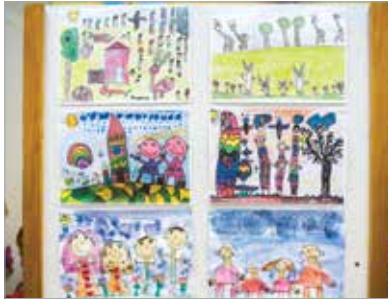
A pályázatra összesen hatvannyolc alkotás érkezett, tizenegy gyermek kapott díjat

Az Árpád Úti Óvoda Vízivárosi Tagóvodájában kedden délután köszöntötték azt a tizenegy óvodást, akik sok társukkal együtt neveztek a Családom című rajzpályázatra. A gyerekek számos rajz- és festőtechnika segítségével alkották meg a saját családjukról készült képeket.