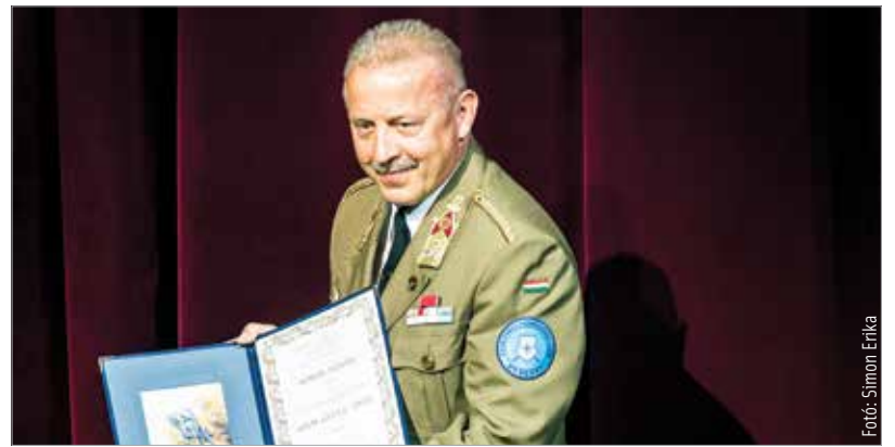
Gálaesttel ünnepelt szerda este a „katonaváros”, ahol átadták az idei Sipo Gyula-díjat is. A 2022-es év díjazottja Topor István ezredes, a magyarországi NATO-erőket Integráló Elem parancsnoka lett.