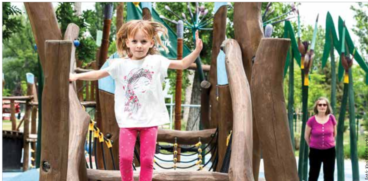
Már csak egy hónap, és kitör a vakáció!

Már csak egy hónap van az iskolai nyári szünet kezdetéig, ilyenkor hatalmas a tumultus a jelentkezéseknél. Azonfelül, hogy a legjobb ár-érték arányú turnusok nagyon gyorsan betelnek, az előbb említett árnövekedés folytatódhat, azaz nem garantálható, hogy egy vakációs program ma