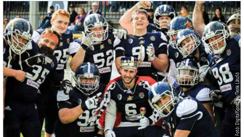
Itthon már sokszor ünnepelhettek, most még magasabbra törnek a Koronázók