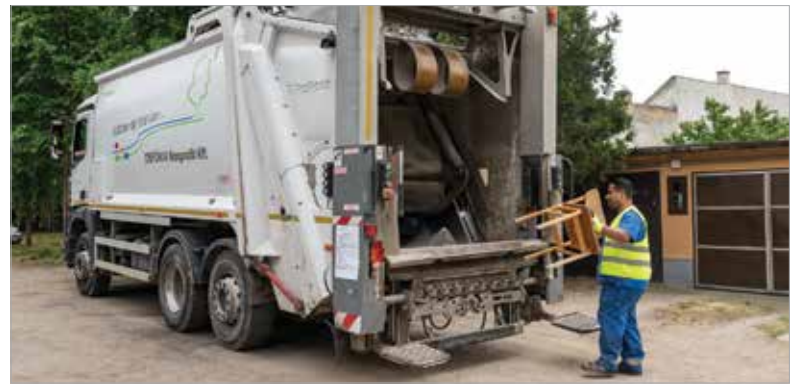
Hétfőn az Almássy-telepen parkolt a Depónia hulladékszállító autója, ide hozhatták a környéken lakók a lomtalanításra szánt hulladékot

„Mindenki tudja, hogy Székesfehérváron, a tömbházas övezetekben a lomtalanítás alkalmával milyen kaotikus és rendezetlen állapotok szoktak