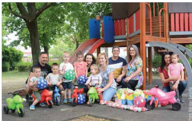
Ki tudna ellenállni egy színes kismotornak vagy labdának?

A városrész önkormányzati képviselője szerint a kisgyermek-