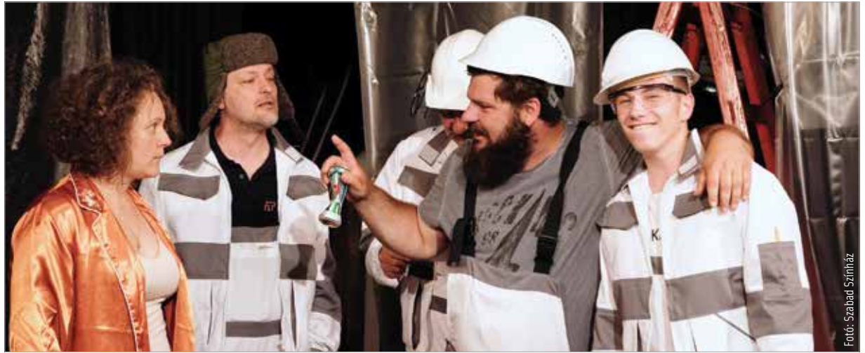
A mesteremberek legközelebb június elsején, szerdán este hétkor lépnek színre az Igézőben

A szomorú az, hogy egy percig sem érezzük az előadást fikciónak. Gyakorlatilag nyakig benne vagyunk a történetben, szinte már az első jelenettől kezdve. Szórakozásunkat a ráismerés is garantálja: az Igéző nézőterén abban a másfél órában csupa saját moziját néző embert láttam. Akik ha tán nem is felhőtlenül, de jókat kacagtak azon a rémálmon,