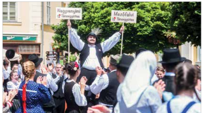
Az énekszó visszafelé még erősebb lett, de kellett is energia, hiszen a délutáni bemutatózó-programok és az esti táncház kívánt még némi spirituszt. A találkozó a csoportok előadásaival folytatódott a szárazréti szabadtéri színpadon.