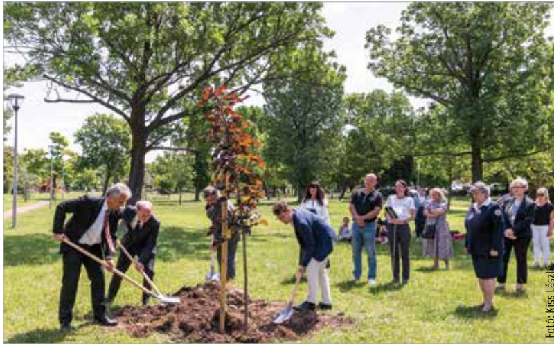
Az idei év jelmondatai: „A véradás a szolidaritás jele. Csatlakozz a véradókhoz, és ments életet!” A Haleszban elültetett fa az önzetlenséget és az élethez szükséges segítségnyújtást jelképezi.

figyelmet a véradás és a biztonságos, ellenőrzött vérkészítmények fontosságára, és köszönetet mondanak az önzetlen segítőknek. A Magyar Vöröskereszt hagyományteremtő szándékkal 2020-ban indította el a Véradók fája kezdeményezést, akkor Budapesten, a Szabadság téren, 2021-ben pedig Esztergomban ültettek el egy oszlopos vérjuhart, amely a véradást jelképezi. Idén a Magyar Vöröskereszt Fejér Megyei Szervezete ültethetett el egy fát Székesfehérváron, a Haleszban.