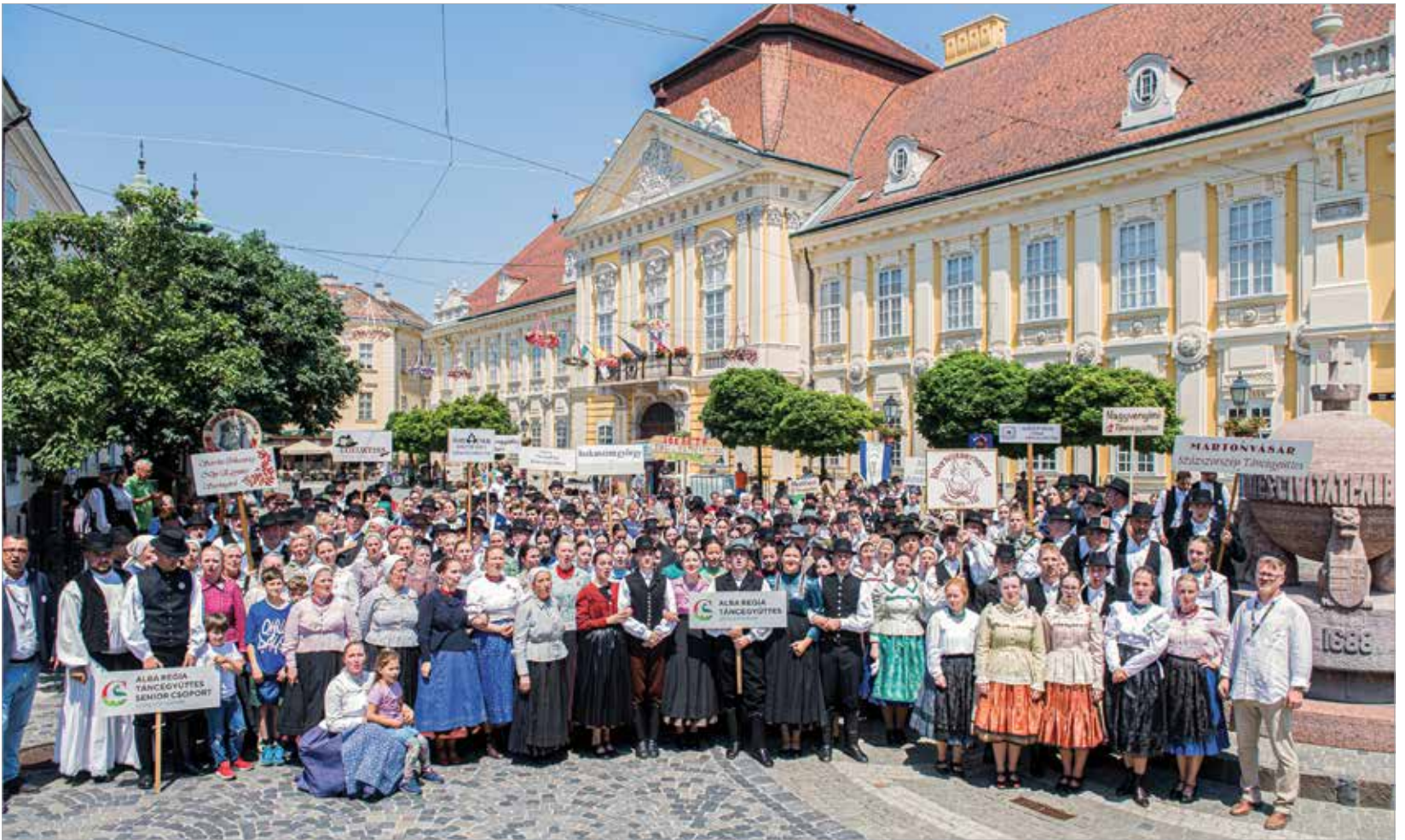
Féjér megyéből huszonek néptáncsoprot érkezett, köztük görög és német nemzetiségi hagyományőrzők is