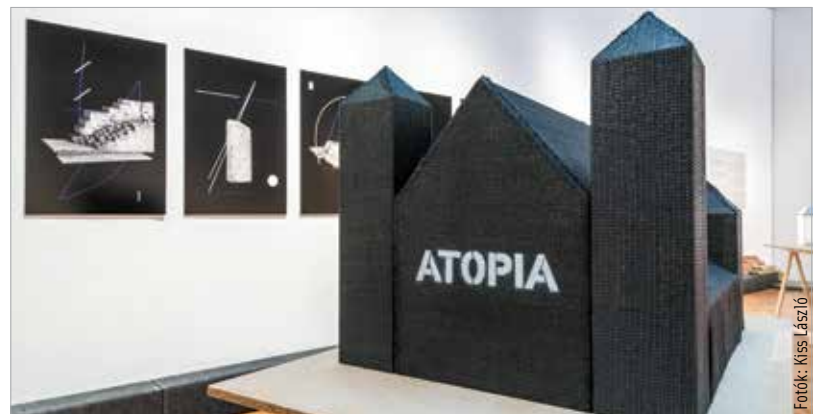
Az alkotók célja, hogy a város különböző térbeli és időbeli rétegein haladva végül önmagához jusson el a szemlélő