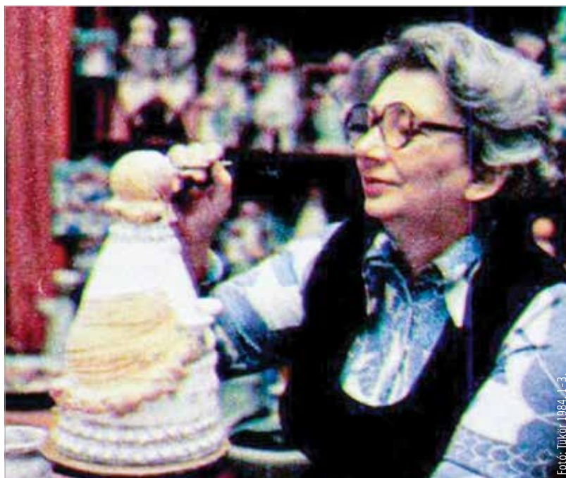
A keramikus művész alkotás közben