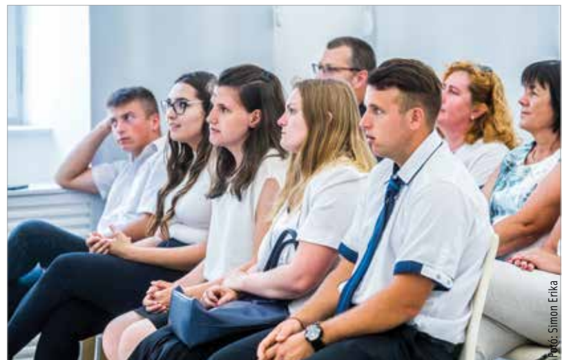
Itt a tanév vége, nemsokára kitor a nyári szünet! Sok diák számára ez a kiérdemelt elismerések bezsebelésének időszakát is jelenti.

„Emögött a munka mögött, amit a fiatalok elvégeztek, szorgalom, lemondás és sok erőfeszítés áll. Tanulmányi sikerük azonban bizonyára örömet is szerez nekik!” – mondta el lapunknak Cser-Palkovics András polgármester.