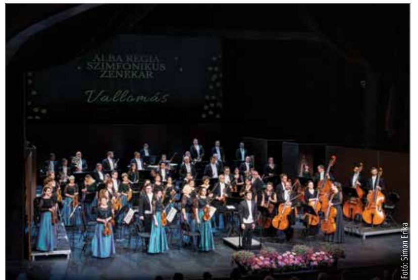
Kivételes előadást láthatott a közönség

A zenekar az évad lezárásaként, egyben a nyári zenei programok nyitányaként június 24-én 19 órakor egy olasz este várja vendégeit a Csónakázó-tó szigetén felállított szabadtéri színpadhoz. Az Itáliát idéző, festői helyszínen megrendendő hangverseny műsorán az olasz operazene nagymestereinek muzikája csendül fel.