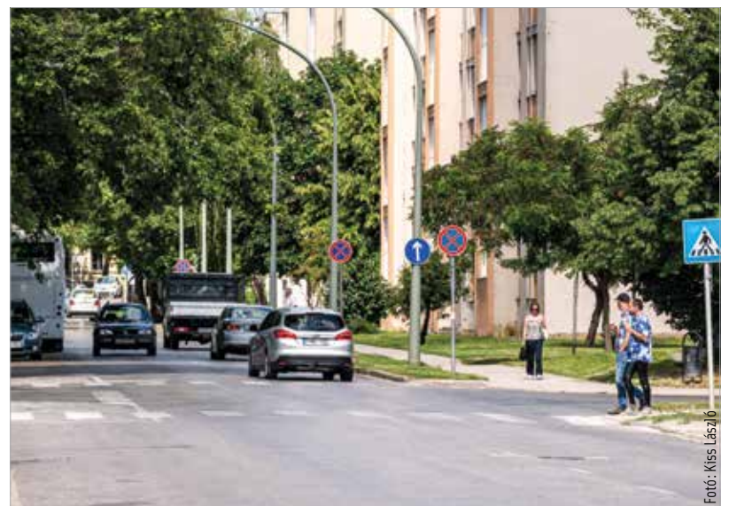
A gyalogosok biztonsága legalább annyira múlik önmagukon, mint a közlekedés többi résztvevőjén!