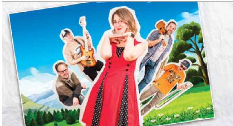
A Pitypang zenekar

Nagyon jó, ha része lesz a zenélés az életüknek, de ha hobbiszinten játszanak, az is bőven elég. Lilla inkább a festés, rajzolás, alkotás iránt érdeklődik, a pici viszont háromévesen annyira muzikális, hogy teljes dalokat visszaénekel. Szeretjük a zenét mindketten, de hogy milyen szerepe lesz az életükben, arról majd ők döntenek. Remélem, hogy a Pitypang zenekar meghatározó nyomot hagy majd az életükben, mert ha rajtam múlik, Halász Judit-hoz hasonlóan évtizedek múlva is színpadon szeretnék állni!