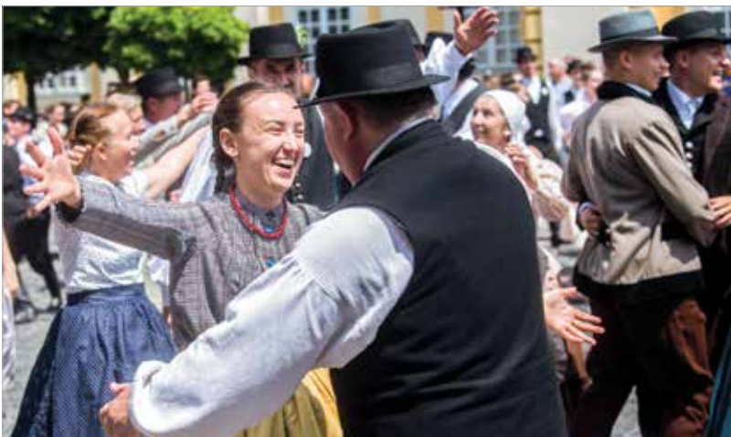
A táncosok mindegyike felemelő érzéssel nyilatkozott a közös produkcióról. Egy ilyen nagy találkozó mindig megerősíti, hogy érdemes hagyományőrzésre áldozni a szabadidőt!