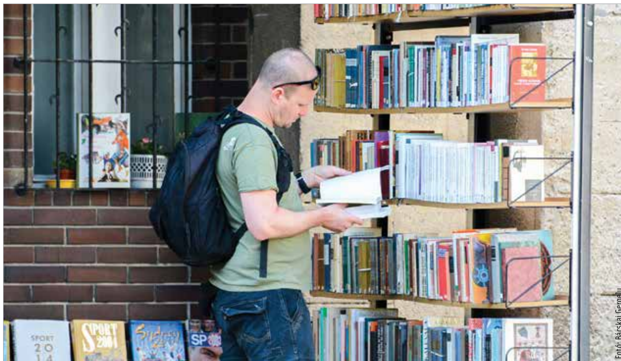
A könyvtárak és a levéltárak is kitelepültek az ünnepre