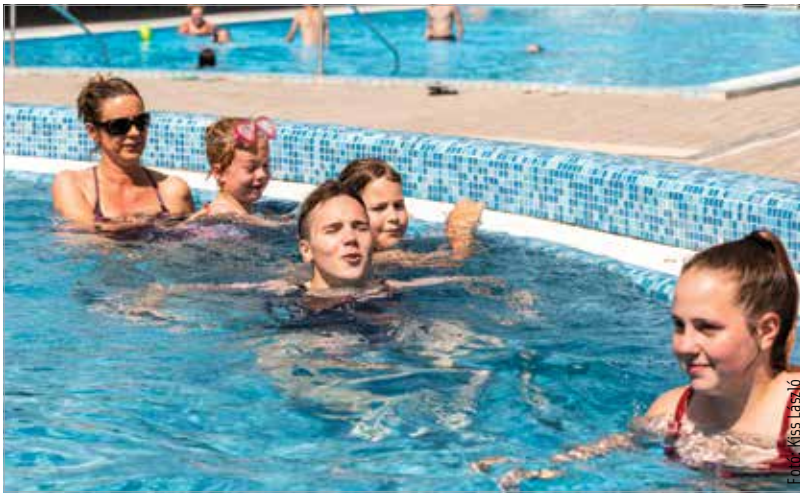
A strand nyitónapja igazi nyári időben telt

A csúszda reggel kilenc és este hat között üzemel, használatáért továbbra sem kell külön fizetni. A létesítmény nagyon jó műszaki állapotban várja a vendégeket, ugyanis 2018-ban a strand felújítását és bővítését végezhette el a város önerőből, tavaly pedig a nagymedencét építették újjá a Városgondnokság szakemberei. A délutáni kedvezmény is változatlanul marad az idei nyáron: négy óra után minden típusú belépőt féláron biztosít a strandot üzemeltető Városgondnokság.