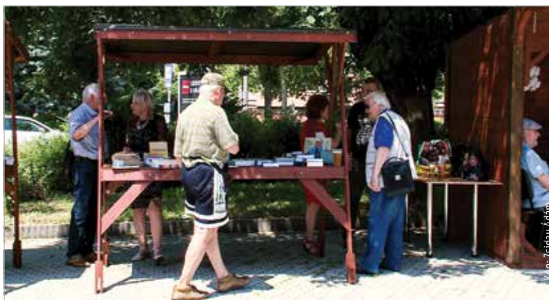
Szerzők, vásárlók és könyvek. Ilyen volt a Könyvheti piknik.

a Vörösmarty Társaság lírikusai és írói mindent megtesznek ezért: című új kötetét volt hivatott az olvasók figyelmébe ajánlani.