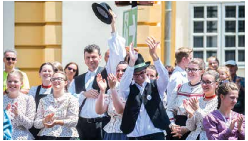
A látványos ösztánc után bemutatták a táncsoprotokat, ekkor repültek fel a kalapok