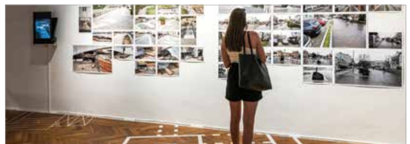
A közös munka a várossal 2020 őszén indult, és az elmúlt másfél évben folyamatos ismerkedéssel, kutatással, alkotással telt. Ennek eredménye látható most a képtárban.