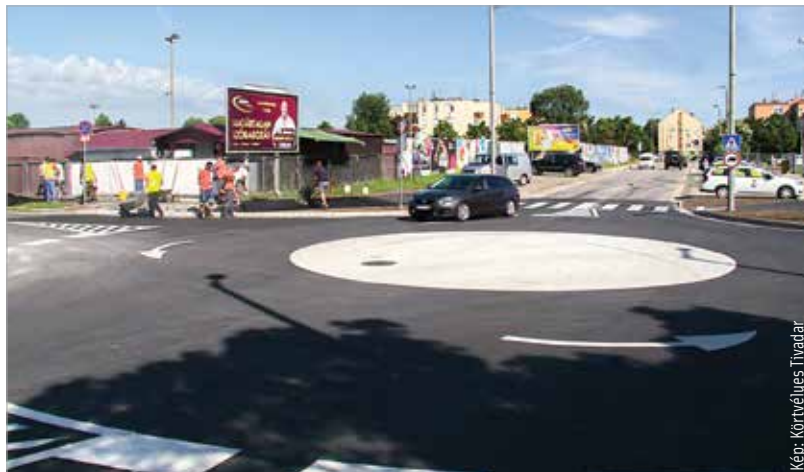
Az új körforgalom a palotavárosi autósok és gyalogosok biztonságos közlekedését segíti

A forgalom csökkentésére az igazi megoldás azonban az a tervezett átkötőút lehet, mely a Palotaváros déli részét kötné össze a feketetehegy-szárazréti városrészrel. Ezzel nagy tehertől szabadulna meg Székesfehérvár legnagyobb lakótelepe.