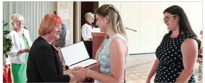
Az ünnepség keretében átadták a Kiváló Védőnő díjakat, melyet idén heten vehettek át a megyéből kiemelkedő szakmai munkájuk elismeréseként