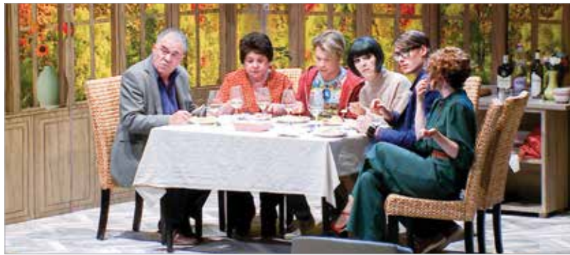
A közös étkezésnél is a tévé van a középpontban

közös produkciója egy kispolgári család önmagához való viszonyrendszereiről ad pontos képet.