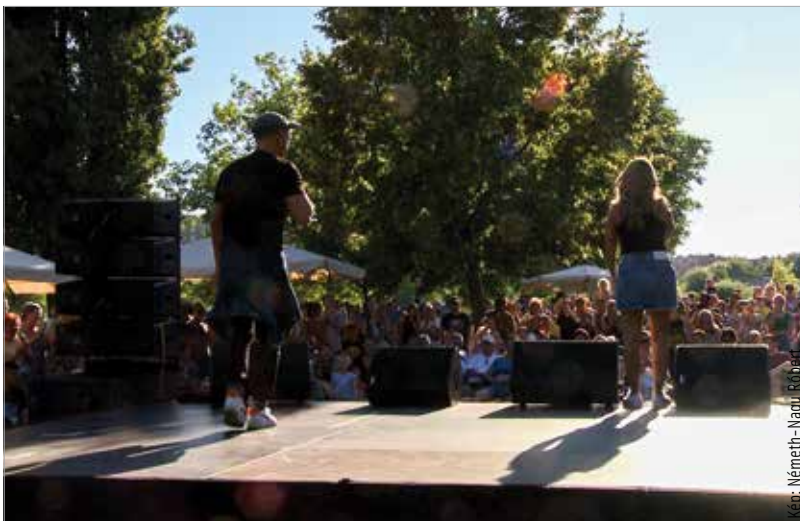
A pikniket a Groovehouse együttes fellépése koronázta meg