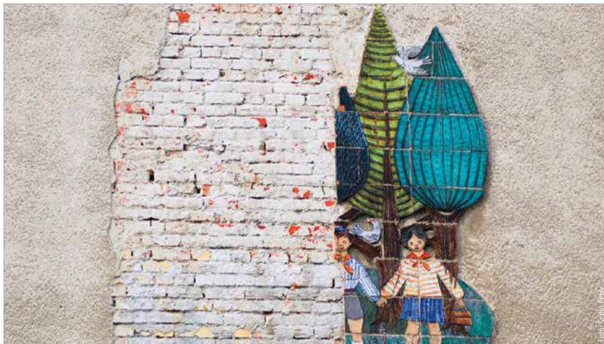
Tizenegy éve ennyi még megvolt az alkotásból, mára azonban teljesen eltűnt