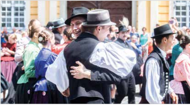
A közös tánc koreográfiját már hetekkel korábban mindenki megkapta, de együtt, négyszázan csak a fesztiválon táncolták el