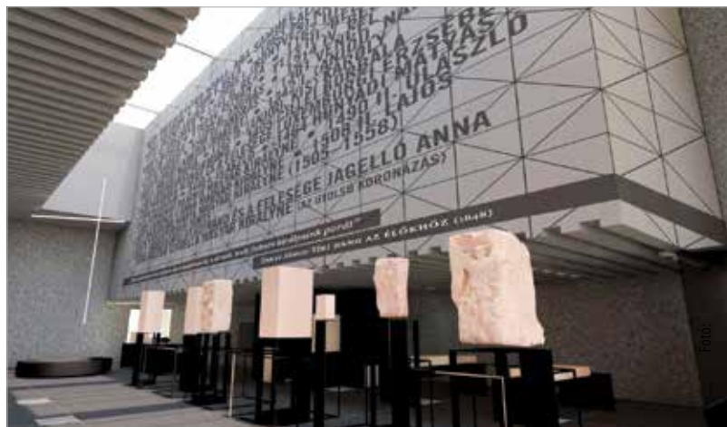
Modern, változó belmagasságú, különleges megvilágítású kiállítóteret hoznak létre, ahol a látvány mellett a koronázóváros történelmi nagyjait is bemutatják

A beruházás célja egy olyan kulturális és információs pont kialakítása, mely a székesfehérvári Nemzeti Emlékhelyhez kapcsolódva bemutatja annak történelmi, társadalmi, földrajzi és építészeti jelentőségét, továbbá megfelelő munkakörülményeket biztosít a történészek, régészek,