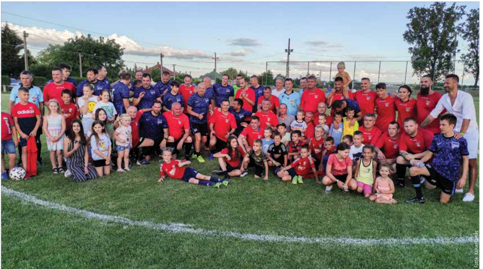
Ez egy olyan mérkőzés, melynek végén mindenki boldog!