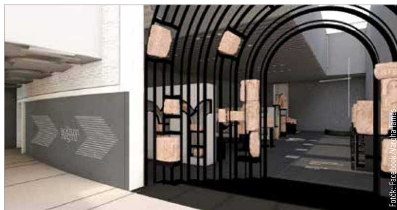
A megmaradt kövek segítségével rekonstruálják az épületrészleteket

detiliek hadtestparancsnokságnak épült 1937-ben – vagy a Zichy liget sarkán a Magyar Nemzeti Bank székesfehérvári fiókja, vagy az egykori bérház, mely ma a Magyar Külkereskedelmi Banknak ad