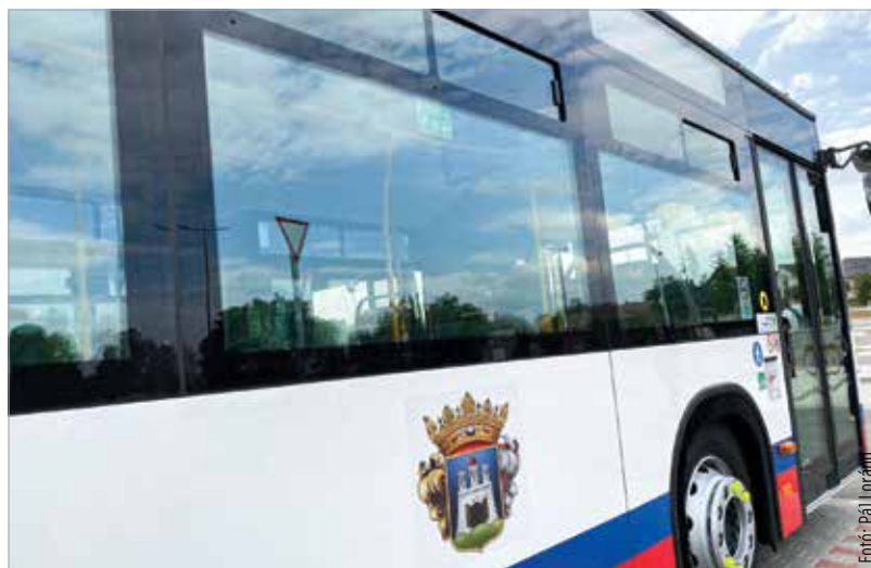
Minden eddiginél több diákbérletet adtak el – a cél, hogy minél többen válasszák a városi közösségi közlekedést, így tovább csökkenne az utak terhelése a csúcsidőszakokban