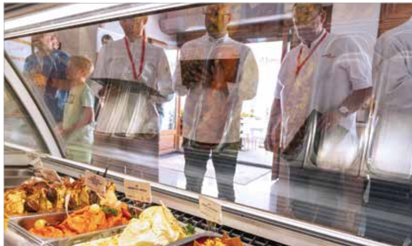
A székesfehérvári Krém cukrászda Krémkaramell elnevezésű fagylaltja is az országos döntőbe jutott