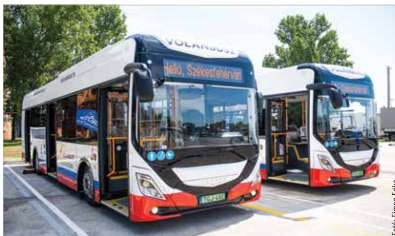
Szeptember végétől már tizenkét elektromos autóbussz és a szükséges töltők emelik a városi közösségi közlekedés színvonalát

Érzelem és hagyomány összekapcsolódik, hiszen Székesfehérváron helyben gyártott Ikarus buszokat adunk át, melyek mostantól a környezetbarát közösségi közlekedést szolgálják – emelte ki Székesfehérvár polgármestere