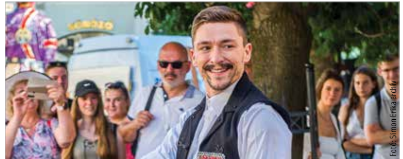
Visszatér a járvány előtt tapasztalt nyüzsgés a belvárosba: kulturális és közművelődési intézmények sokasága kapcsolódik be a programokba

Az óriásbábok és a hagyományőrzők alkotta menet minden szombaton 17 órakor indul a Vörösmarty Színháztól, a bemutatók a Varkocs-szobornál, a Mátyas király-emlékműnél és a Városház téren, az Országalmánál lesznek. Az aláfestő zenét régizenei együttesek szolgáltatják, az óriásbábokat kikiáltók mutatják be a nézőknek. A Zichy ligetben 18 órakor kezdődnek a koncertek a Zenepavilonban.