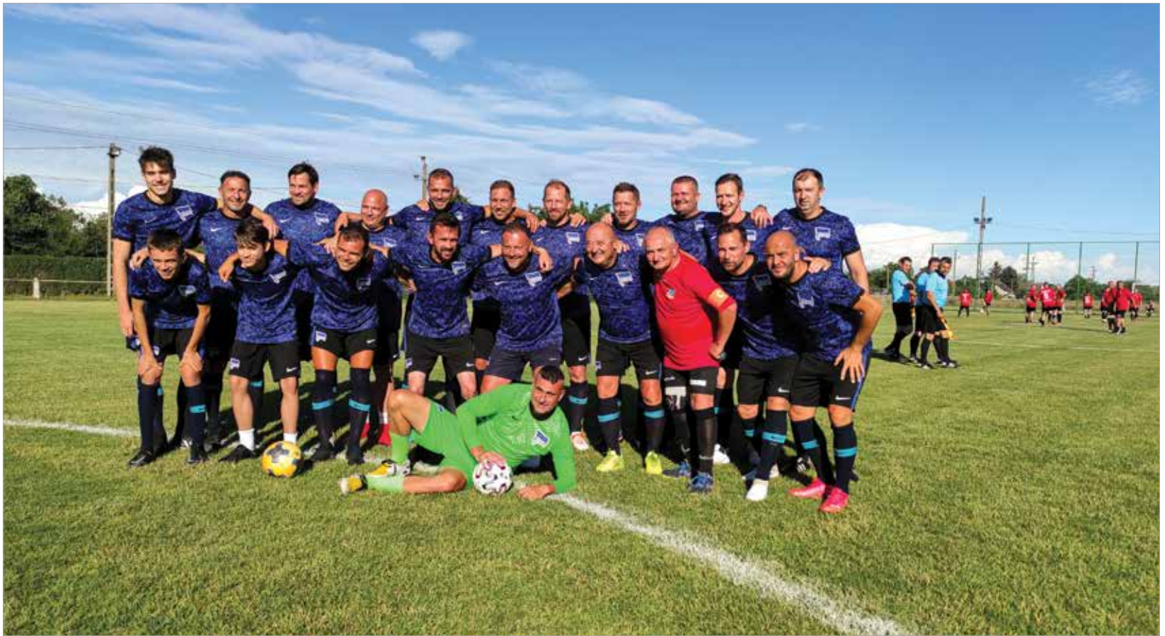
A Dárdai Team – tele klasszisokkal!

egy edzőtársat, hanem egy jó barátot veszítettünk el. Közösen építettük fel pályafutásunkat, sok évet dolgoztunk együtt, és mindig nagy szeretettel gondolkodom rá. Hálás vagyok a sorsnak, hogy együtt dolgozhattunk!"