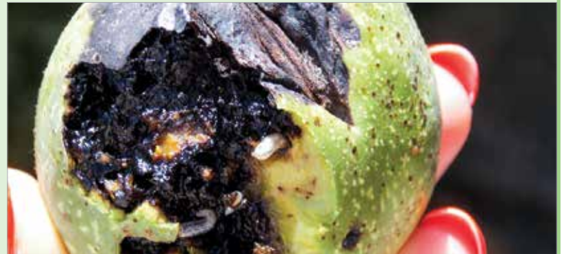
Ilyen kárt tud tenni a fúrólégy a még zöld termésen

Kézenfekvő megoldás lenne a talaj fertőtlenítésével kezdeni, azonban ez városi, kiskerti környezetben csak akkor lenne eredményes, ha minden szomszéd egyidejűleg megtenné. Mivel a kártevőnek szárnya van, a szomszéd fájáról is átrepül, így a talajfertőtlenítés hatása erősen kétséges. A védekezésben fontos a pontos időzítés, amit sárga lapos csapdázással tudunk előjelezni. Amint észleljük