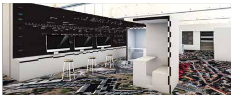
A cél, hogy minél inkább érzékelhető legyen a mai ember számára is az egykori koronázóbazilika monumentalitása és jelentősége

művészettörténészek, muzeológusok és időszaki kutatók részére. Az épület alatt háromszázötven négyzetméteres pinceszint létesül, ahol az értékes kőanyagok és a