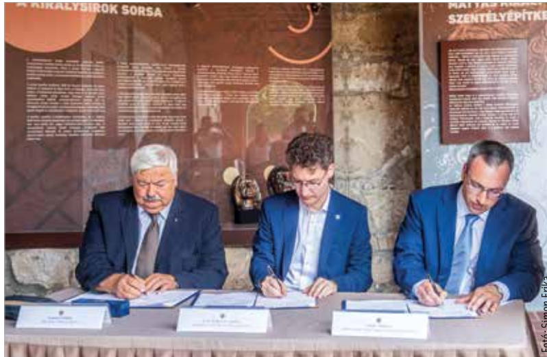
A megállapodás aláírásával Székesfehérvár csatlakozott a Szent István 2025 programsorozathoz

A Magyar Polgári Együtműködés Egyesület és az Emberi Méltóság Tanácsa Egyesület 2020-ban ötéves programsorozatot hirdetett Szent István 2025 néven, az államalapítás 1025. évfordulójára való előkészületként, államalapító magyar királyunk életművének megismertetésére és további kutatására. A kezdeményezés legfőbb célja az uralkodó teljes szellemi örökségének újrafelfedezése azzal a szándékkal, hogy a nemzeti önbecsülésre, a tudásszomjra és a magyarság valós történetének bemutatására irányuló törekvések egyesüljenek. A programsorozat minden évének saját tematikája van, mely Szent István örökségének egy-egy elemére irányítja a figyelmet. E tematikus programok érintik a király állam- és egyházszervező tevékenységét,