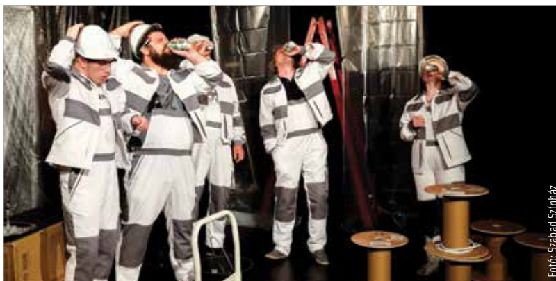
A Vasvári Nemzetközi Színjátszó Fesztiválon a Mesteremberek a fesztivál legjobb előadása lett