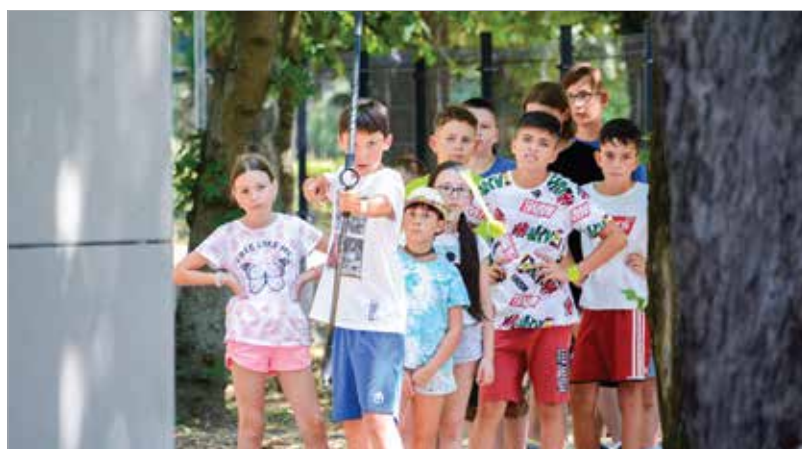
Az első turnus résztvevői mind bajnokká válnak a héten!

„A járványidőszak előtt bevált a Harry Potter tematikájú hét, így idén is nagy érdeklődést váltott ki a második hétre szervezett turnusunk. A varázslók világában lehet majd a jövő héten kalandozni! Ezután a gyerekek hazafias nevelését szeretnénk előtérbe hozni: a Magyarország, szeretlek!