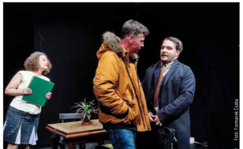
Az örökség című darabot legközelebb július hetedikén este nyolckor láthatja a nagydíjnyertes Vence Teátrumban