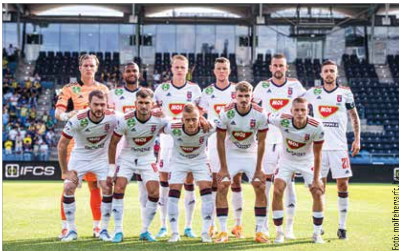
Az európai kupaselejtezőre kell igazán összeállnia a fehérvári csapatnak!