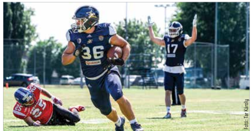
Egy képből a lényeg: földön a Miskolc, döntőbe száguldott az Enthroners