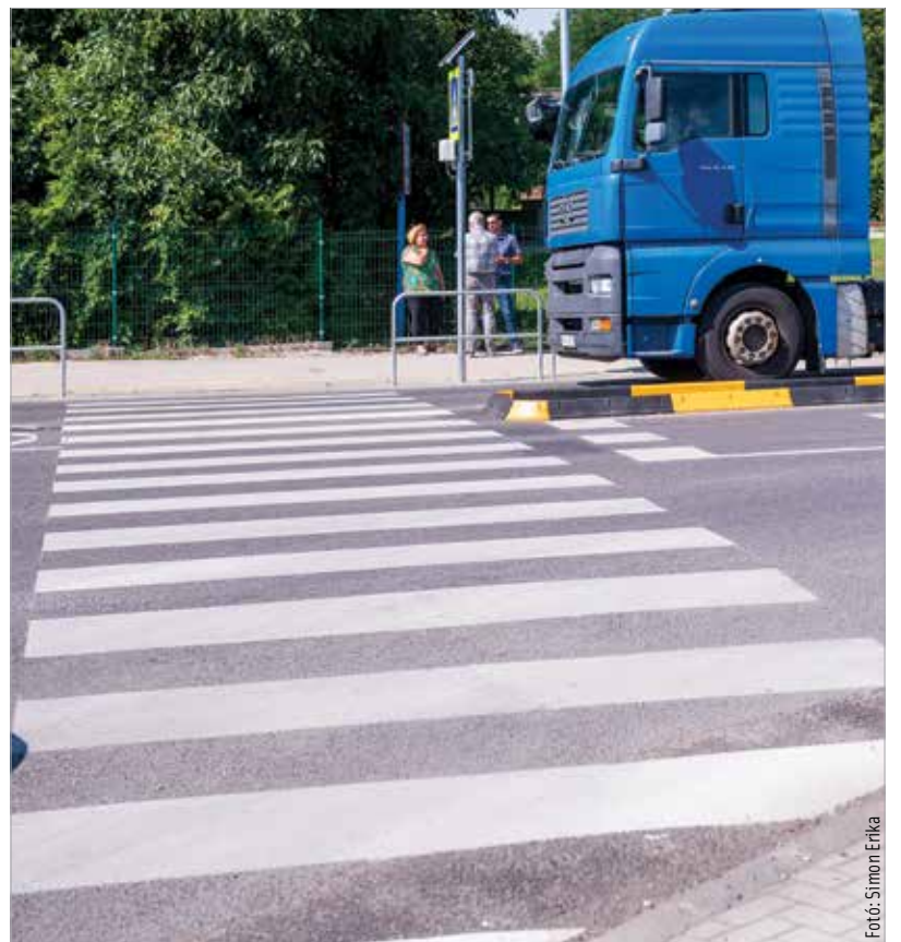
Az Akácfa és a Szárcsa utca Sárkeresztúri úti kereszteződésénél lévő átkelő immár rendeltetés-szerűen használható