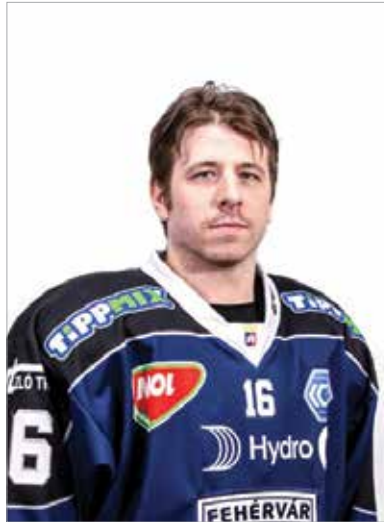
A kapitány eredményes szezont zárt

vagyok, gyorsan meg is tudtunk egyezni, így mindenki számára jó döntés született.