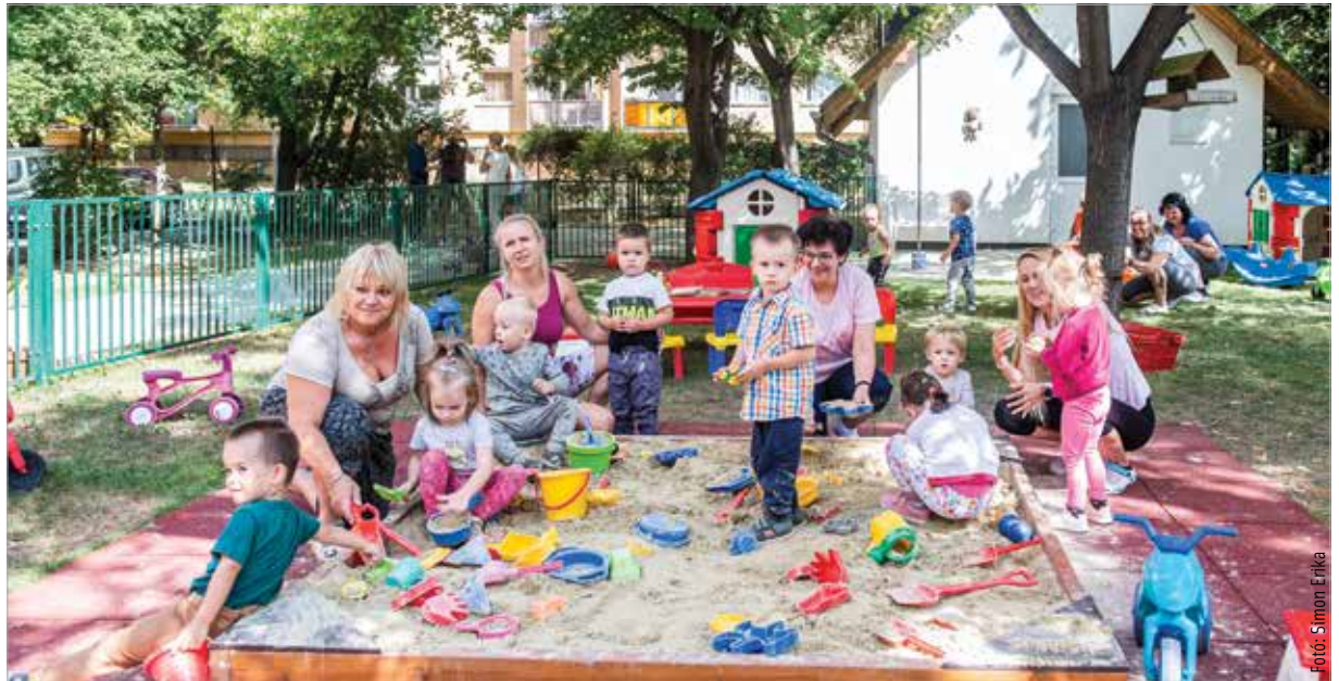
A bölcsődés gyerekek boldogan játszanak új otthonuk, a Mancz János Minibölcsőde udvarán