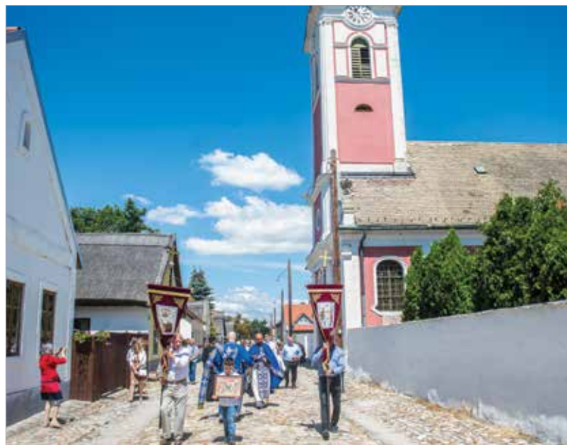
A hagyományokhoz hűen a Rác utcában tartott felvonulással köszöntötték Szent Iván napját