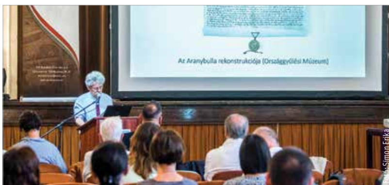
Az Aranybullák a középkori Magyarországon és Európában című tanácskozáson a téma elismert szakemberei tartottak előadást