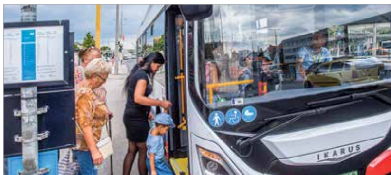
A korszerű, környezetbarát technológia a szolgáltatás színvonalát is emeli

A buszok Székesfehérváron, az Ikarus területén készülnek, és egyre több saját, fehérvári fejlesztés kerül bele a kínai alapba. A szoftver fejlesztése csak egy a helyi innovációk közül, de például a teljes ajtóvezérlést is Fehérváron fejlesztették a mérnökök, és növelték a jármű hatótávolságát is. A fejlesztések célja, hogy minél többet tudjanak egy töltéssel megtenni a buszok. Nemrégiben egy teszten háromszáznyolcvan kilométert tudott megtenni a jármű egyetlen töltéssel.