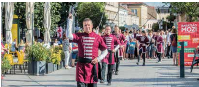
A Fejér Baranta HSE tagjai látványos bemutatókat tartottak