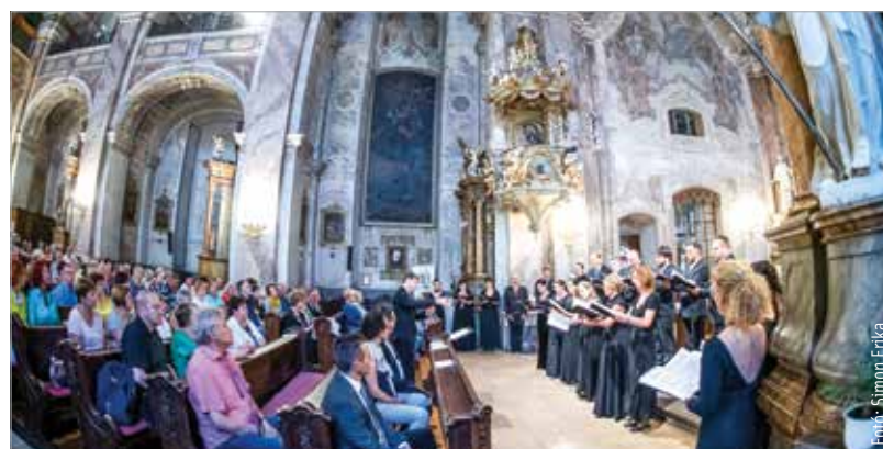
A kórusmuzsika újra megszólította a székesfehérváriakat