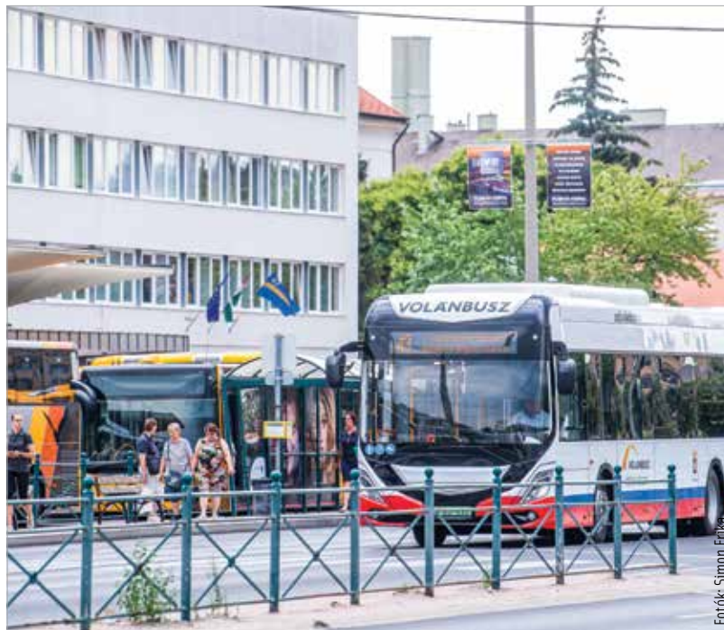
Szeptember végéig mind a tizenkét új elektromos busz forgalomba áll Székesfehérváron