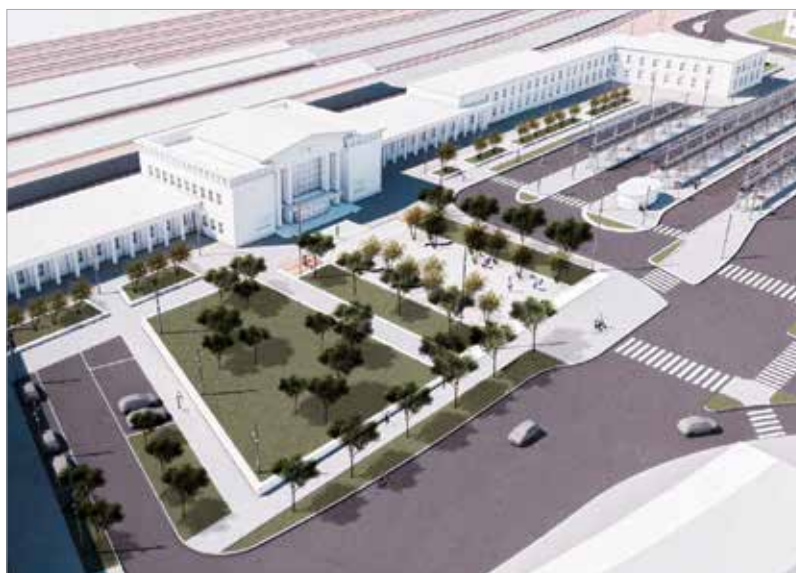
Részeire bontanák az intermodális csomópont megvalósítását

A most leállított állami beruházásokkal kapcsolatban a polgármester telefonon egyeztetett a kormány építési és beruházási miniszterével. Arra a kérdésre, hogy mikor válhatnak a most elhalasztott projektek újra aktuálissá, Lázár János azt mondta: ősszel egyeztessenek újból a beruházások sorsáról.