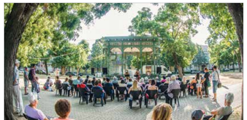
A programot a Red White csellóduó koncertje zárta a Zichy ligetben