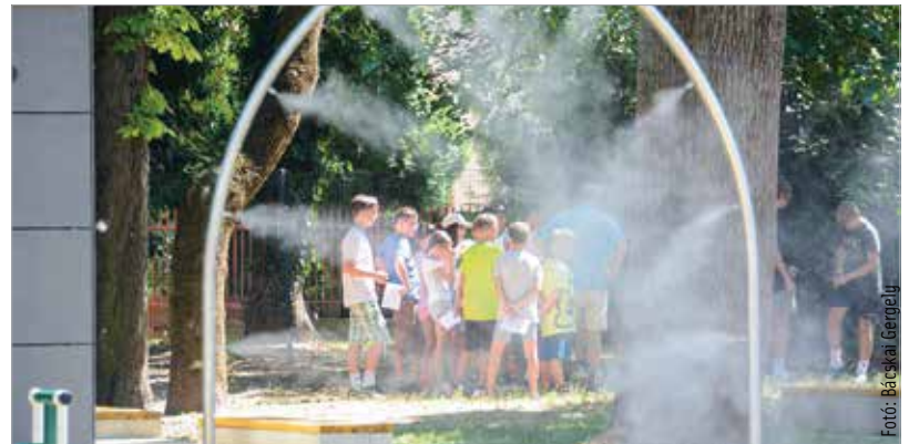
A záróturnusra július huszadikáig lehet jelentkezni

Jelentkezni a város honlapján lehet az online kitölthető lappal. Érdeklődni a fehervartabor@varosgondnoksag.hu e-mail-címen és a 22 500 512-es telefonszámon lehet.