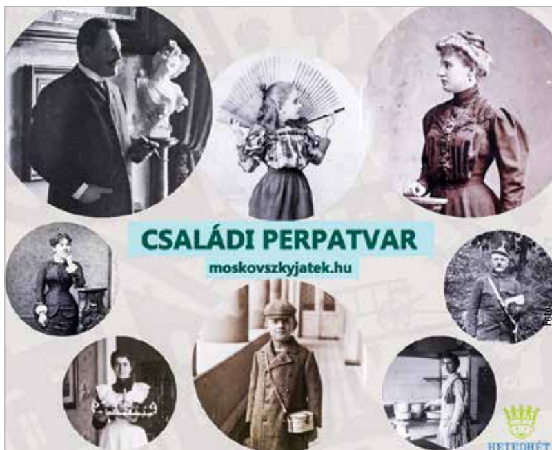
Minden érdeklődőt szeretettel várunk keddtől vasárnapig délelőtt tíz és este hat között az Oskola utcában!

Egy tizenkilencedik századi kaland részesévé válhatnak mindazok, akik kipróbálják a Hetedhét Játékmúzeum most elkészült interaktív játékát. A kettő-nyolc fős csapatok – családok, baráti társaságok – a porcelángyáros család történetét követhetik nyomon, melyben mindenki maga választja ki, melyik szereplő bőrébe bújik. Így a kaland résztvevői megtapasztalhatják, milyen kihívások vártak akkoriban a fiatalokra, akik álmaikat szerették volna követni, és akár énekesnőnek vagy vitéznek állni. Mi vált akkoriban egy nyugdíjazott katonára, vagy ép-