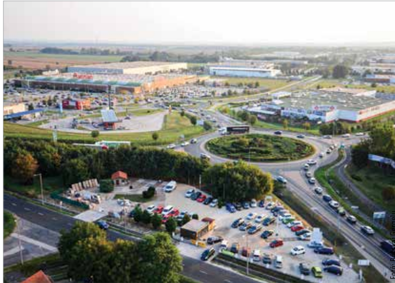
Több ezer autó halad át naponta ezen a csomóponton, a dugó okozta kocsisor sokszor az autópályán áll

Hogy a fent említett, leállított beruházásokra mikor áll majd rendelkezésre a szükséges összeg, most még