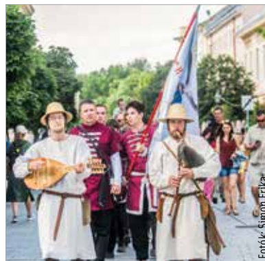
A zenészek bejárták a várost

Az erős szél miatt a királyi óriásbábok nem vonultak fel a megszokott útvonalon. A hagyományok tisztelői azonban a Vörösmarty Színház épülete előtt kaptak történelmi visszatekintést a Magyar Királyság hajnalán betöltött szerepükről.