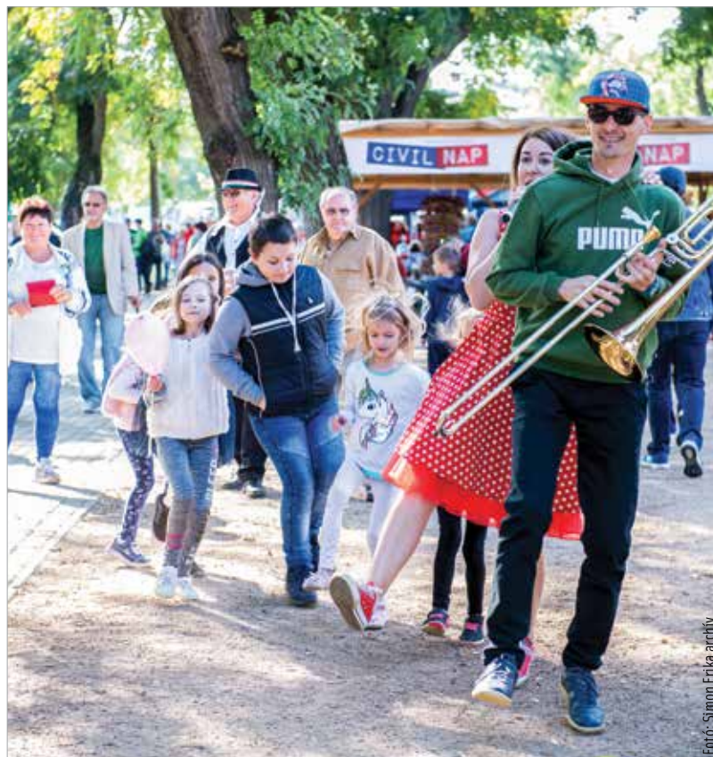
A Székesfehérvári Civilnap minden évben remek bemutatkozási lehetőséget kínál a szervezeteknek, ugyanakkor színes családi programot is nyújt az érdeklődőknek

A Civilnapon háromszor három méter alapterületű sátrakban egységként két szervezet standjának az elhelyezését tervezik, legfeljebb két sörpaddal, valamint áramvételi lehetőséggel. Mindezt a szervezők biztosítják valamennyi szervezetnek. A résztvevők számára az önkormányzat kisösszegű anyagi hozzájárulást is biztosít a kitelepülés költségeihez.