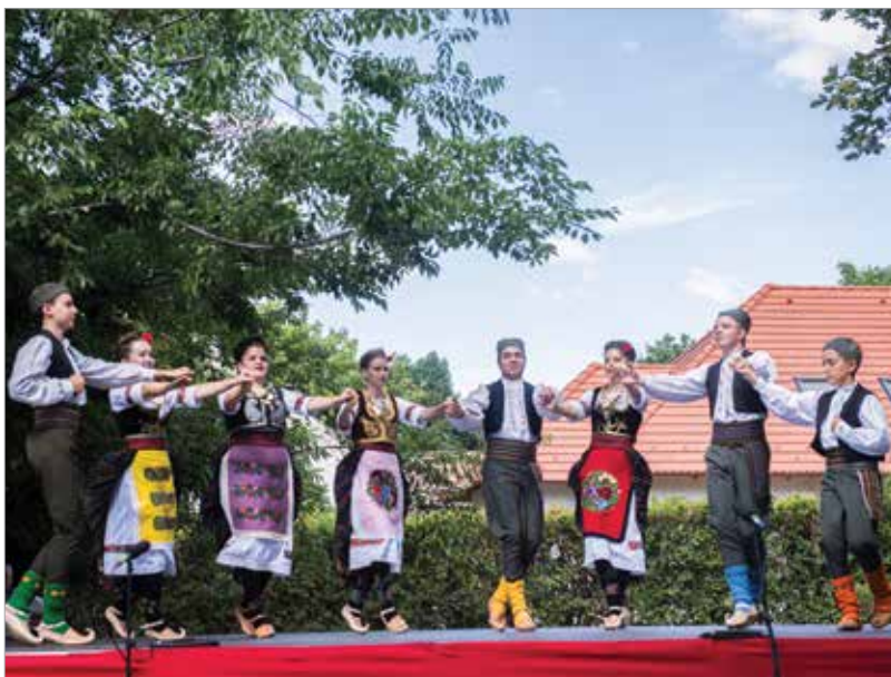
A budakalászi Ruzmarin együttes táncával kapcsolódott be az ünnepbe