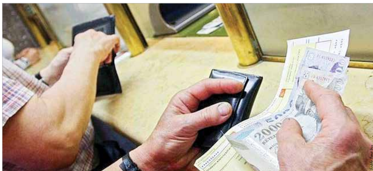
Az energetikai veszélyhelyzet emelkedő árakat hozhat

Csekkeket nézegetve számolgat a fél ország a bejelentés óta, a sarokszámok azonban még nem ismertek. A tervek szerint augusztus elsejétől lép hatályba az új szabályozás, de egyelőre senki sem tudja, mennyit kell majd fizetnie a következő havi fogyasztása után. Egy biztos, a rezsicsökkentés az eddigi formájában véget ér. Az energetikai veszélyhelyzet miatt felállított operatív törzs tehát finomhangol, minden élethezre megoldást kíván nyújtani. Steiner Attila energia- és klímapolitikáért felelős államtitkár néhány újdonságot elárult a formálódó rezsizabályozásról. Mint fogalmazott, a legtöbb élethezre kezelni képes csomag összeállításán dolgoznak, hiszen szeretnék, hogy mindenki részesüljön a rezsicsökkentésből továbbra is, ezért kötik az átlagfogyasztáshoz a limitet, de vizsgálják, hogy az eltérő élethezretek tekintve ez kinél, mit jelent. A Parlament a héten döntött a 2023-as büdzséről. A kormány legfontosabb célja, hogy Magyaror-