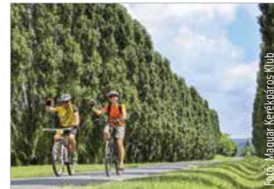
A túráról további részletek a „Szt. Kristóf áldásával tekerj a zöldbe a Balatonra!” című Facebook-eseménynél olvashatók.

Akarattyán. Az utazók védőszentjének napjához kapcsolódó túra hossza oda-vissza összesen 52 kilométer.