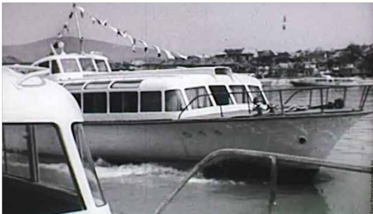
A vízibuszok formatervezője az Ikarus korábbi konstruktőre volt

A hasonlóság tehát innen ered, a vízibuszok eljutottak Afrika folyóira és Velence lagúnáiba, miközben „testvéreik”, a Székesfehérváron is gyártott Ikarus buszok szintén meghódították a XX. század világát – csak épp nem a vizen, hanem az utakon.