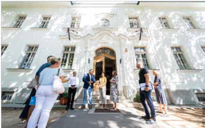
A tervek szerint a konyha és az étkező augusztus végéig elkészül, az épület többi részén a munkálatok jövő tavasszal fejeződnek be. A második ütem költsége bruttó 304 millió forint.