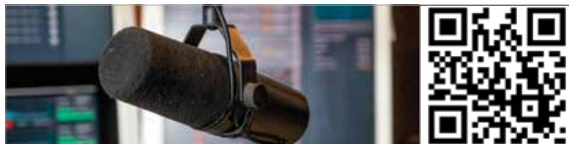
További részletek, érdekességek a rádiós beszélgetésben, amiből az is kiderül, mi történik a hat hónapos kiképzés végén. A beszélgetés a QR-kód leolvasásával indítható, vagy meghallgatható a Vörösmarty Rádió Youtube-csatornáján.

A szeptember 5-én induló kiképzés két ciklusból áll, kettő plusz négy hónapos. Az első két hónap általános alapkiképzés. A második – négy hónapos – szakaszban a résztvevők választhatnak, akár harckocsizó, ejtőtornyos vagy bűvárgyakorlatot is lehet szerezni. A résztvevők juttatása az első két hónapban megegyezik a mindenkori minimálbér összegével. Akik különleges műveleti besorolású alakulatot választanak, azok bruttó 260 ezer forintot kapnak. Emellett jogosultak lesznek többféle ellátásra, költségtérítésre.