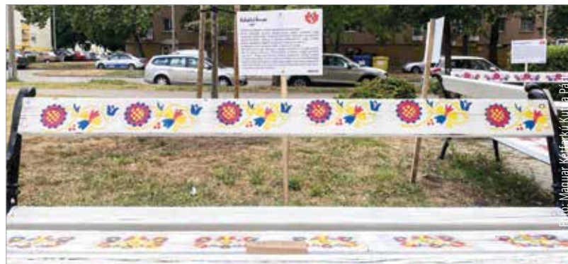
Négy padot újírtott fel a Magyar Kétfarkú Kutya Párt a Sarló utca 1-es szám alatti teknős szobornál. Sárbogárdi, rábaközi, kunsági, illetve hódmezővásárhelyi mintákat festettek rájuk, majd ki is táblázták az adott tájegység rövid ismertetőjét.