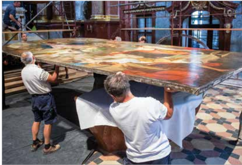
Minimum tíz ember erejére és precizitására volt szükség

kében 2018 tavaszán bezárták a székesegyházat, majd a templomhajóban régészeti feltárást végeztek. Az ásások során előkerült