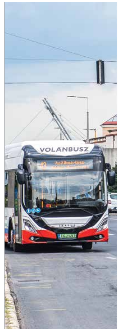
A flotta folyamatosan bővül, a múlt héten is álltak forgalomba új elektromos buszok

másról 6:35-kor induló 26G járat 26C jelzéssel 6:30-kor indul, az iskolai előadási napokon 7:15-kor induló járat pedig munkanapokon közlekedik a Depónia Kft-ig. A Videotontól 14:15-kor és 22:15-kor induló 26G járatok 26C-ként a Depónia Kft-től indulnak úgy, hogy a Videotontól a megszokott időpontban indulnak tovább. A Depóniát kiszolgáló járatok javítják a Csalán élők közlekedési lehetőségeit. A 26C járatok mindkét irányban érintik a megállóhelyet. Az autóbusz-álo-másról új 26C járatok indulnak munkanapokon és szabadnapokon 5:30-kor, munkanapokon 6:30-kor, 7:15-kor, 9:00-kor és 13:00-kor. A belváros felé új járatok indulnak munkanapokon 12:07-kor, 14:10-kor, 16:07-kor, 17:07-kor, 18:07-kor és 22:10-kor, a hét utolsó munkanapján 13:07-kor, munkanapokon és szabadnapokon 14:52-kor.