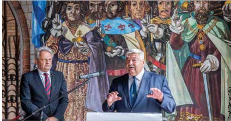
A Szent István 2025 programsorozat ősszel kulturális eseményekkel, konferenciákkal folytatódik Székesfehérváron.

Múlt héten beszámoltunk róla, hogy megszületett az a megállapodás, melynek értelmében Székesfehérvár városa csatlakozott a Szent István 2025 program-sorozathoz. A kezdeményezést az államalapítás 1025. évfordulója tiszteletére, István király örökségének méltó ápolására indította a Magyar Polgári Együttműködés Egyesület és az Emberi Méltóság Tanácsa. Most az összefogás egy újabb fontos lépéséről számolt be a Nemzeti Emlékhelyen tartott sajtótájékoztatón Lomnici Zoltán, az Emberi Méltóság Tanácsának elnöke. Kezdeményezik, hogy augusztusban, Szent István ünnepén az állami