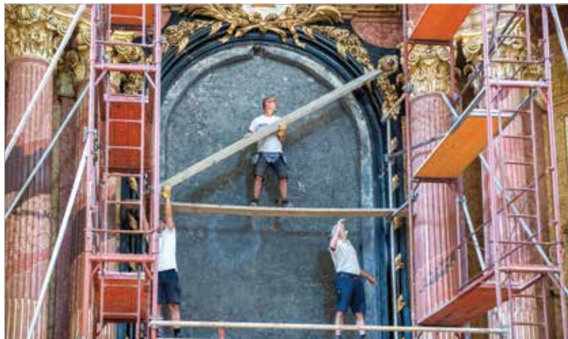
Gondos előkészület előzte meg a kép visszahelyezését

egy értékes, 13. századi limoges-i bronz korpusz. 2018 őszén Barokk mennysorozat címmel kiállítást rendeztek a székesegyházról a Csók