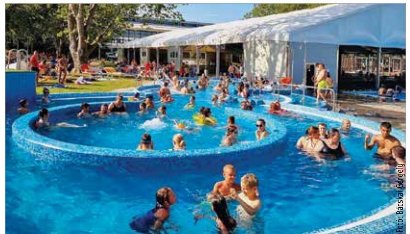
A belépőjegyek ára változatlan maradt idén: a felnőtt belépő 2000, a kedvezményes jegy 1500 forint, a családi jegy pedig 6000 forintba kerül.

hűvösebb napokon hétszáz vendég fordul meg a városi strandon. Idén már többször volt telt ház is. A strandolók figyelmét felhívják arra, hogy 10 és 16 óra között továbbra is nagyon erős lesz az UV-sugárzás, ezért érdemes napszemüveget és szalmakalapot viselni, valamint a leégés ellen magas faktorszámú fényvédő krémekkel védekezni. A fürdőzőknek kitűnő választás lehet a forró délutánokon a fedett nagymedence, ahol a mobil sátor oldalfalait kivették, így szellős és árnyékos is ad.