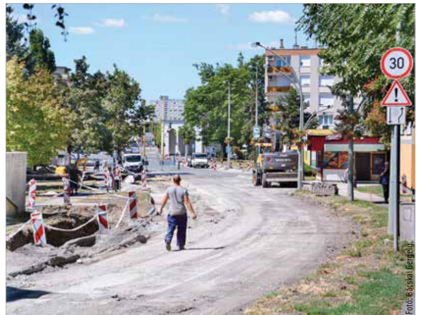
Öt helyszínen épül jelenleg járda és bicikliút Fehérváron

továbbá az Eszperantó tér és a Zichy liget között az útburkolat is megújul. Többen rémhíreket terjesztettek, hogy a volt Domus áruházal szembeni négyemeletesek mellett található fákat kivágják. Ilyen nem történik, ezeknek a fáknak a törzsét a munkálatok alatt védelemmel látta el a kivitelező, és a nyomvonal is a fákhöz igazodik. A beruházás a Koch László utca és Mátyás király körút kereszteződésében érint két fat.