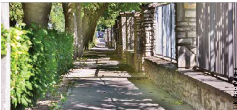
A két járdaszakasz felújítása mintegy harminc millió forintba került a különböző árváltozásoknak köszönhetően.

Ezzel rövidesen befejeződik a Tóvárosi lakónegyed járdáinak és utainak teljes felújítása. 2019-ben ugyanis a páratlan oldali járdaszakasz újult meg, illetve a tavalyi évben a teljes útburkolat, a kerékpárfelfestésekkel és a járdákkal együtt. A most kezdődő munkálatok várhatóan november végéig fejeződnek be.