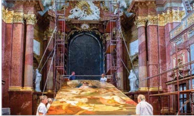
Restaurálás után visszakerült a főoltárkép a bazilika falára

Több mint három évig tartó restaurálás után visszahelyezték a Szent István király koronafelajánlását ábrázoló főoltárképet eredeti helyére, a Székesfehérvári Egyházmegye főtemplomának szentélyében. A teljeskörű restaurátori kutatásokkal 2016-ban kezdődött a nagyszabású projekt. A munkálatok zavartalan elvégzése érde-