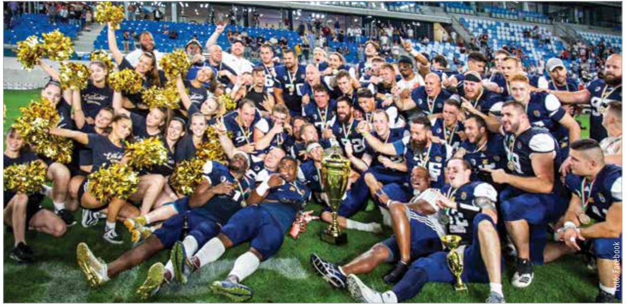
2019 után másodszer ünnepelhetett bajnoki címet az Enthroners