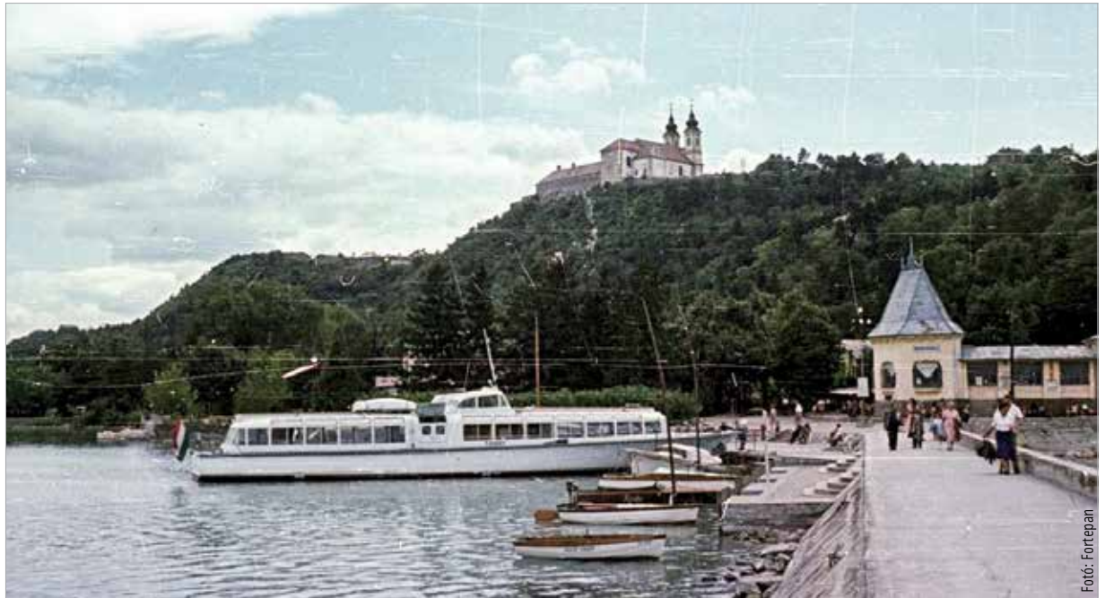
Az első magyar vízibusz, a Tihany

Az Ikarus sikereit a kezdeti modellek alapozták meg. Az Ikarus 30 például a városi közlekedésben nem, helyközi utasszállításban azonban nagyszerűen helytállt: az NDK, Kína és Csehszlovákia is alaposan bevásárolt belőle. Az ötvenes évek meghatározták a márka arculatát, jövőképét, mely az egykori Általános Mechanikai Gépgyár 1963-as Ikarus Karosszéria és Járműgyárhoz csatlakozástól kezdve a fehérvári buszgyártásra is erős hatással volt.