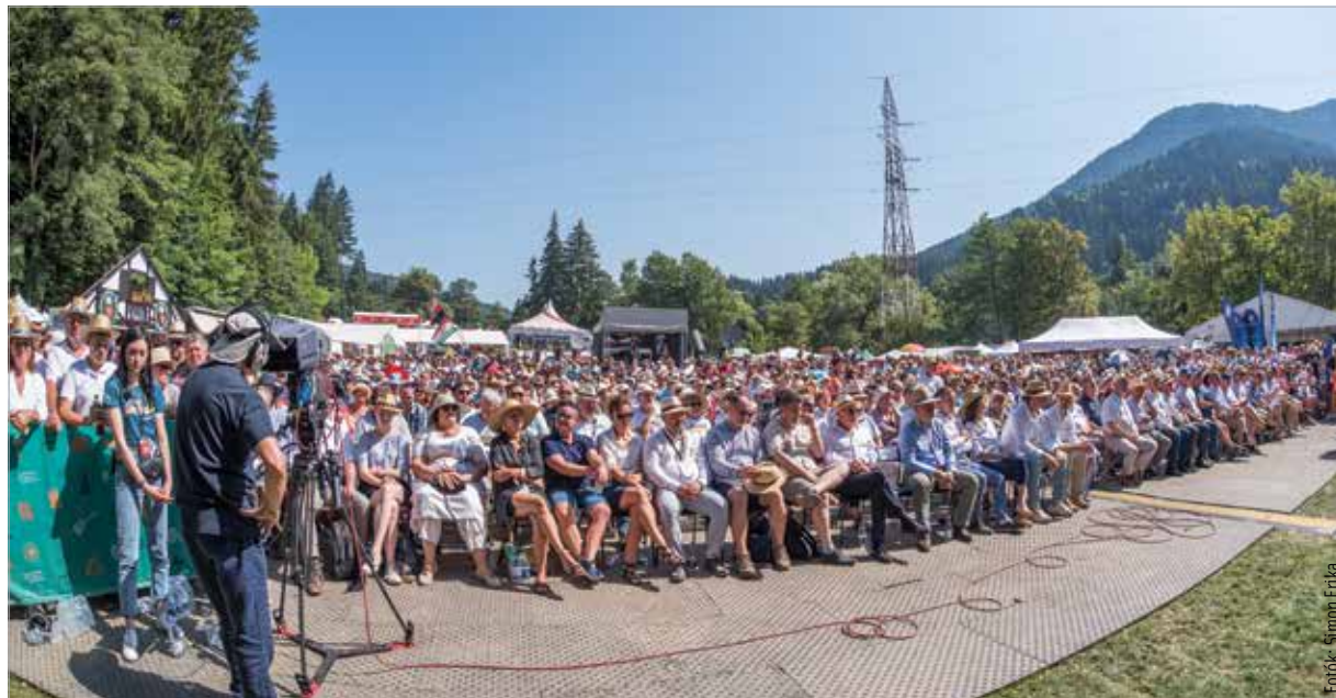
Ezen a napon egy tűt nem lehetett leejteni Tusnádfürdőn

a technológiai váltás kihasználása. Ha elég gyorsak vagyunk, a technológiai váltásokon mindig nyerhetünk. Itt van például az elektromos autók példája. Hatalmas akkumulátorberuházásokat csinálunk Magyarországon, és pillanatokon belül mi leszünk a világ harmadik legnagyobb akkumulátorgyártója és ötödik legnagyobb exportőre a világon. Vannak tehát ezek a rések, ahová be tudunk menni. A külföldi tőkebeáramlás: ez a hatodik nagy esélyünk. Keletről és Nyugatról is jön a tőke. 2019-ben vagy talán 2020-ban már Dél-Korea hozta a legtöbb befektetést, a rá következő évben Kína, és ebben az évben ismét Korea, miközben a németek beruházásai is mennek tovább. Tegnap jelentették be