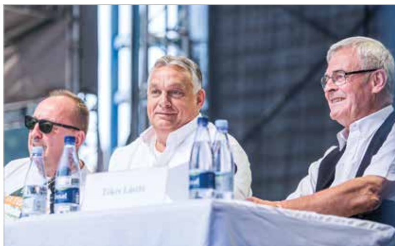
Tíz pont a jövőért

az új Mercedes-gyár építését, az egy egymilliárd eurós beruházás. Tranzitország vagyunk és tranzitgazdaság is akarunk maradni, ahol azt a megjegyzést kell tennem, hogy ha a világ blokkosodik, és megint kettévágják keletre és nyugatra, akkor mi nem ta-