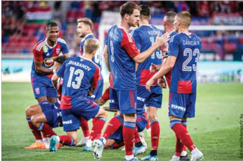
A Gabala-Fehérvár-meccset a Duna World július huszonnyolcadikán, csütörtökön este hattól élőben közvetíti

Győzelem esetén még két selejtezőkörön kellene túljutnia a Fehérvárnak, hogy ott lehessen a harminckét csapatos csoportkörben. A csapat az azerbajdzsáni túra után megkezdi szereplését az OTP Bank Ligában is: vasárnap 18 órától Pakson lépnek pályára Negóék.