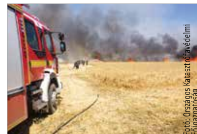
A szakemberek a Seregélyesnél keletkezett tűz oltásán dolgoznak