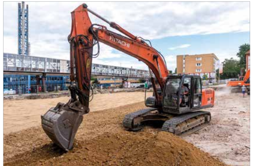
A munka zajlik, a 2023-ra megépülő új tömböt függőhíd köti majd össze a sürgősségi ellátó egységgel és a diagnosztikai tömbbel is

méter lesz. „Az épületbontási munkálatok befejeződtek, a létesítendő L épület földmunkái elkészültek, megkezdődött a cölöp-alapozás, és a tereprendezési munkálatok is rendben haladnak.”