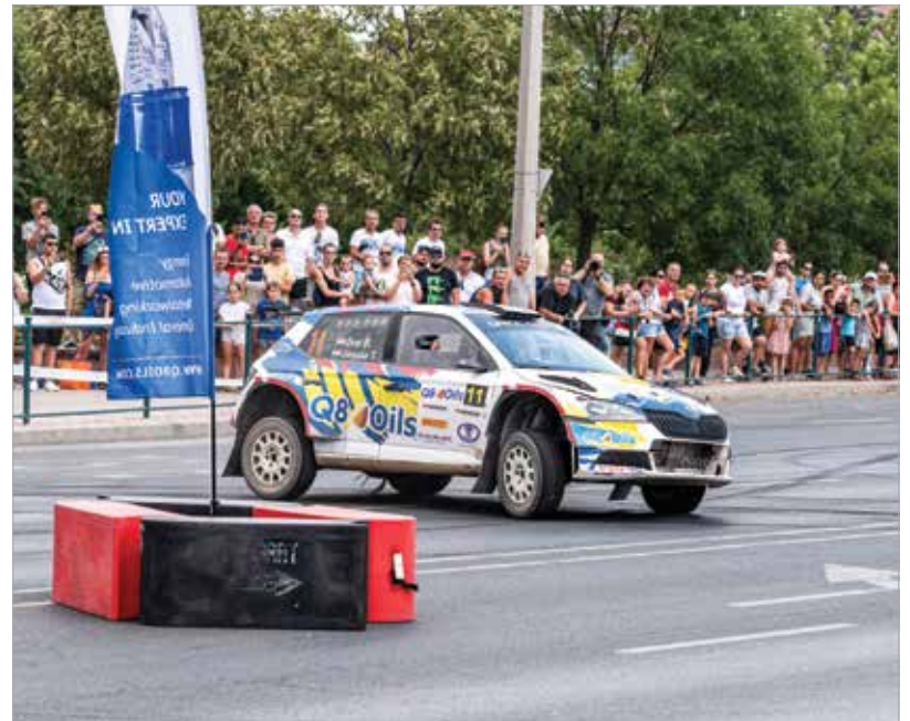
Az országos bajnokság leghosszabb versenyt rendezték idén, amelyre a hőssé ellenére is sokan kíváncsiak voltak Fehérváron

pályán, Hegyesden, Kislődön és a Kislőtéren folytatódott a száguldás. A versenyzőknek a két nap alatt nemcsak egymással, de a hősséggel és a porral is meg kellett küzdeniük. Ráadásul a Székes-