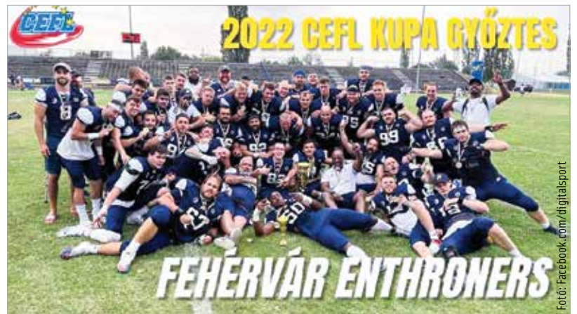
Újabb trófea lett a fehérváriaké

A 24-20-as végeredmény azt jelenti, hogy a Koronázók továbbra is veretlenek a szezonban, vasárnap pedig a szezon utolsó, tizennyolcadik mérkőzésén idei harmadik trófeájukat is megszerezhetik, amennyiben le tudják győzni az Amstetten Thunders csapatát az osztrák Divízió 1-es bajnokság döntőjében.