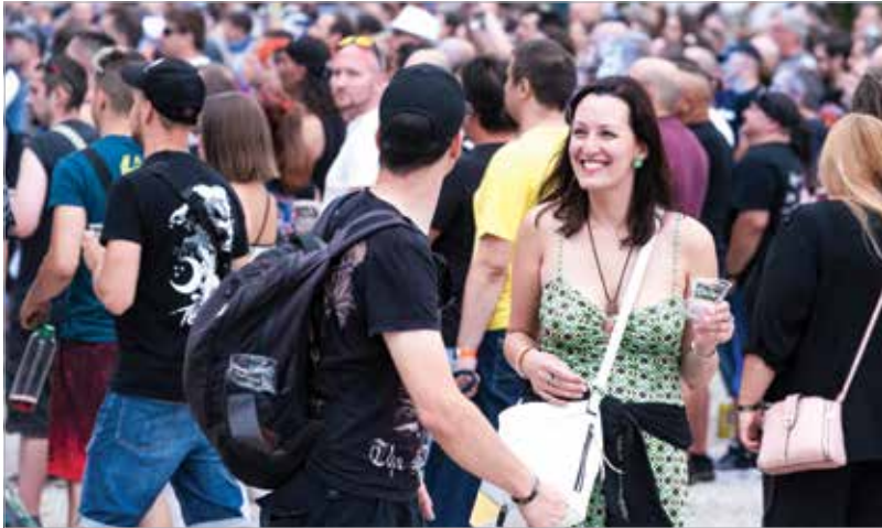
A huszonöt éves születésnapot tartával, tűzijátékkal és egy szabadtéri, nagyszínpados Necc Partyval ünnepli a fesztivál szombaton

felé is, de természetesen a hazai kedvencek sem maradnak el. A Fehérvár Enthroners nemzetközi szereplése miatt idén nem használható kempingként a First Field, így a sátorozók a Bregyó közben szállhatnak meg. A kemping és a rendezvény helyszíne között ingyenes buszjáratok szállítják a fesztiválozókat.