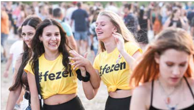
Óriási bulik, partihangulat, jó társaság – közel ötvenezer vendéget várnak a négy nap alatt