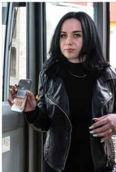
Az online vásárolt havi diákbérlet továbbra is kétszáznyolcvan forintba kerül Fehérváron

folytatásáról ősszel dönt majd a közgyűlés, de az eddigi tapasztalatok nagyon kedvezőek.