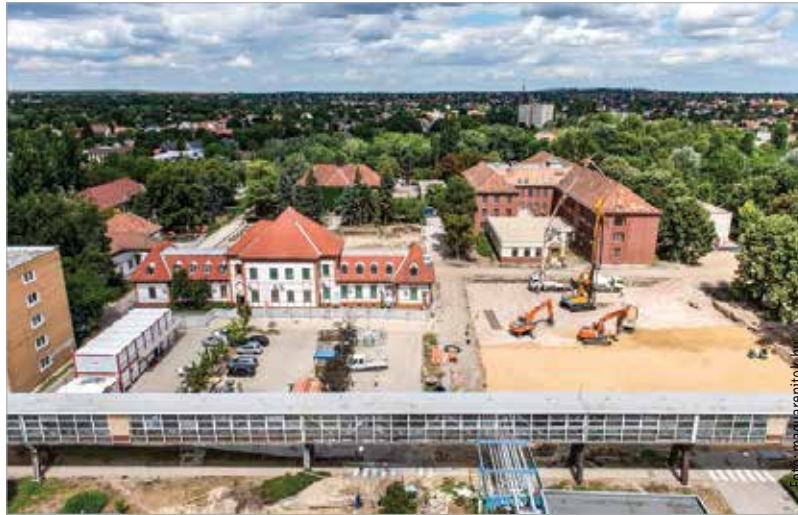
Az új épületnek köszönhetően a betegek ellátása lényegesen gyorsabb és biztonságosabb lesz

Jól halad a munka a Szent György Kórházban: készül az új belgyógyászati tömb, mely három szinten ad majd helyet a pulmonológiának, a felnőtt és gyermekinfektológiának, valamint az onkológiának. Az új részleg kialakítását a Fejér-B.Á.L. Zrt. és az Épkar Zrt. konzorciuma végzi mintegy 11,5 milliárd forintból. A munkálatokkal kapcsolatban a magyarepitok.hu portál kérdezte Cser Szabolcsot, a FEJÉR-B.Á.L. projektvezetőjét, aki elmondta: a C épület elbontásával és az L épület építésével nyer új belgyógyászati tömböt a fehérvári kórház. Az új épület körülbelül 9000 négyzetméteres területen valósul meg. A teljes beruházás során parkot, negyven parkolóhelyet, illetve a