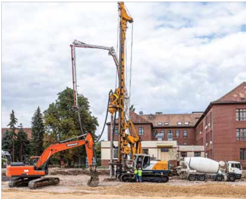
A cölöpöző géplánc felvonulásával folytatódott a nagyszabású beruházás