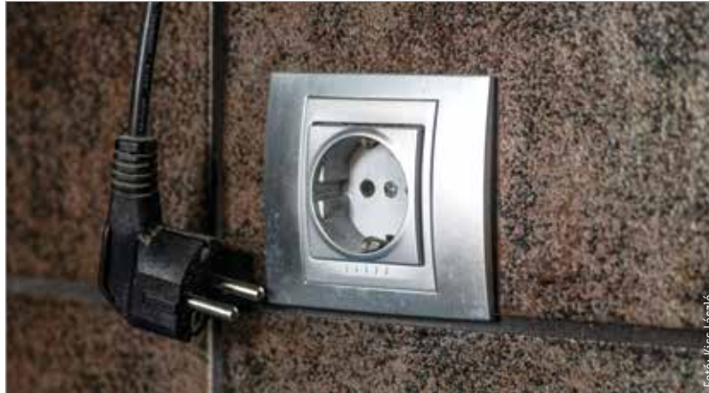
A rezsikalkulátor.hu oldalon a havi fogyasztását megadva bárki könnyen kiszámolhatja, mennyi rezsit fog fizetni a következő hónapból

A rezsicsökkentés egész Európában egyedülálló intézmény, amely a magyar családokat védi az energiaválságtól, és a jövőben is fennmarad – mondta Németh Szilárd az erdélyi Tusnádfürdön. Hozzátette: meghatároztak egy limitet, ameddig a gázt és a villanyt mindenki rezsicsökkentett áron kapja. Ez a limit a földgáz esetében 1729 köbméter/év, vagyis 144 köbméter/hónap, a villamos energiánál pedig évi 2523 kWh, ami 210 kWh havi fogyasztásnak felel meg. Bevezettek egy új tarifát, az úgynevezett lakossági piaci árat, mely jóval kisebb, mint a versenypiacokon tapasztalható ár: 2523 kWh/év fogyasztásig 36 forintért kapják a magyarok kilowattóránként az áramot, e fölé pedig 70 forint 10 fillérért. Az áram valós, versenypiaci ára 268 forint 90 fillér. A rezsicsök-