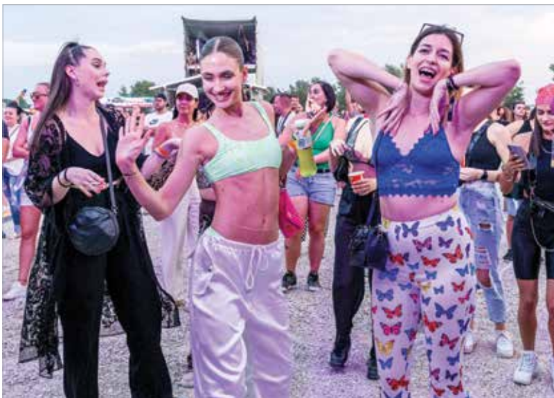
Két év kihagyás után ismét fergetes hangulattal várja Fehérvár a fesztiválozókat