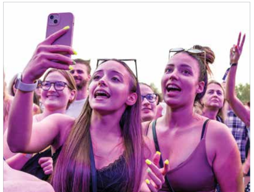
Nemzetközi és hazai fellépők szórakoztatják a fezenezőket hét színpadon