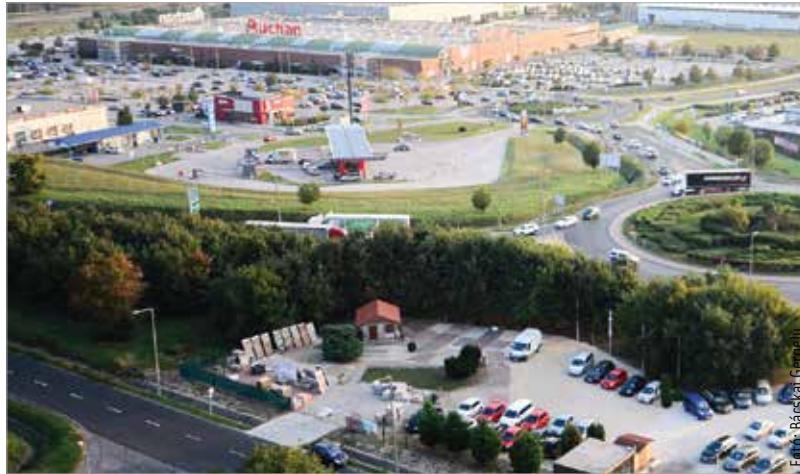
A beruházás tervei kész vannak, már csak kedvező kormányzati döntés kell!

„Ígéretemnek megfelelően nem adjuk fel az Auchan melletti körforgalom bővítésének ügyét, mert ez a beruházás egyrészt nem tűr halasztást, másrészt a bekerülési összeghez képest óriási, regionális jelentőségű fejlesztésről van szó.” – írta közösségi oldalán Cser-Palkovics András. A csomópont jelentős főutak metszéspontja, erősen érintett az M7-es autópálya, emellett kiszolgálja a teljes térség személy-, áru- és turisztikai forgalmát is, ezért széles körű, regionális támogatásra van szükség ahhoz, hogy sikerrel járjon a törekvés. A polgármester levélben kérte többek között Lázár János és Navracsics Tibor miniszterek, Vitézy Dávid közlekedésért felelős államtitkár, valamint a régióink fejlesztéséért felelős kormánybiztos támogatását. A körforgalom minden terve ren-