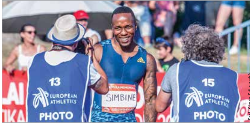
A tavalyi versenycsúcsot döntő Akani Simbine idén is száguld Fehérváron

A világsztárok között is kiemelkedik a világcsúcstartó Armand Duplantis, aki jelenleg a sportág talán legnagyobb csillaga. A 6,21 méternél járó svéd-amerikai rúdugró ugyan „külön ligában” játszik, de az ex-világrekorder és olimpiai bajnok Renaud Lavillenie, a 2016-os riói olimpiai aranyérmes Thiago Braz mellett a tavaly Tokióban és idén az oregoni vb-n is ezüstérmes Christopher Nielsen személyében a lehető legerősebb ellenfeleket kapta. Shericka Jackson minden idők második leggyorsabb idejével, 21,45 másodperccel nyerte meg a 200 métert Eugene-ben. Székesfehérváron az olimpiai bronzérmes Gabby Thomasszal, a világbajnok Jenna Prandiniével és a 100-on és 200-on is rajthoz álló Mujinga Kambundjival is összeméri erejét.