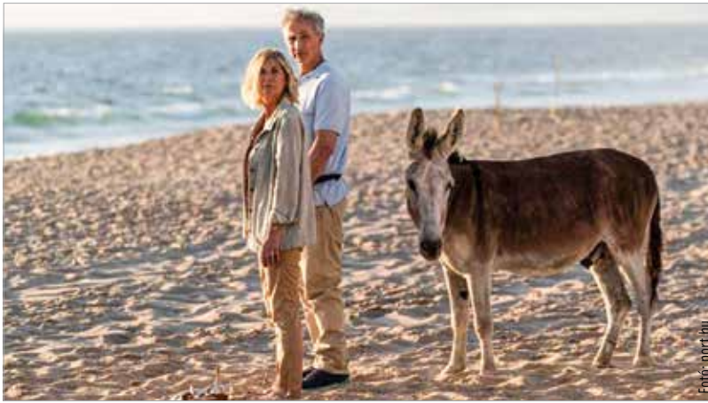
Könnyed francia vígjátékokkal vár a kertmozi augusztus tizenötödikén és tizenhatodikán a Bartók Béla téren!

Kisvártatva véget ér a fehérvári Barátság mozi nyári felújítása: augusztus 22-től a város művészmozija újra fogadja a filmbarátokat.