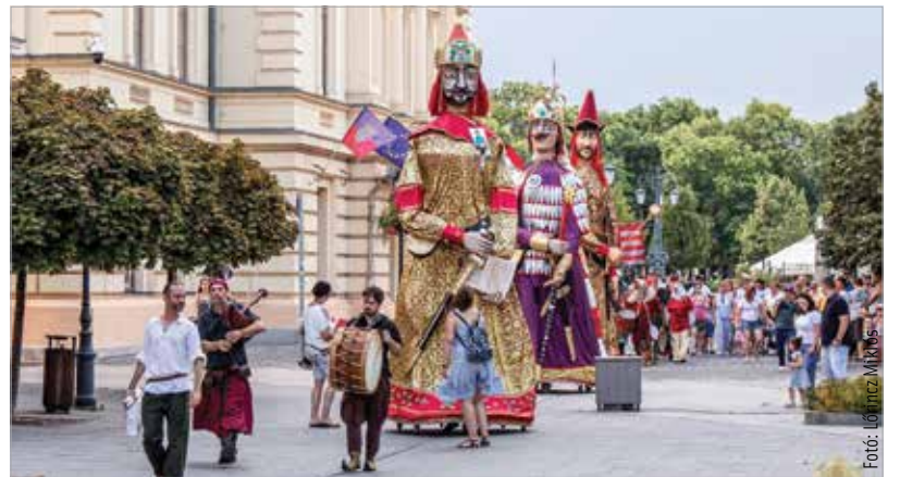
A Királyok a belvárosban sorozat évek óta népszerű nyári program Székesfehérváron. Szombatonként rendre sokan összegyűlnek, hogy végignézzék az óriásbábcsalád tagjainak felvonulását.