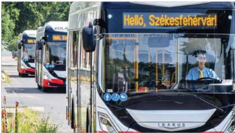
Az elektromos buszok többnyire a 31-es, a 33-as, a 34-es, a 43-as és a 44-es járatok vonalán fognak közlekedni

és növelték a járművek hatótávolságát is. Fejlesztéseikkel azt célozzák, hogy minél többet tudjanak egy töltéssel megtenni. Némrégiben egy teszten háromszáznyolcvan kilométert tudott megtenni a jármű egyetlen töltéssel. Szeptember végéig mind a tizenkét új elektromos busz forgalomba áll Székesfehérváron. A korszerű, környezetbarát technológia jelentős előrelépés, ami a szolgáltatás színvonalát is emeli.