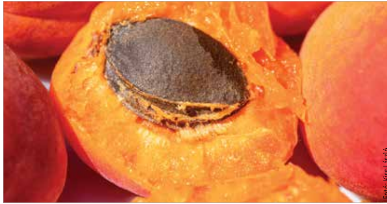
A barackmag mérgező vegyülete, a cianogén glikozid az utóbbi években egyre nagyobb mennyiségben van jelen. Egyetlen kis mag elfogyasztása is okozhat mérgezést!

A sárgabarack magjában ugyanis egy amigdalinnal nevezett cianogén glikozid található. Amikor valaki