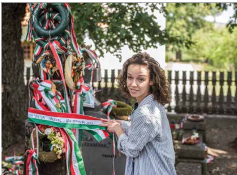
Tamási Áronra emlékeztek a verstábor résztvevői