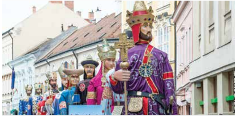
Augusztus huszadikán a fehérvári királyok menete páratlan történelmi felvonulás élményét nyújtja a közönségnek

Székesfehérvár 2022-ben emlékévet hirdetett az Aranybulla kiadásának