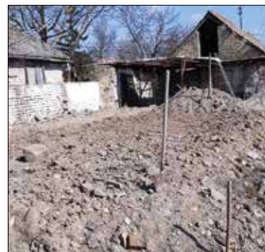
A sít elszállíttatása költségekkel jár

Nyilván vannak olyan helyzetek, amikor ez az újrahasznosítás nem megvalósítható. Am ebben az esetben is gondolkodhatunk másképpen! Ami nekünk szemét, az másnak lehet érték: a tiszta építési törmelék remekül felhasználható alapba, vagy éppen egy hasonló terasz kialakításakor. A különböző adok-veszek oldalakon gyakran ajánlják fel, hogy az épület-