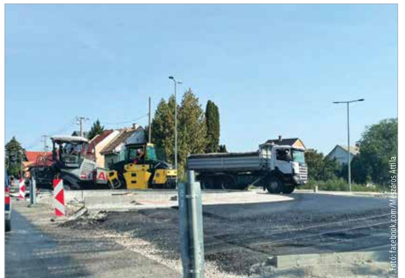
A körforgalom várhatóan augusztus tizenkilencedikére készül el

kapcsolódó csomópont kiépítése. A beruházás ezen üteme várhatóan augusztus tizenkilencedikéig tart. A forgalmat továbbra is jelzőlámpa irányítja, ami a nagy forgalom és a balesetek elkerülése miatt állandó üzemben, huszonnégy órában működik, a napszak forgalmához igazodó programmal. A gyalogosok és kerékpárosok közlekedése a lakóházak oldalán biztosított. A Fejérvíz Zrt. telephelyének elérése ez idő alatt csak déli irányból, az autópálya felől lehetséges.