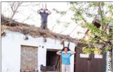
Életveszélyessé vált a disznóól

Az újrahasznosítás egyre nagyobb szerepet kap korunkban: már nemcsak környezetvédelmi szempont, de a családi kassza is meghálálja, ha kreatívak vagyunk. Erre remek példa egy életveszélyes melléképület újjáépítése Fejér megyében.