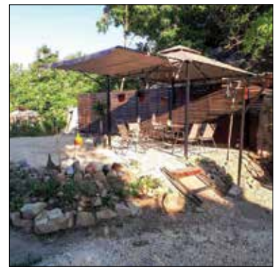
A kreativitás és az újrahasznosítás kifizetődő!

bontásból származó sítet ingyen elviheti, akinek szüksége van rá. Tegyük meg ezt mi is, és spórolhatunk magunknak és másoknak is! Amit még fontos tudni: Magyarország nagy részén tilos az építési törmelék szabadban történő elhelyezése, különösen a nemzeti parkokban vagy a természetvédelmi területeken. Ezeket a helyeket még olyan hagyományos módon sem használható fel a téglá-, a beton- vagy más hulladék, mint például a mellékutak, erdei utak javítása.