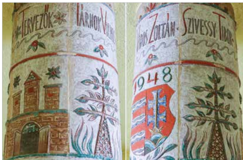
Kovács Margit a ház tervezőinek nevét is megörökítette

Az épület bejáratát mindkét oldalról egy-egy dombormű díszíti. A műveket Gáldi Gyula szobrászművész készítette, aki 1908-ban Berlinben született, és 1981-ben Budapesten hunyt el. Sokoldalú alkotóként ismerték, szobrai mellett készített kispasztikákat, sőt érméket is.