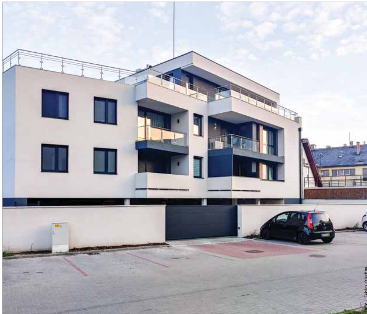
Július közepén országsszerte közel nyolcezer negyven új lakás és ház szerepelt az ingatlan.com kínálatában. Ezeknek harminckét százaléka található Budapesten, tizenhat százaléka pedig a megyeszékhelyeken. Fehérváron is dübörög az új építésű ingatlanok eladása.

A legfrissebb kormányzati bejelentések szerint két évvel meghosszabbítják azt a 2022 végén lejáró határidőt, ami alapján az eddig építési engedélyt szerzett ingatlanokat 2026 végéig lehet ötszázalékos áfakulccsal értékesíteni. A beruházók, az építkezést álló családok és vásárlók számára a meghosszabbított határidő azt is jelentheti, hogy 2025-ben és