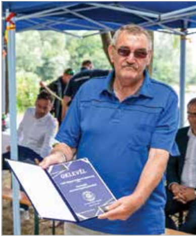
A köszöntöket követően az egyesület emléklappal mondott köszönetet a támogatóknak és a társszervezeteknek

Szél és szemerkélő eső fogadta a tavakhoz érkező ünneplőket, ám a születésnapos egyesület tagjainak