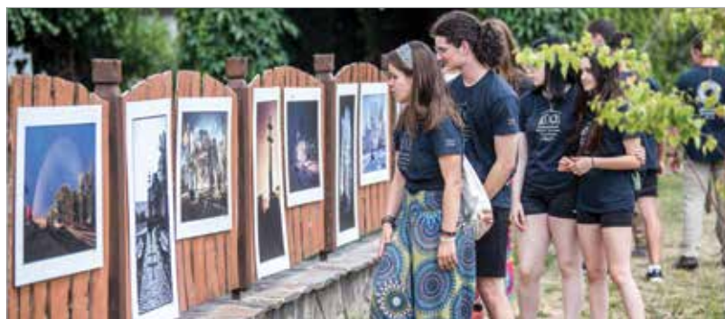
Nagy érdeklődés kísérte a Trianon-kiállítást is