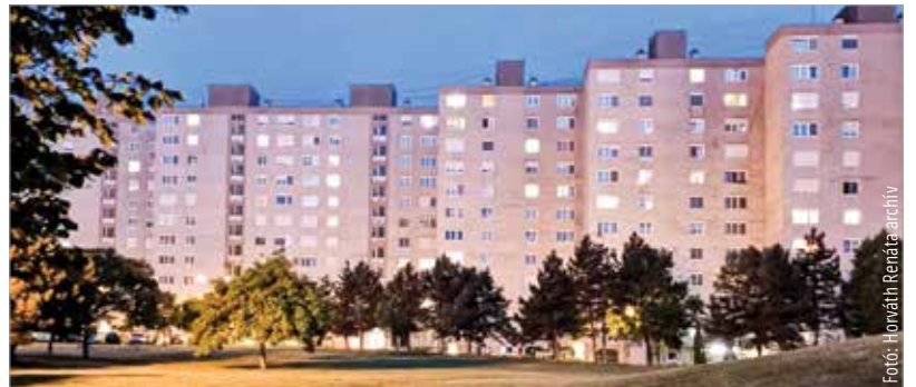
Az augusztusi közgyűlés után derül majd ki, hogy kik jogosultak az önkormányzati rezsitámogatásra

A jogosultak körét szociális alapon határozzák meg, cél, hogy az egyedül élő alacsony jövedelműeket, valamint a gyermeküket vagy gyermekeiket egyedül nevelőket segítsék. A támogatásokat csak azok vehetik majd igénybe, akik nem tudnak a kormányzat által meghatározott fogyasztási keretekbe beférni, és jövedelmük nem teszi lehetővé az átlag feletti fogyasztás kifizetését. A polgármestertől megtudtuk, hogy a támogatási program részleteinek kidolgozása folyamatban van, a pontos feltételekről és az igényelhető összegekről várhatóan az augusztusi közgyűlésnek kell majd döntenie.