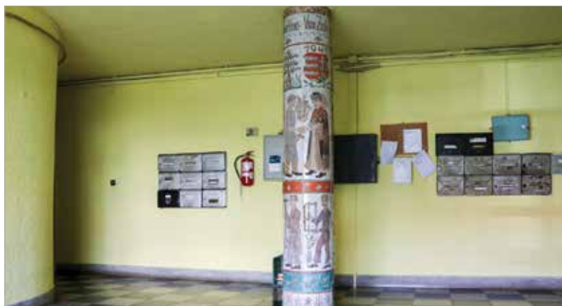
A környezet nem a legszebb, de az oszlopdísz jó állapotban van!

a remekmű nem más, mint egy fantasztikus oszlopburkolat, mely Kovács Margit keramikus keze munkáját dicséri. Az oszlopdísz tematikája bizony zavarba ejtően sokrétű, hiszen a természetet idéző virágmintákon kívül megtalálható rajta a Kossuth-címer, feltűnik több iparos alakja mellett Szent István király is, illetve megörökíti a valamiért