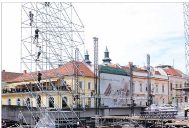
Épül a Koronázási szertartásjáték színpada a Nemzeti Emlékhelyen