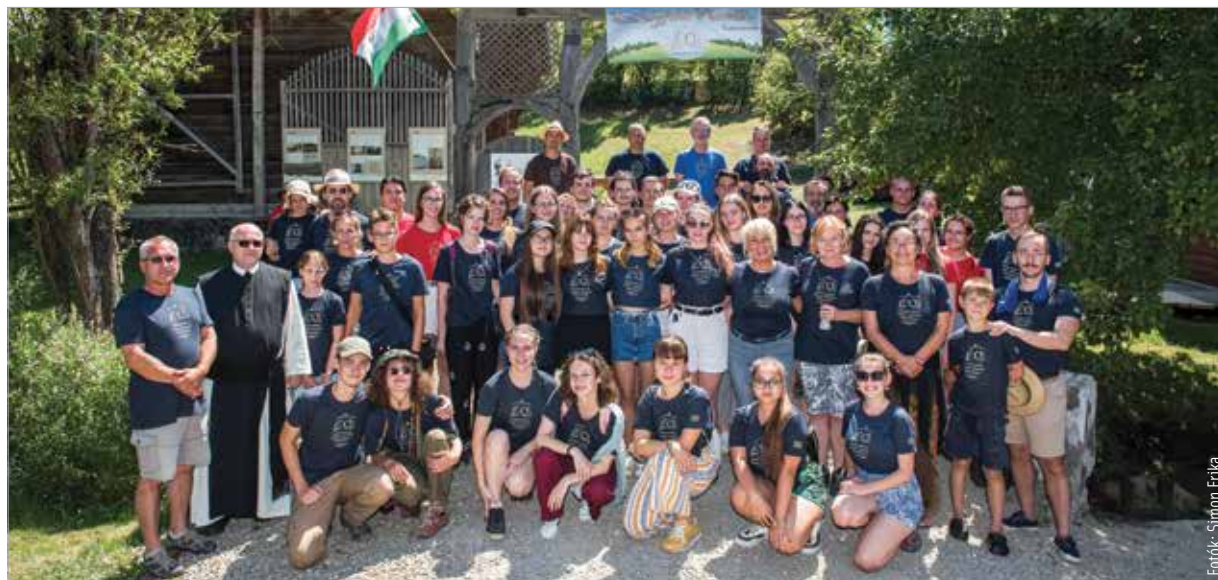
Együtt a verstábor résztvevői