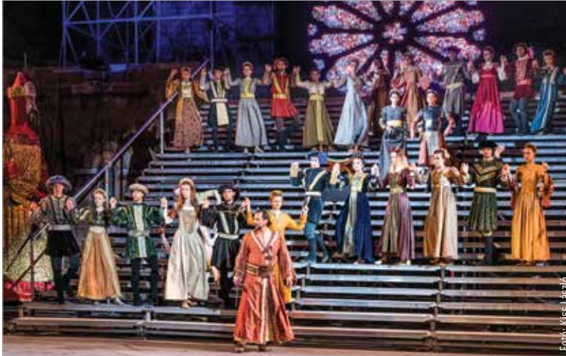
Grandiózus hangzás- és látványvilággal zárja a Koronázási szertartásjátékok sorát a III. András – Az utolsó aranyágacska című előadás

Javában zajlik a V. Kárpát-medencei Színjátszó Tábor Székesfehérváron, melynek keretében határon túli magyar diákok mélyülhetnek el a színjátszás rejtelmeiben. A hét folyamán a fiatalok lehetőséget kapnak arra, hogy a Székesfehérvári Királyi Napok keretében megrendezendő Koronázási szertartásjátékban is szerepeljenek.