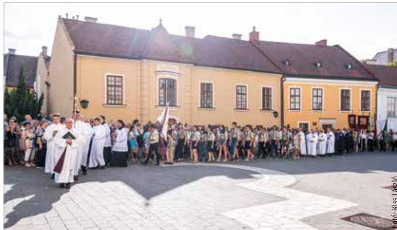
A magyar szent család, Szent István, Boldog Gizella és Szent Imre ereklyéi körmenetben érkeztek meg vasárnap délután a Püspöki Palotából a megújult székesegyházba