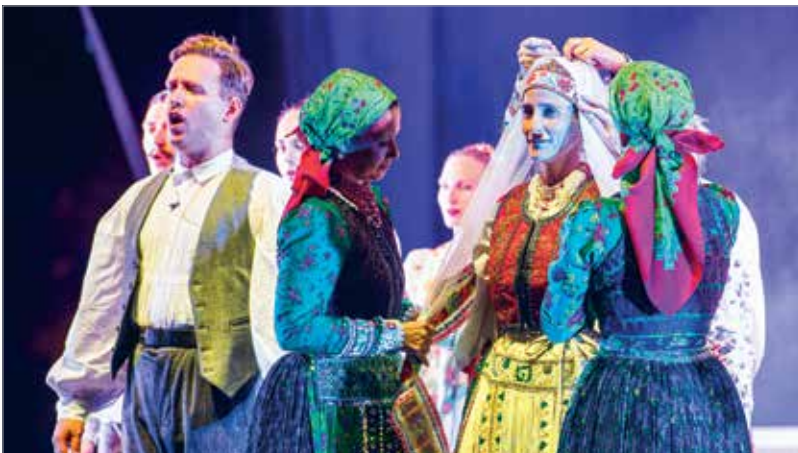
Az élet nagy, sorsfordító pillanatai énekszóban elmondva