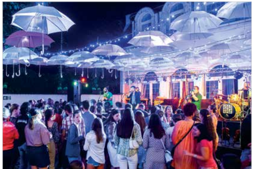
Az előadásokat tánczási mulatság és koncertek követték