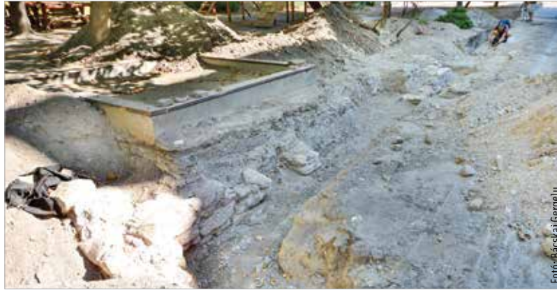
A korábban régészeti szempontból szinte fehér foltnak tekinthető Budai külváros térképére felkerült az első középkori épület részlete