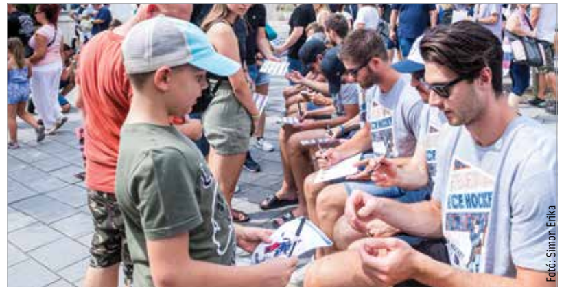
Nyári kulisszák között is népszerűek a hokisok, de már mindenki a jéges szezont várja

A Hydro Fehérvár AV19 szeptember elsején kezdi meg BL-szereplését, első ellenfele hazai jégen a svájci Zürich Lions lesz, majd két nappal később a címvédő svéd Rögle érkezik a Raktár utcába. A csoport negyedik tagja a GKS Katowice. A lengyel gárdával október negyedikén és tizenkettedikén találkoznak a fehérváriak.