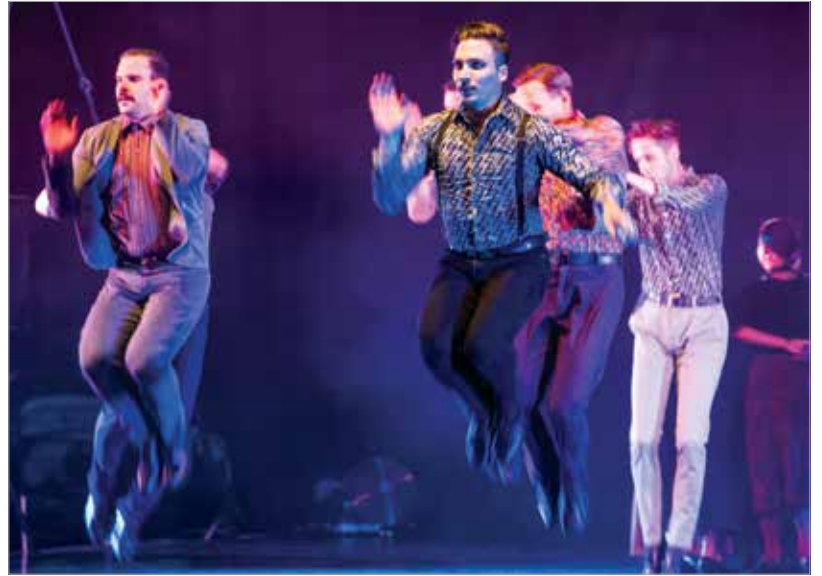
A Duna Művészegyüttes koreográfiája a történetmesélésen alapult

Szombat este ünnepélyes megnyitóval kezdődött el a Királyi Napok Folkfesztivál. A nyitányon alapfokú művészeti iskolák növendékei és tánclegendák műsorát láthatták a népi kultúra barátai, a következő három napon pedig a Fitos Dezső Társulat, A Duna Művészegyüttes, az Állami Népi Együttes, a Jászsági Népi Együttes, valamint Ferenczi György és Pál István „Szalonna” együttese léptek színpadra.