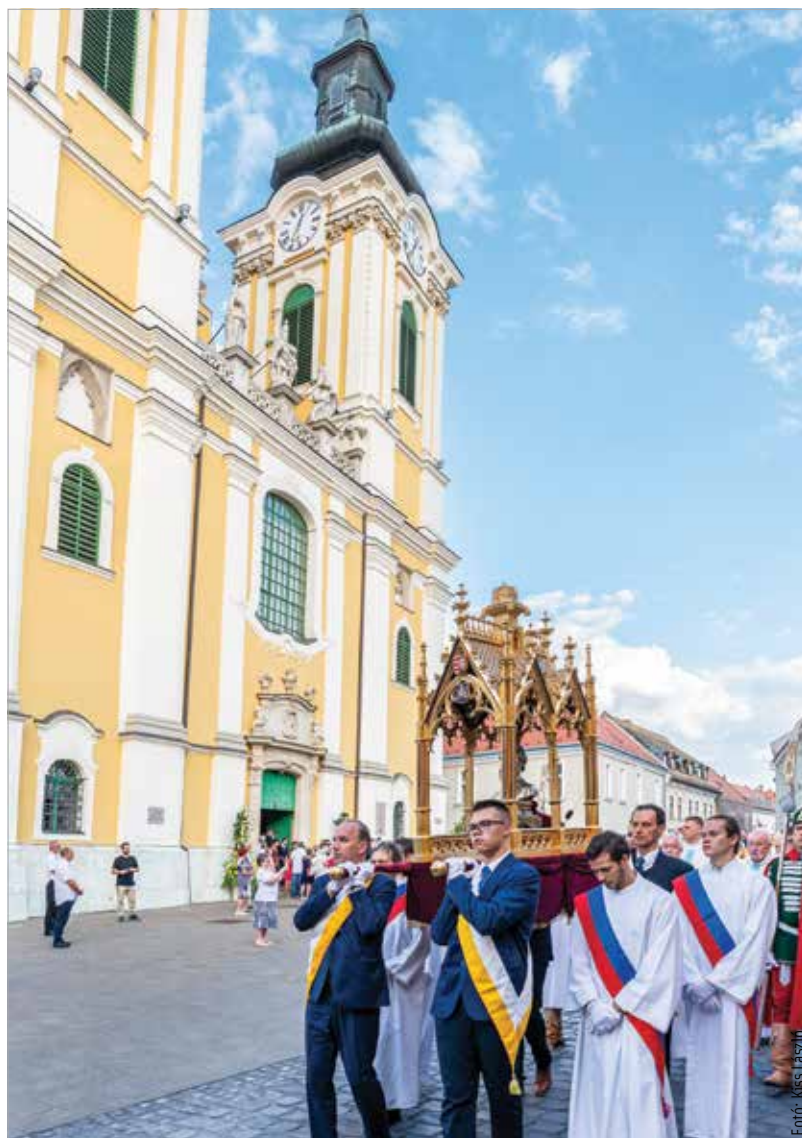
A székesegyházat 2018 áprilisában zárták be. A külső felújítás után a templom hajójában 2018 augusztusa és októbere között régészeti ásások kezdődtek, 2019 januárjában pedig megindulhattak a belső felújítási munkálatok. A felújítás során kétezer négyzetméter falképet tisztítottak meg, konzerváltak, állítottak helyre. A főoltárképpel együtt hatvanhat négyzetméter vászonképet, az altemplomban százharminchat sírtáblát restauráltak.