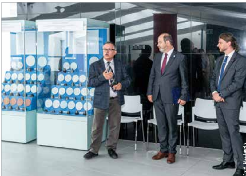
A tárlat számos különlegességgel várja az érdeklődőket

A tárlaton az őskortól egészen a XX. század első feléig tartó időszakból láthatnak szépen megmunkált darabokat az érdeklődők. A kiállítás több mint kétszázötven aranytárgyat mutat be: legnagyobb számban pénzérméket, függőket, fülbevalókat, gyűrűket. A tárlat augusztus 31-ig ingyenesen látogatható a Szent István Király Múzeum rendházépületében, a Fő utca 6. szám alatt.