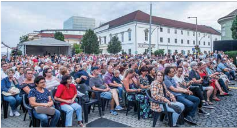
Minden este telt ház előtt mutakozhattak be az együttesek