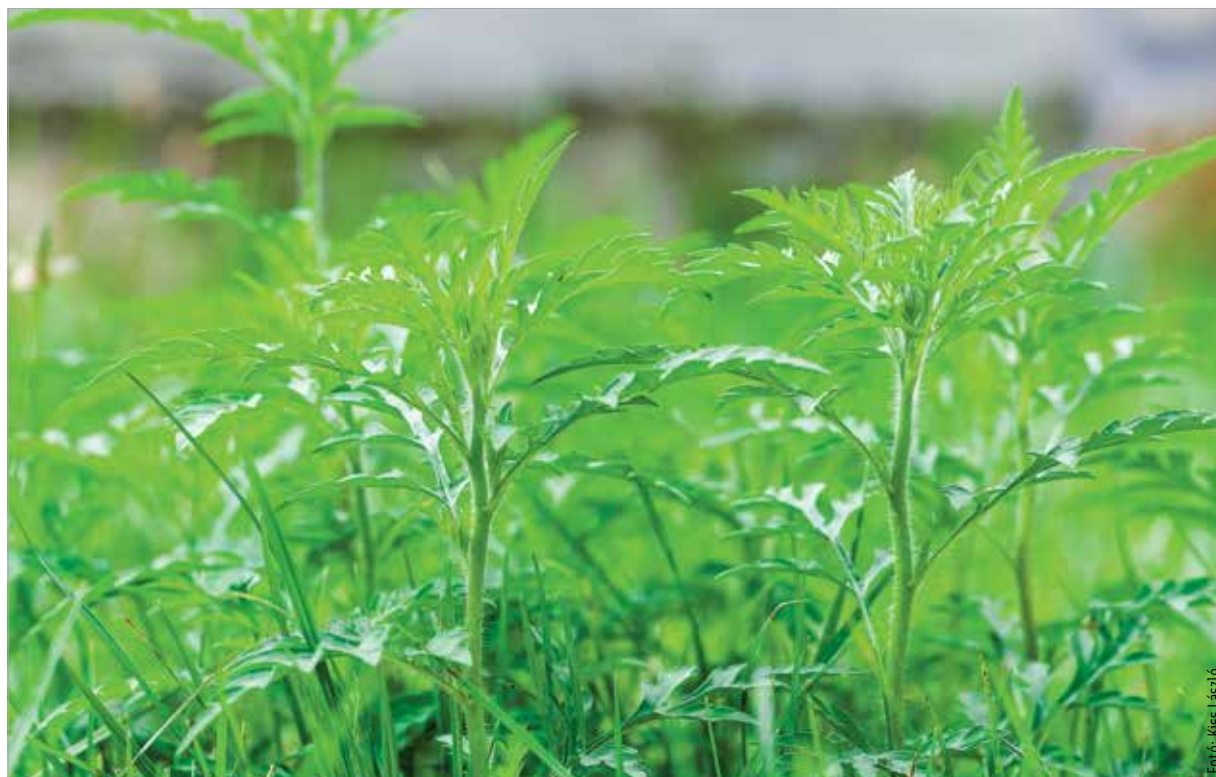
A statisztikai adatok szerint a legtöbben a parlagfű virágpórára érzékenyek

Fontos odafigyelni arra is, hogy a pollenallergia más érzékenységgel is társulhat, és így keresztallergia alakulhat ki. Ez azt jelenti, hogy valamilyen friss zöldség vagy gyümölcs elfogyasztása túlérzékenységi reakciót vált ki olyan embereknél, akik valamilyen növényi pollenre allergiások. A