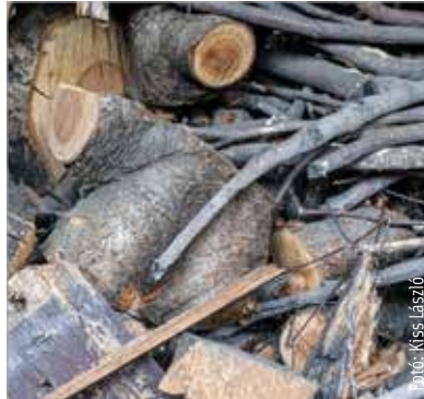
Tűzifa vásárlásához is lehet igényelni önkormányzati rezsitámogatást

A támogatás mértéke kapcsán a polgármester elmondta: mérvadó volt az, hogy az önkormányzat a most elképzelhetőnek tartott legmagasabb számú jogosult esetében is ki tudja gazdálkodni