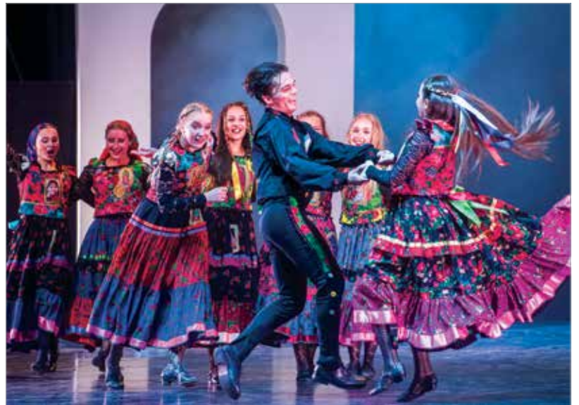
A Fitos Dezső Társulat tagjai nem spóroltak az energiával: csupa tűz és lendület jellemezte fellépésüket