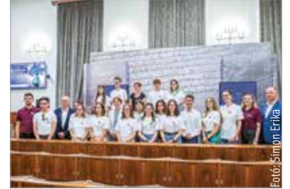
Határon túli színjátszókat köszöntött a polgármester a Városházán

Cser-Palkovics András kedden fogadta a Városházán azokat a felvidéki fiatalokat, akik a Kárpát-medencei Színjátszó Táborba érkeztek, és szerepet kaptak a Koronázási szertartásjátékban, melynek idején, tizedik epizódja a III. András – Az utolsó aranyágacska címet viseli. A polgármester köszöntőjében úgy fogalmazott: a fiatalok jelenléte kapcsolódik az előttünk álló egyedülálló előadás szellemiségéhez, ami a nemzet történelméről szól a nemzet történelmi fővárosában. Hornung Ágnes, a Kulturális és Innovációs Minisztérium államtitkára kiemelte: Magyarországnak ugyanolyan fontos az, hogy most itt lehetnek, mint a határon túl élő fiataloknak, hiszen „...egy nemzet vagyunk, számunkra nem léteznek határok!” A Rákóczi Szövetség, Székesfehérvár és a Vörösmarty Színház között néhány évvel ezelőtt született meg az együttműködés, melynek célja, hogy a határon túli magyar diákok is részesei legyenek szellemi és kulturális örökségünknek.