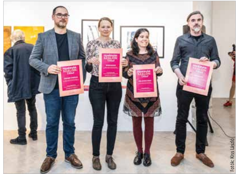
A Fehérvár Szalon díjazottjai