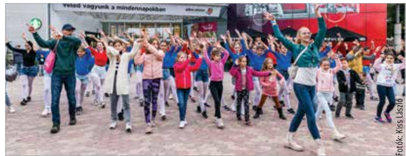
A közös tánc öröme

Székesfehérvár tánciskolái is csatlakoztak a IV. Nagy Táncválasztó elnevezésű programhoz.