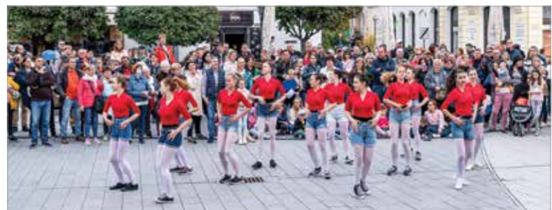
Rengeteg érdeklődőt vonzott a táncos flashmob

célja a táncműfajok megismertetésén túl a tánc és a mozgás széles körben történő népszerűsítése volt, hogy minél többen a táncban találhassák meg az egészséges életmódhoz, a tudatos mozgáshoz és a közösségi élményhez vezető utat.