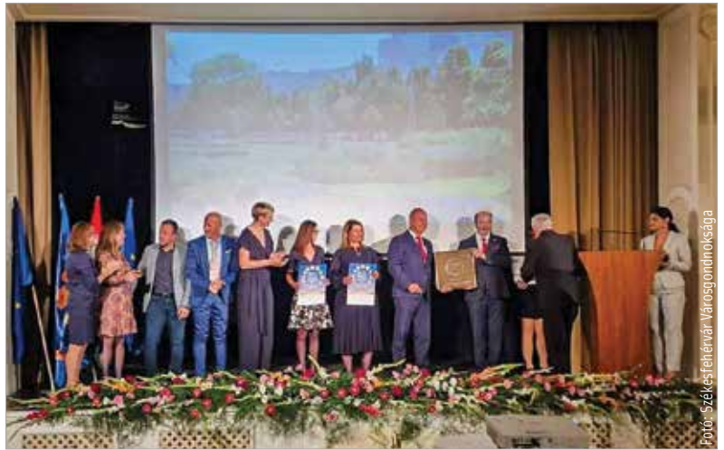
Múlt héten szombaton, Balatonfüreden tartották az Entente Florale idei díjátadóját