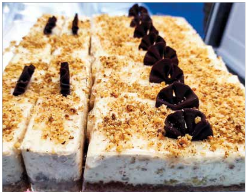
További őszi finomság az almás-diós sütemény

Fehérjetartalma elenyésző, szénhidrát viszont bőven van benne, akárcsak rost, így bátran beépíthető az egészséges étrendbe! 100 gramm friss füge 232 milligramm káliumot tartalmaz, ami a napi szükséglet körülbelül 5 százaléka, és segít abban, hogy izmaink és szívünk megfelelően működjön. Ugyanekkora mennyiségben 4,7 mikrogramm K-vitamin is található, ami a napi szükségletünk 5 százalékát fedezi, és segít, hogy vérünk minősége megfelelő legyen. A gyümölcsben ezenkívül vas, kalcium, magnézium, folsav és A-vitamin is található.