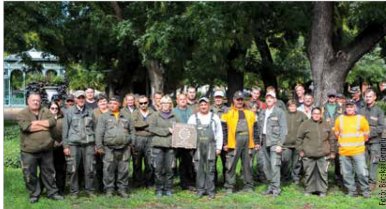
A zöld terek gondozásáért különdíjat is kapott Székesfehérvár