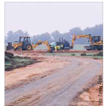
Tereprendéssel kezdődtek a munkák

Arra kérik az Alsóvárosi-réten szabadidejüket eltöltőket, hogy a következő időszakban a kerékpárúttól nyugatra eső területet vegyék