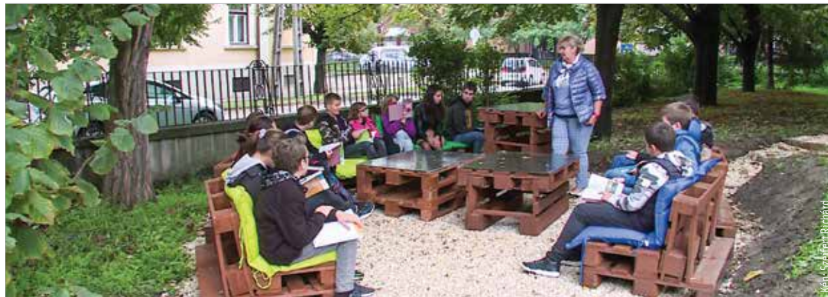
A diákok élvezik a szabadtéri osztálytermet

„Építünk egy osztálytermet, méghozzá egy szabadtéri osztálytermet ennek az iskolának a kertjébe, jött az ötlet! Miután ez egybeesett a Hydro társadalmi felelősségvállalási kezdeményezéseivel, valamint azokkal az alapítványokkal, amiket a Hydro világszerte, így Székesfehérváron is támogat, a cég azonnal mellénk állt,