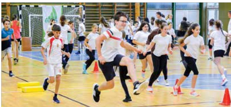
Gyorsabban, magasabbra, erősebben!