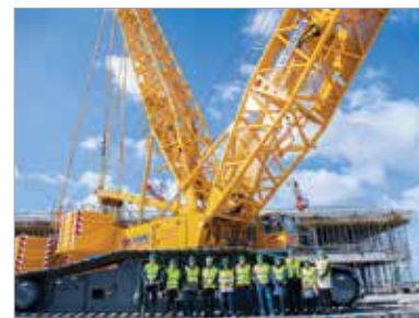
A tetőszerkezetet tartó elemeket egy hétszázötven tonna teherbírású, lánctalpas daruval emelik be

„Fontos azt is kiemelni, hogy nemcsak egy épület, hanem egy kiegészítő infrastruktúra is létrejön: sok száz parkolóval és egy bekötőúttal, mely nemcsak a csarnokot fogja a Budai úttal összekötni, hanem az Alba Ipari Zónát is. Így az ott dolgozó