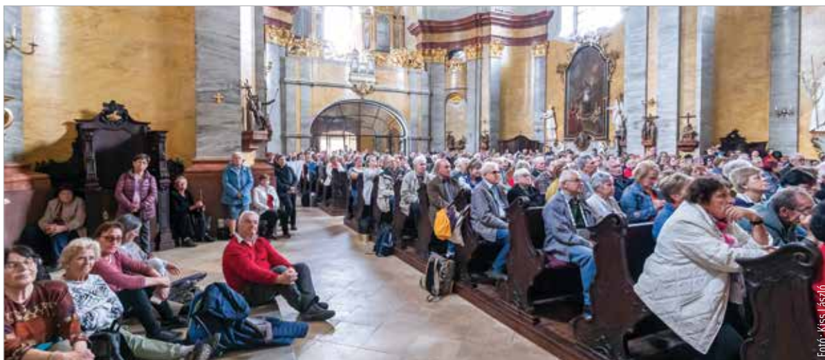
A résztvevők megnézték államalapító királyunk, Szent István szarkofágját, a felújított Szent István-székesegyházat, és az Aranybüllához is elzarándokoltak

„A zarándoklat egyrészt egy találkozás számunkra. Másrészt pedig imádkozunk a nemzetért. A zarándoklatot mindig a nemzetnek ajánljuk. Most sajnálatos aktualitása van annak is, hogy a békeségért imádkozunk, nemcsak belpolitikai szinten, hanem külpolitikailag is, hiszen a nemzetért való imánk egy nagy egységbe ágyazódik bele - abba, hogy béke legyen körülöttünk is! Így tehát a békéért ajánljuk fel ezt a zarándoklatot.” A KÉSZ harmincöt csoportjának több mint ötszáz tagja jött el az egész napos programra. Magyar-