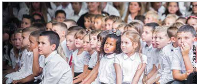
A megjelent rendelet szerint őszi szünet nem adható ki, a téli hosszabb lesz

Hogy a spórolást lehetővé tegyék, hosszabb lesz az idei téli szünet: december huszoneketedikétől január nyolcadikáig tart majd. Ebben az időszakban kormányzati igazgatási szünet is lesz. Gulyás Gergely arról is tájékoztatta, hogy Balla György miniszteri biztos feladta lesz, hogy koordinálja a tárgyalásokat az önkormányzatokkal a kiadáscsökkentésről, főleg az energetikai területen. Minden önkormányzattal külön fognak tárgyalni.