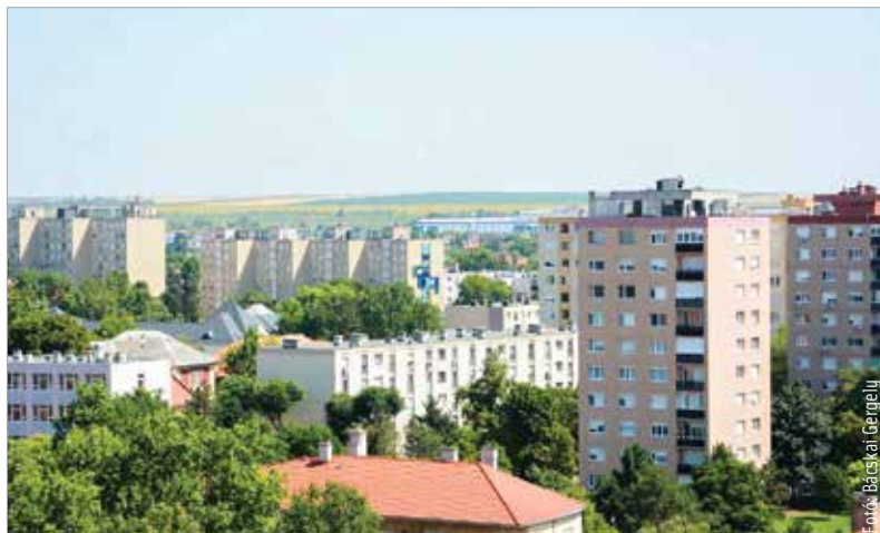
A lakossági távhődíjak a jelenlegi fűtési szezonban nem változnak

A polgármester példaként egy negyvenöt négyzetméteres lakást