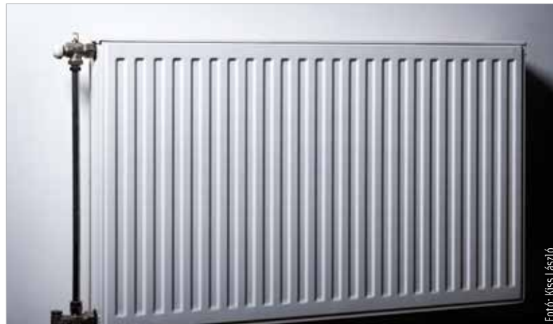
A SZÉPHŐ-vel történő egyeztetés után véglegesíti az önkormányzat a városi takarékosági intézkedéseket

említett, melynek jelenlegi, hozzávetőlegesen hétezer forintos havi távhőszámlája körülbelül százötven forintra ugrana, ha a piaci árat kellene fizetni. Hozzátette: a rendelet és annak mellékletei rendkívül specifikusak, így feltétlenül szükség van a SZÉPHŐ-vel való részletes egyeztetésre: „Ezen