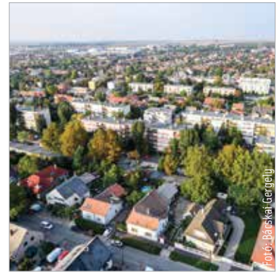
A munkaerőpiaci szegmensben városunk a harmadik lett

A 60,4 ponttal negyedik helyezett Debrecen tavaly még a tizenkettedik volt a listán. Az első tízben a következő, vagyis az ötödik Székesfehérvár (60,3 pont), majd Szekszárd (59,9), Pécs (58,9), Szombathely (58,4), Zalaegerszeg (57,2) és Kaposvár (55,3) következik. A sor végén pedig Kecskemét, Salgótarján és Békéscsaba található, Budapesthez képest kevesebb mint feleannyi, 42,1, 41,6, valamint 39,2 ponttal. A részmutatókat tekintve az oktatásban Győr áll az élen a megyeszékhelyek közül. A második Budapest, a harmadik pedig Veszprém. A kultúra terén Budapest az első hely, a második helyezett Szolnok csupán a főváros pontszámának valamivel több mint harminc százalékát szerezte meg. A harmadik Zalaegerszeg, amelyet Székesfehérvár és Pécs követ a sorban. Az egészségügyi mutató Szekszárdon volt a legjobb, szorosan követi Pécs és Veszprém. A korábban első helyezett Miskolc a fővárost megelőzve a negyedik helyen áll. A megyeszékhelyek közül Debrecen tekinthető a legbiztonságosabbnak. A második helyen Veszprém, a harmadikon Zalaegerszeg található, majd Békéscsaba és Szeged következik. A főváros ebben a kategóriában gyengén teljesített, a