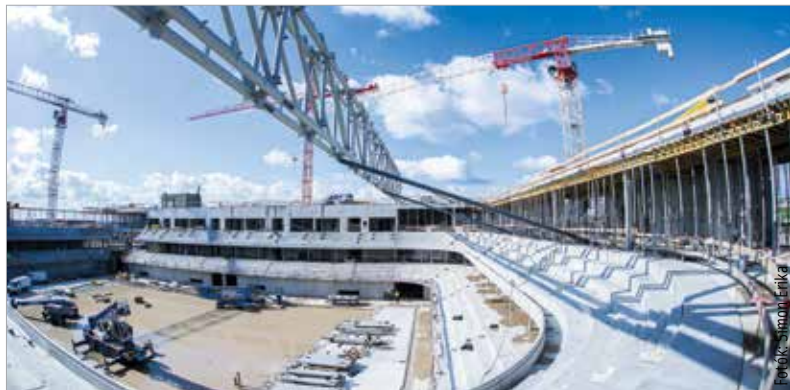
Ütemterv szerint halad az Alba Aréna építése

Az Alba Aréna épülete már látványosan magasodik a Budai út mellett. Tavaly novemberben adták át a munkaterületet, és az azóta eltelt tizenegy hónapban a csarnoképület vasbeton szerkeze-