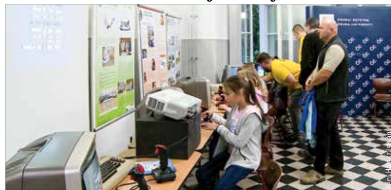
Szórakoztató, inspiráló előadások, kísérletek, laborbejárások és játékos programok is várták a látogatókat az Obudai Egyetem Alba Regia Műszaki Karán, mely idén is csatlakozott a Kutatók éjszakájának mintegy kétezer országos programjához