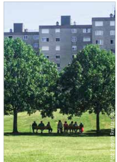
Sok család lélegezhetett fel

kamathoz volt kötve. Mértéke mostanra már tizenhárom százalékra emelkedett, ami komoly terhet jelent. Ráadásul egyes családok az alapkamat ötszörösének megfelelő késedelmi kamattal is szembesülhetnek, ez jelenleg évi hatvanöt százalék. A kormány döntése nagy segítséget jelenthet az érintetteknek, ugyanis a büntetés mértékét öt százalékban maximalizálják – jelent meg a Magyar Közlönyben.