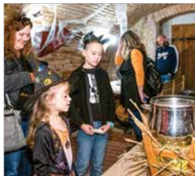
A Hiemer-házban kőlyökhaloween és kísértetséta várta a családokat

lottak szabadon járhatnak közöttünk. Számos szertartás kapcsolódott ehhez az ünnephez, melyek célja az volt, hogy távol tartsák a szellemeket. Ez a hagyomány később keveredett több római ünneppel, és beépült a római katolikus egyház által tartott minden-szentek és halottak napja ünnepkörébe. Az ősi hiedelmek szerint október utolsó napján az eltávozott lelkek útra kelnek, és megpróbálnak visszatérni az élők világába. Az emberek tűzgyújtással, felvonulással, valamint különféle jelmezbe öltözve megpróbálták megtéveszteni a szellemeket, hogy maradjanak távol otthonaiktól.