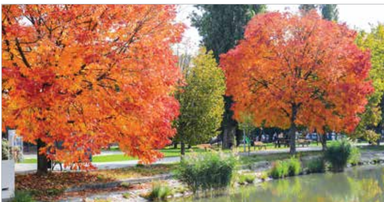
A Csónakázó-tó környékén romantikus sétákat tehetünk