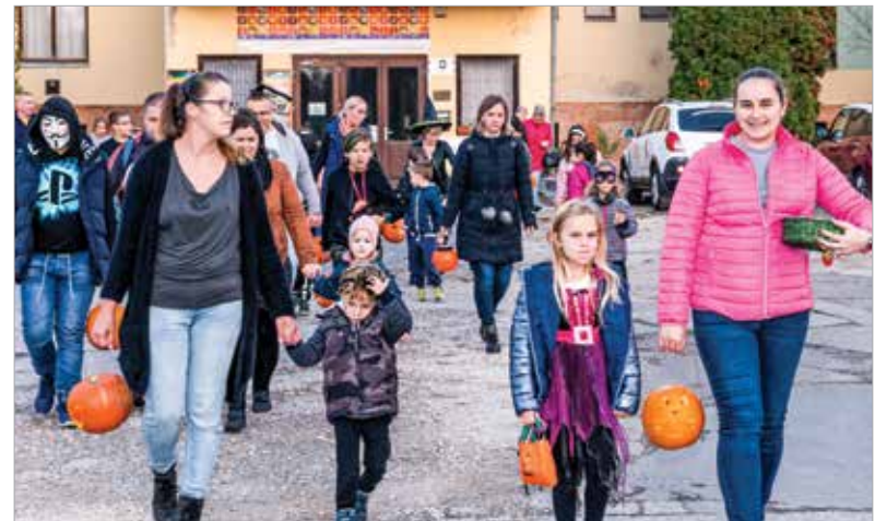
A gyerekek és szüleik az elkészült lámpásokkal vonultak végig Maroshegy utcáin, hogy rémisztgessék az ott lakókat, és édességet gyűjtsenek maguknak

lottak szabadon járhatnak közöttünk. Számos szertartás kapcsolódott ehhez az ünnephez, melyek célja az volt, hogy távol tartsák a szellemeket. Ez a hagyomány később keveredett több római ünneppel, és beépült a római katolikus egyház által tartott minden-szentek és halottak napja ünnepkörébe. Az ősi hiedelmek szerint október utolsó napján az eltávozott lelkek útra kelnek, és megpróbálnak visszatérni az élők világába. Az emberek tűzgyújtással, felvonulással, valamint különféle jelmezbe öltözve megpróbálták megtéveszteni a szellemeket, hogy maradjanak távol otthonaiktól.