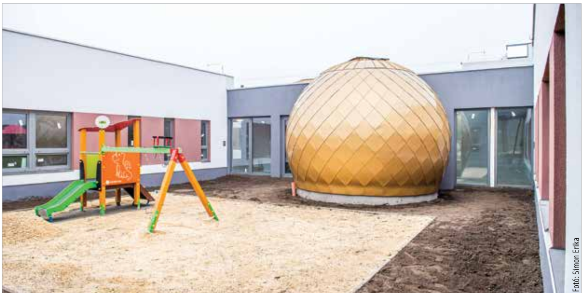
A bölcsőde épületéhez három gömb ad látványban és funkcionalitásban pluszt. Ezekben szósza és fejlesztőhelyiségek kapnak helyet. Az útkapcsolat kiépítése, a járda és a zebra kialakítása tavasszal kezdődik.

A modern, különleges kialakítású épület szinte már teljesen elkészült. A külső környezetben is folyamatosan dolgoznak a szakemberek, a játszótér eszközei is a helyükön vannak. A tervek szerint a bölcsődeket szeptemberben már ide hozhatják reggelente a szülei. Mészáros Attila, Székesfehérvár alpolgármestere hangsúlyozta: „Kiemelt jelentősége van ennek a beruházásnak, hiszen az utóbbi években számtalan bölcsődét, óvodát újjátunk fel, építettünk át, de zöldmezős beruházásban régen volt a városnak lehetősége új intézményt építeni.” Mint Brájer Éva, a városrész önkormányzati képviselője elmondta, egy bölcsőde létesítésére már nagyon vártak a Maroshegyen élők: „Ez a város legnagyobb választóköre, mind területét, mind lakosságát tekintve. A belvárosban most éppen csökken a gyereklétszám, itt, a város