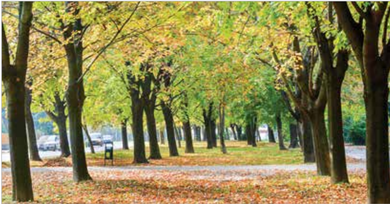
Székesfehérvár közterületein mintegy nyolcvanezer fa található

Miközben zajlik a fásítás és az erdőtelepítés az Alsóvárosi-réten, az elmúlt években rendbe tett parkokban már gyönyörködhetünk a növények színes kavalkádjában.