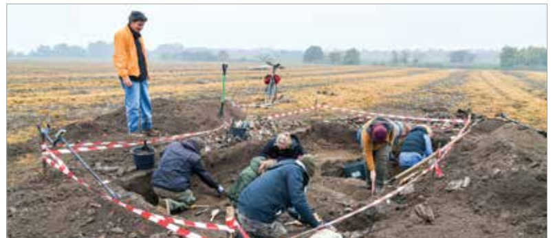
Egy római épületbe bontottak bele az illegális kincskeresők