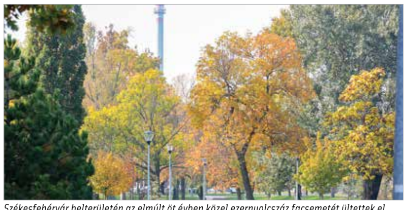
Székesfehérvár belterületén az elmúlt öt évben közel ezernyolcszáz facsometét ültettek el. Emellett az elmúlt négy évben tizenhat hektárnyi új erdőt is telepítettek.