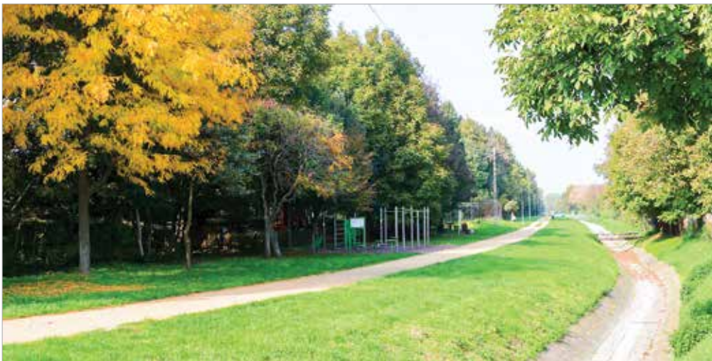
A Aszalvölgyi-árok mentén piknikezhetünk és edzhetünk is