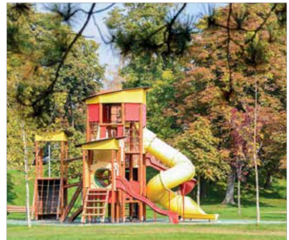
A Haleszban játszótér, tanpálya, futópálya, fitnesspark és kutya-futtató is épült