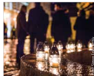
A fehérváriak az Országalmánál emlékezhetnek a szovjet invázió áldozataira

Magyarországon 2001-ben nyilvánították november 4-ét – október 6-ával együtt – nemzeti gyásznappá az 1956-os forradalom leverésének emlékére. 1956. november 4-én a hajnali órákban kezdődött meg a szovjet hadsereg magyarországi inváziója, melynek célja a forradalom leverése, a szocialista blokkból kilépni szándékozó, Nagy Imre által vezetett kormány megdöntése és a demokratikus rendszer totális felszámolása volt.