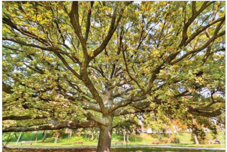
Városunk legidősebb fái több mint százévesek