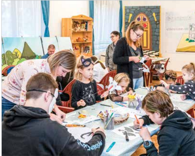
Boszorkányok, varázslók, szellemek járták a Gárdonyi Géza Művelődési Ház folyosóit is, ahol a gyerekek együtt készítették szüleikkel az ijesztőbbnél ijesztőbb tököket és díszeket