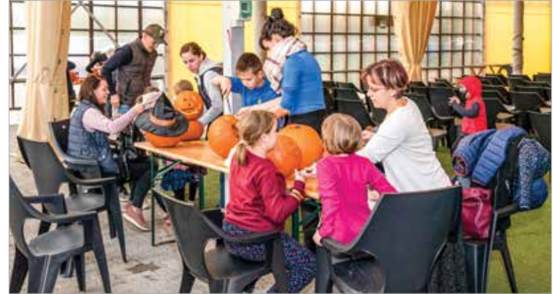
Kisebb és nagyobb tökfek, vidámak és ijesztők – mindenféle készült a Feketehegy-szárász-menti Kulturális Központban