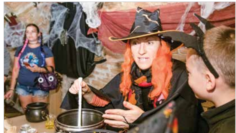
Az eredeti kelta hagyomány szerint október harmincegyediké éjszakáján a holtak szellemei visszatérnek, és mivel a hitük szerint beköltözhetnek az élőkbe, be kell csapni és el kell ijeszteni őket