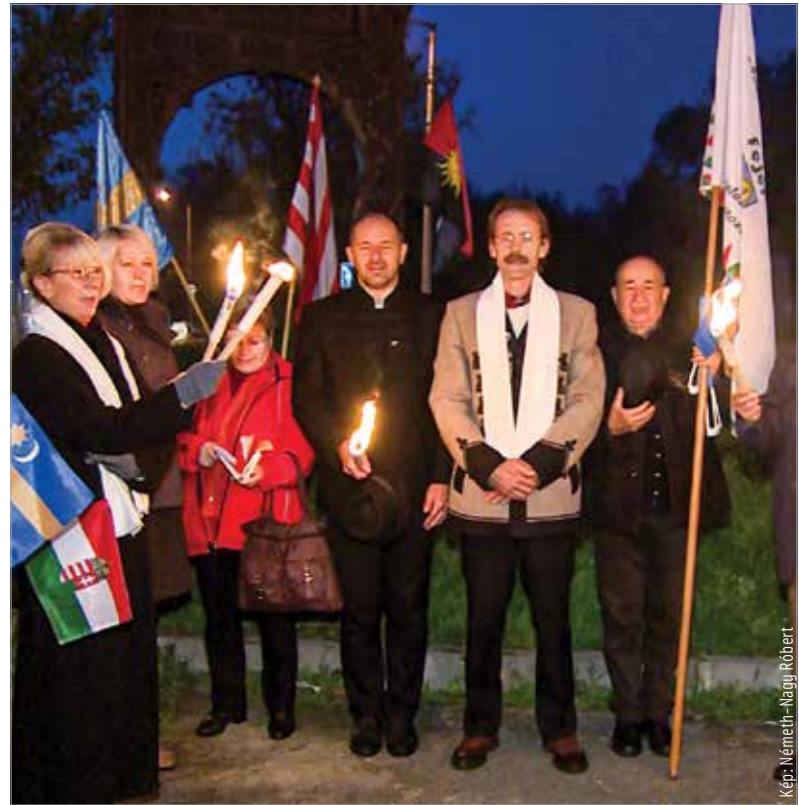
Az I. székelyfehérvári Székely Fesztivál zárásaként őrláng világított vasárnap, a székely autonómia napján a maroshegyi székelykapunál. A fátylák és mécsesek Csíkszereda és Székelyfehérvár testvérvárosi kapcsolatát, valamint a nemzeti összetartozást és a székelység önrendelési jogaiért folytatott küzdelmét jelképezték. F. Sz.