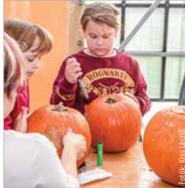
A szorgos kezek által szébbnél szebb alkotások születtek, hogy aztán mécsesekkel világítsanak

Nálunk is egyre népszerűbb ez az angolszász eredetű és a római-kelta időkre visszanyúló ünnep. A kelták egyik legszentebb ünnepe a Samhain volt, ami az új év, valamint a sötét és hideg évszak kezdetét is jelentette. A kelta hit szerint újév előestéjén, vagyis október harmincegyedikén a világ rendje felborul, fellobbannek az evilág és a túlvilág közötti határok, és az emberfeletti lények, valamint a ha-